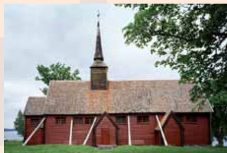
Kvernes stavkyrkje