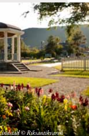
Lindstad © Riksantikvaren

spora av norsk byutvikling frå vikingtid til omkring 1950. NB!-registeret er tilgjengeleg for fylkeskommunar og de 69 kommunane som er med i registeret: http://nb.ra.no