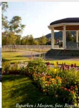
Byparken i Mosjøen