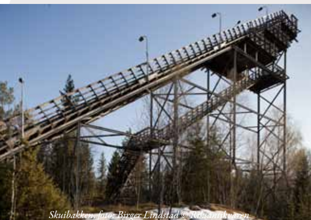
Skuibakken