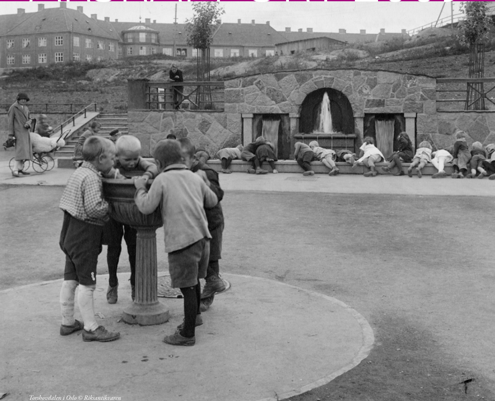
Torsbovdalen i Oslo