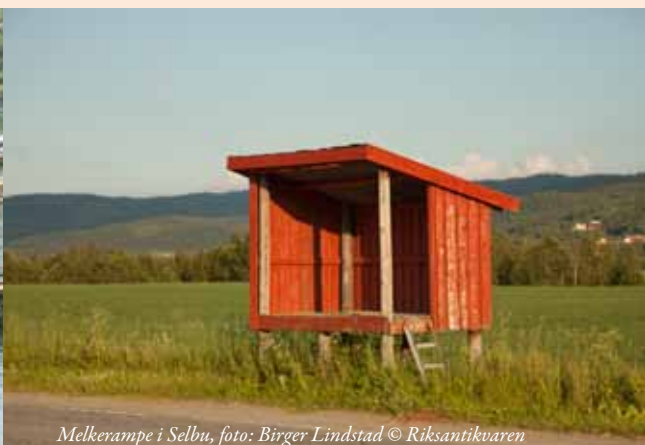
Melkerampe i Selbu