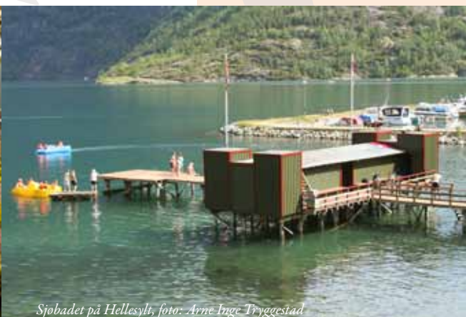
Sjøbadet på Hellesylt