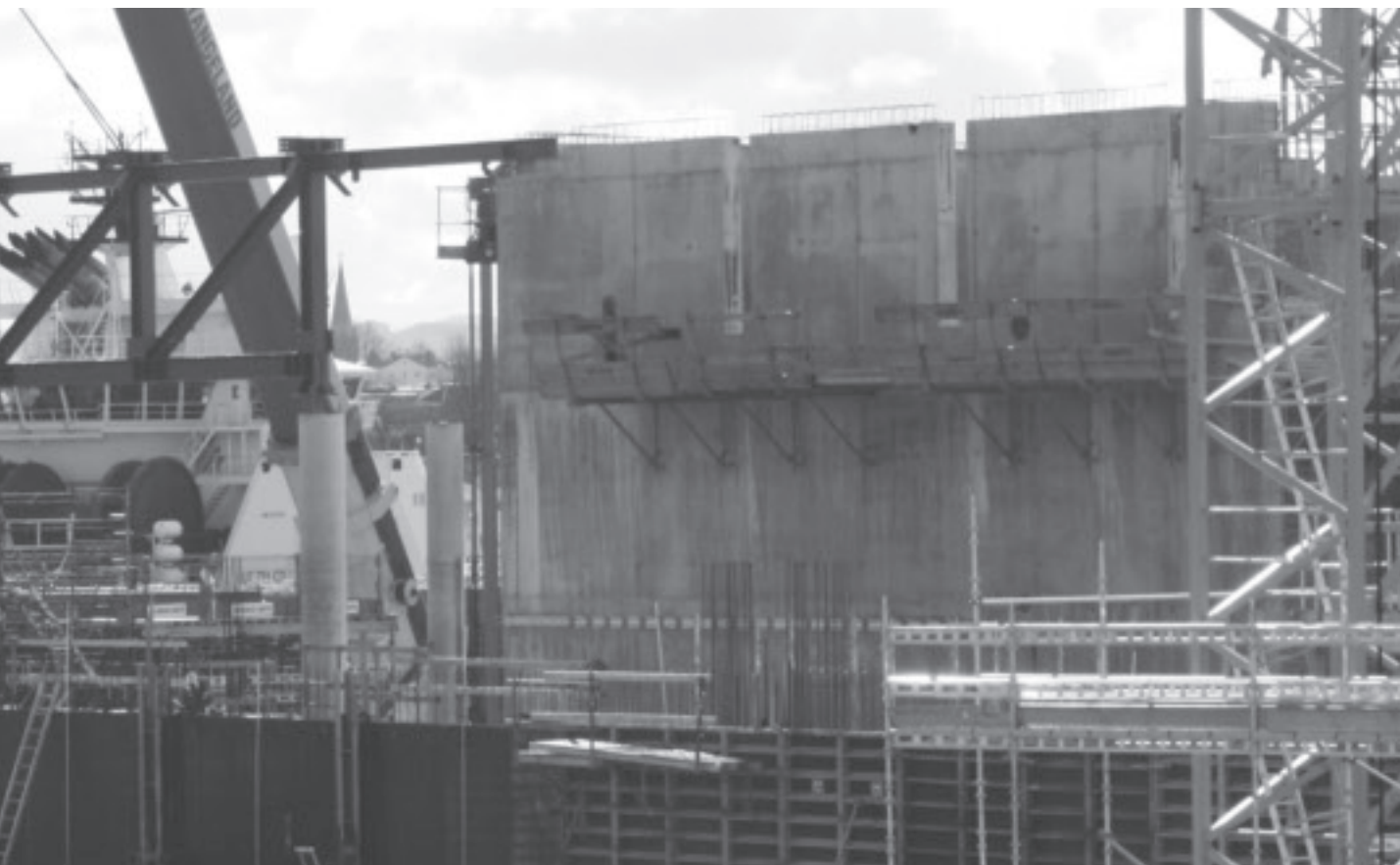
Den første store stålbjelken i takkonstruksjonen heises på plass over publikumsfoajeen.

Europeisk kulturhovedstad. Dette har slått ut også på publikumsstatistikken. Totalt hadde orkesteret 55.908 tilhørere på i alt 84 konserter i 2009. Ca 13.500 av disse var barn og unge.