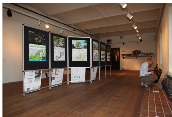
Utstilling i anledning arkitektkonkurransen. Fra monteringen.

I 2010 har de viktigste oppgavene vært knyttet til planlegging av nytt museumsbygg. Statsbygg har gjennomføringsansvaret for prosjektet og har i 2010 jobbet tett sammen med museet for å utarbeide romprogram, byggeprogram, brukerstyr, gjennomføring av plan – og designkonkurranse samt utarbeidelse av risiko- og sårbarhetsanalyse (ROS-analyse). Det har vært gjennomført møter med Kongsberg kommune under arbeidet med reguleringsplanen og sentrumsplanen. Arkitektkonkurransen fikk god pressedeckning i Laagendalsposten, og utstillingen av tegningene ble godt besøkt.