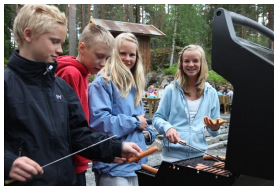
Fra den nye grill- og rasteplassen

Ny grill- og rasteplass til 100 personer sto ferdig til sesongstart 18.mai. Dette bidro til at kapasiteten på aktivitetsplassen økte, da spisingen foregikk på grillplassen istedenfor på aktivitetsplassen.