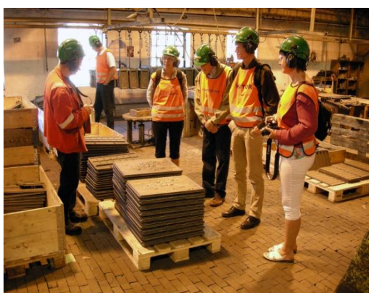
Sommertur til Telemark for alle ansatte. Her fra omvisning på Ulefos Jernværk

I samarbeid med Sølvverkets Venner ble det utarbeidet et årsprogram med foredrag og aktiviteter for 2010. I alt 29 foredrag og aktiviteter inngikk i programmet. De best besøkte arrangementene var KongsbergMarken, byvandring i anledning markeringen av bybrannen i 2010 og familiedagen på Haus Sachsen.