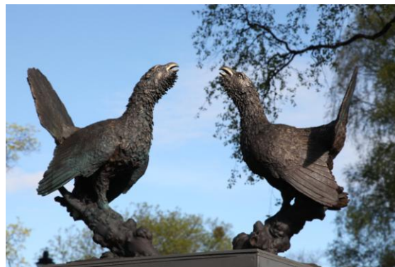
Øystein Mobråtens skulptur Urtiur

Bistand til Øystein B. Mobråtens skulptur- og tegningutstilling "Figurativ". "Ukens gjenstand", 14 ulike småutstillinger presentert i egen monter .