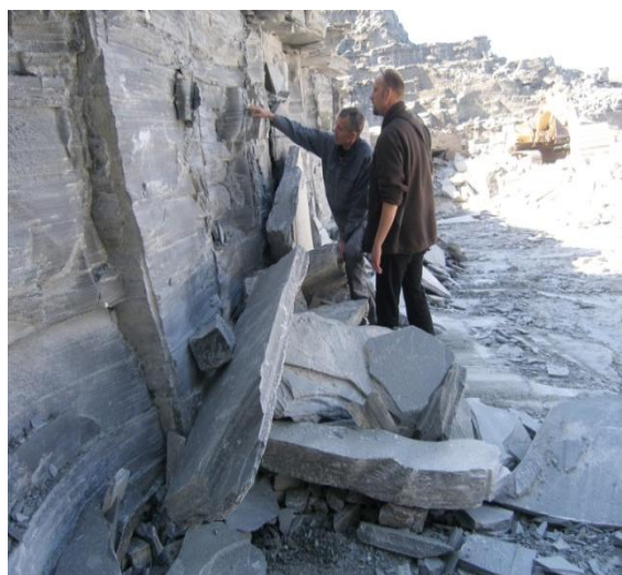
Skiferbruddet ved Pæskatunet, Alta