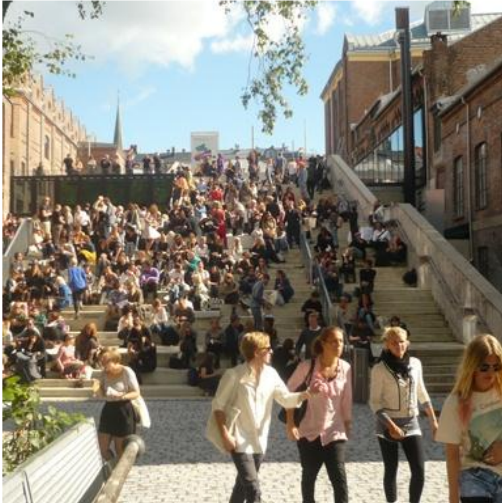
Vi er i hus! Fra semesteråpningen, høsten 2010.