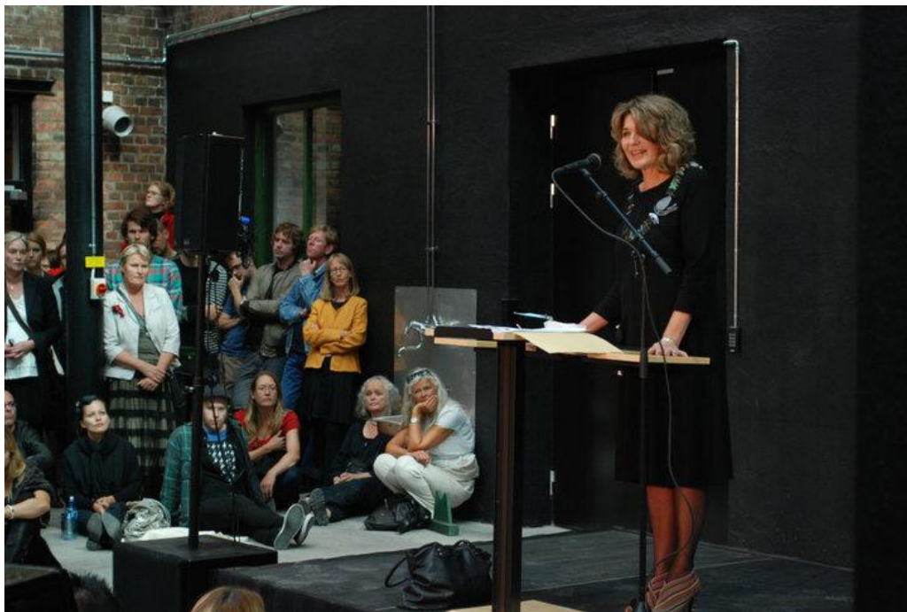
Rektors velkomsttale til studentene, første skoledag august 2011.