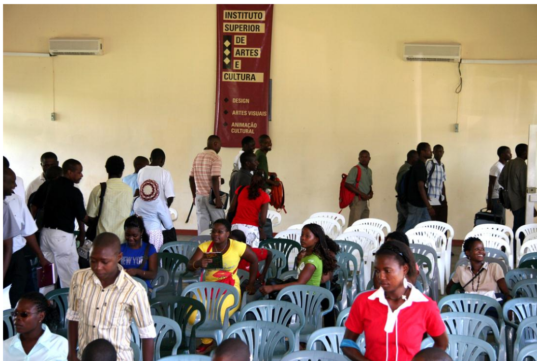
Fra designutdanningen i Mosambik ved Instituto superior de artes e cultura (ISAC) i Maputo.

Kunsthøgskolens engasjement i nord-sør-prosjekter dannet et godt grunnlag for søknaden høsten 2010 om godkjenning av studieprogram og tildeling av seks studieplasser under Kvoteordningen for studieårene 2011-2014.