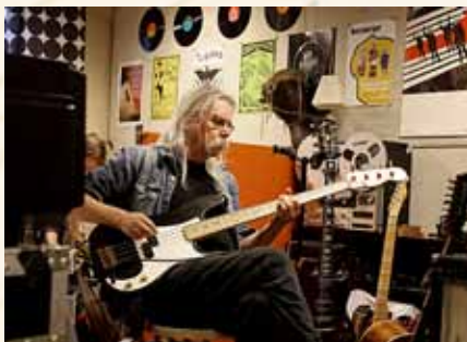
Nasjonalbiblioteket kjøpte i 2010 samlinga etter musikal, kulturhistorikar og forfattar Willy Bakken, betre kjent som Willy B.

Det blei i 2010 etablert ei ny teneste i NBdigital for tilgang til digitale aviser. Tenesta blei gjort tilgjengeleg for brukarar i lokala til Nasjonalbiblioteket i 2010. Aviser som Nasjonalbiblioteket har inngått avtale med om digitaliseringsarbeid, vil bli gjort tilgjengelege via den same tenesta i norske bibliotek i 2011.