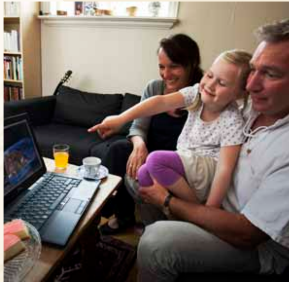
På bokhylla.no kan ein søkje og lese i 50 000 norske bøker.