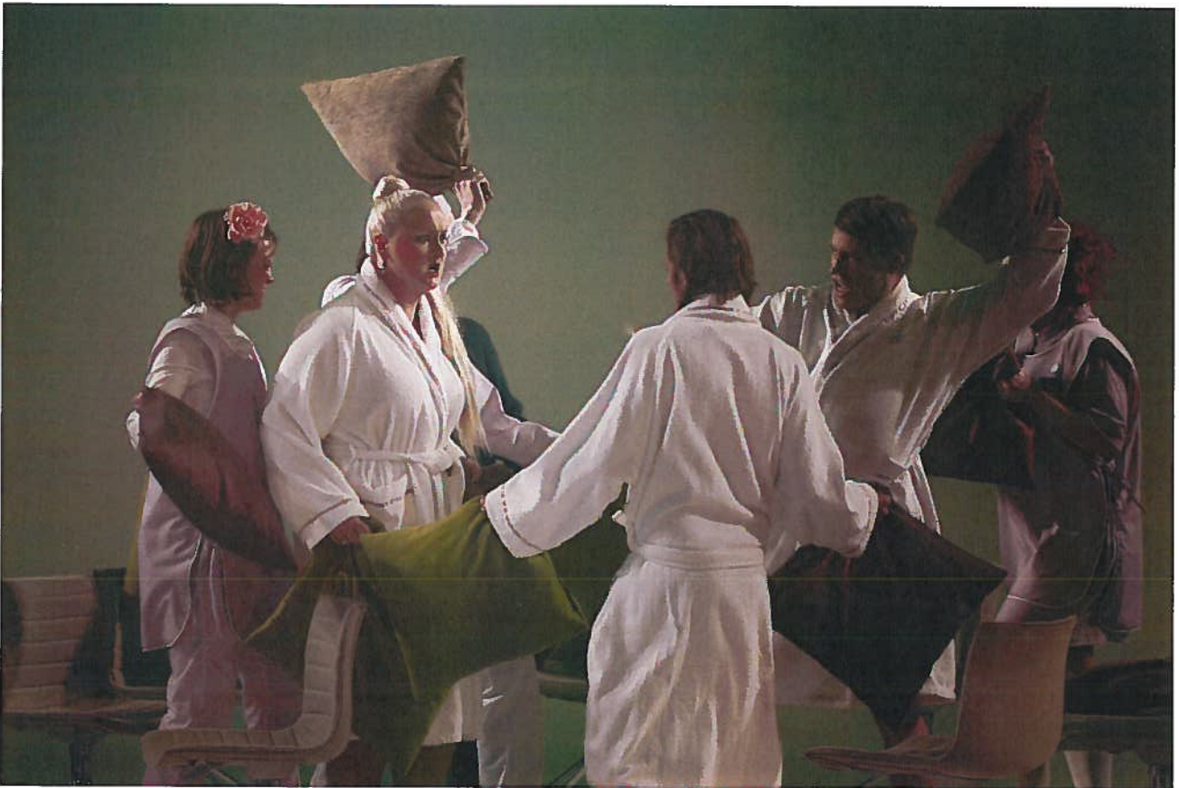
"La finta giardiniera" med Operahøgskolen på Den Norske Opera & Ballett.