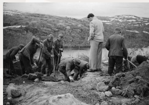
Graver ved Øvre Jernvann.

Riksantikvaren har startet en prosess med å frede og merke gjenværende spor etter fangeleirene fra 2. verdenskrig. I september 2011 fredet Riksantikvaren tuftene etter den såkalte Serberleiren fra 2. verdenskrig ved Øvre Jernvann i Narvik. Det finnes ikke lenger stående bygninger i området, men Riksantikvaren mener likevel det er riktig å verne stedet. Tuftene ved Øvre Jernvann er blant få spor som er igjen etter de rundt 500 tvangsarbeidsleirene som fantes i Norge under krigen. Leiren er også et gravsted. Under andre verdenskrig var det om lag 120.000 utenlandske krigsfanger i Norge. Nær 20.000 av disse døde. Fangene ble satt til å bygge veier, flyplasser, jernbaner og militæranlegg. Noen av anleggene inngår i den infrastrukturen vi bruker i dag - uten å kjenne til den blodige forhistorien.