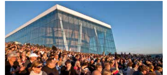
Sommer på Operaen