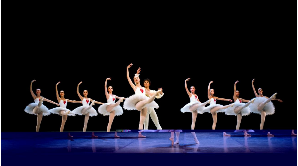
Fra avgangsforestillingen til BA klassisk ballett våren 2012