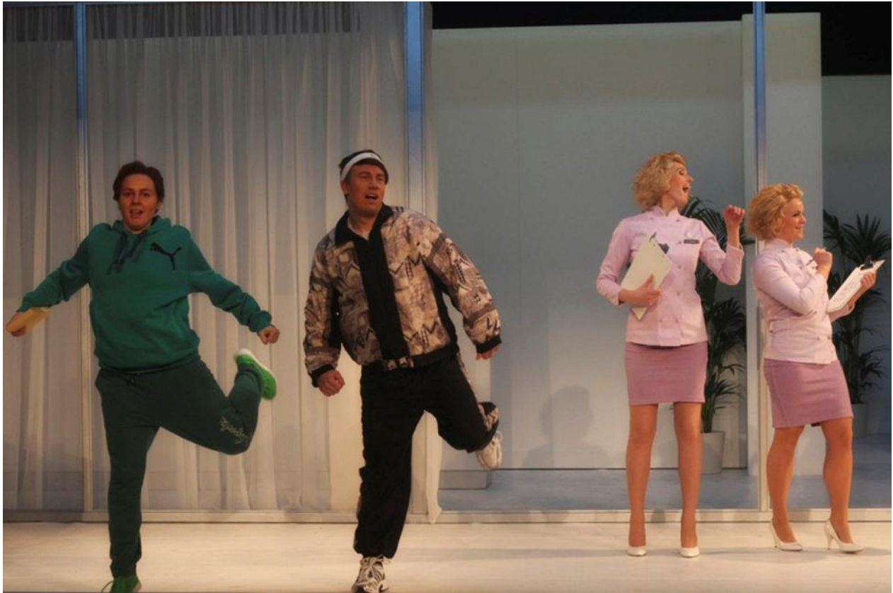
Fra Operahøgskolens avgangsforestilling på Scene 2 i Den Norske Opera & Ballett, februar 2012