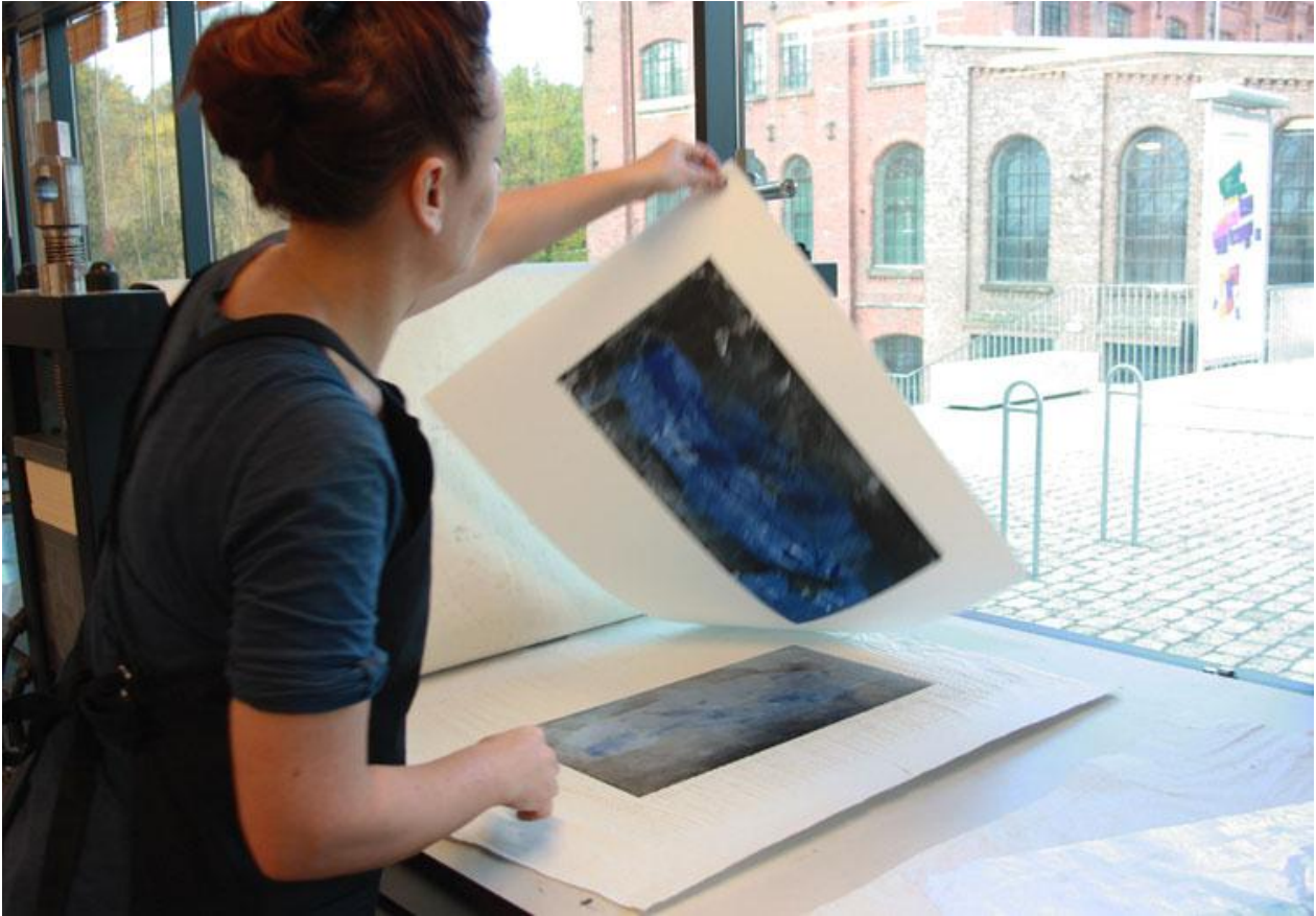
Arbeid i Grafikkverkstedet høsten 2013