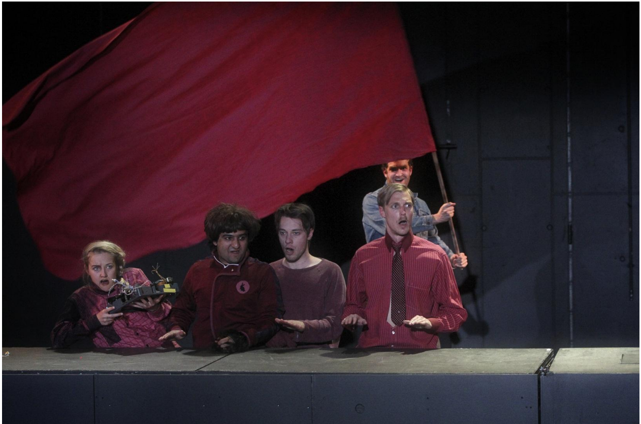
Påbyggingsår skuespill – avgangsforestilling vår 2012