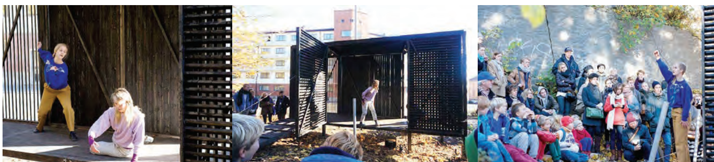
Bilder fra Transformer Pilotprosjekt 15. oktober 2012