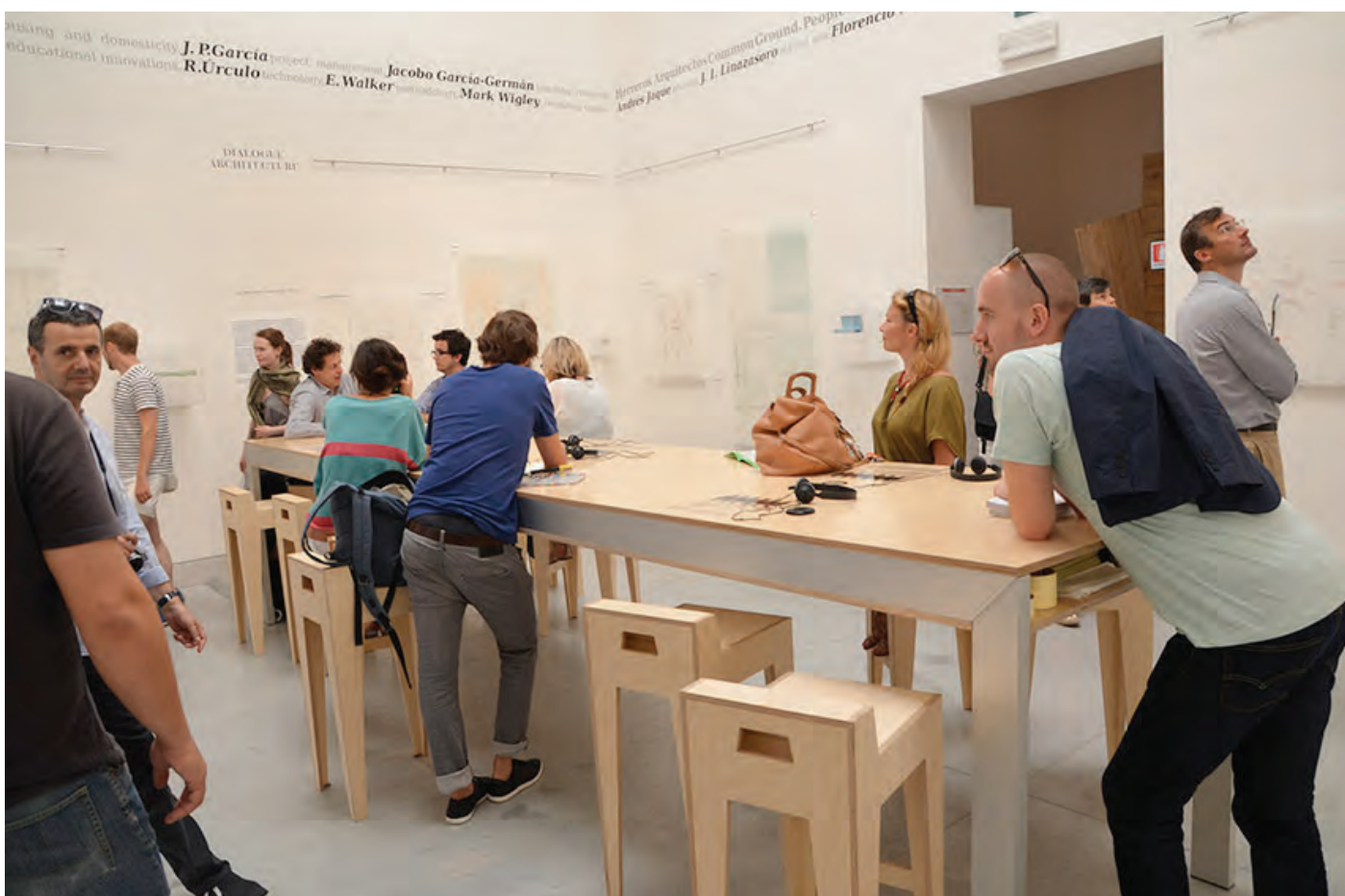
Bilder fra Arkitekturbiennalen i Venezia 2012