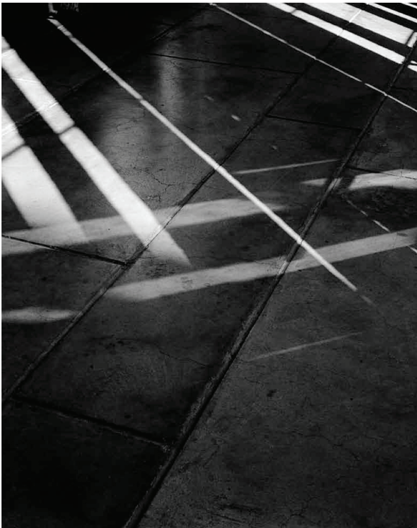
Fra Hélène Binet utstilling: Couvent Sainte-Marie de la Tourette by Le Corbusier, Eveux, France, 2007

- Utstillingen Lights Passing med arbeider av Hélène Binet 26.10 02.12 2012 "Hélène Binet ansees i dag som en av ledende arkitekturfotografer i verden. LIGHTS PASSING fokuserer på bilder fra Norge: Steilneset minnesmerke i Vardø av Peter Zumthor, Hamar museum av Sverre Fehn, og dykker ned i Binets personlige interesse i rommet og skyggen gjennom flere serier fotografier med verk av le Corbusier, Sol observatorien i Jaipur I India og Lunuganga Estate av Geoffrey Bawa i Sri Lanka. Utstilling består av 19 fotografier og ble produsert i London og Oslo. Utstillingen vil bli turnert til Paris og Praha.