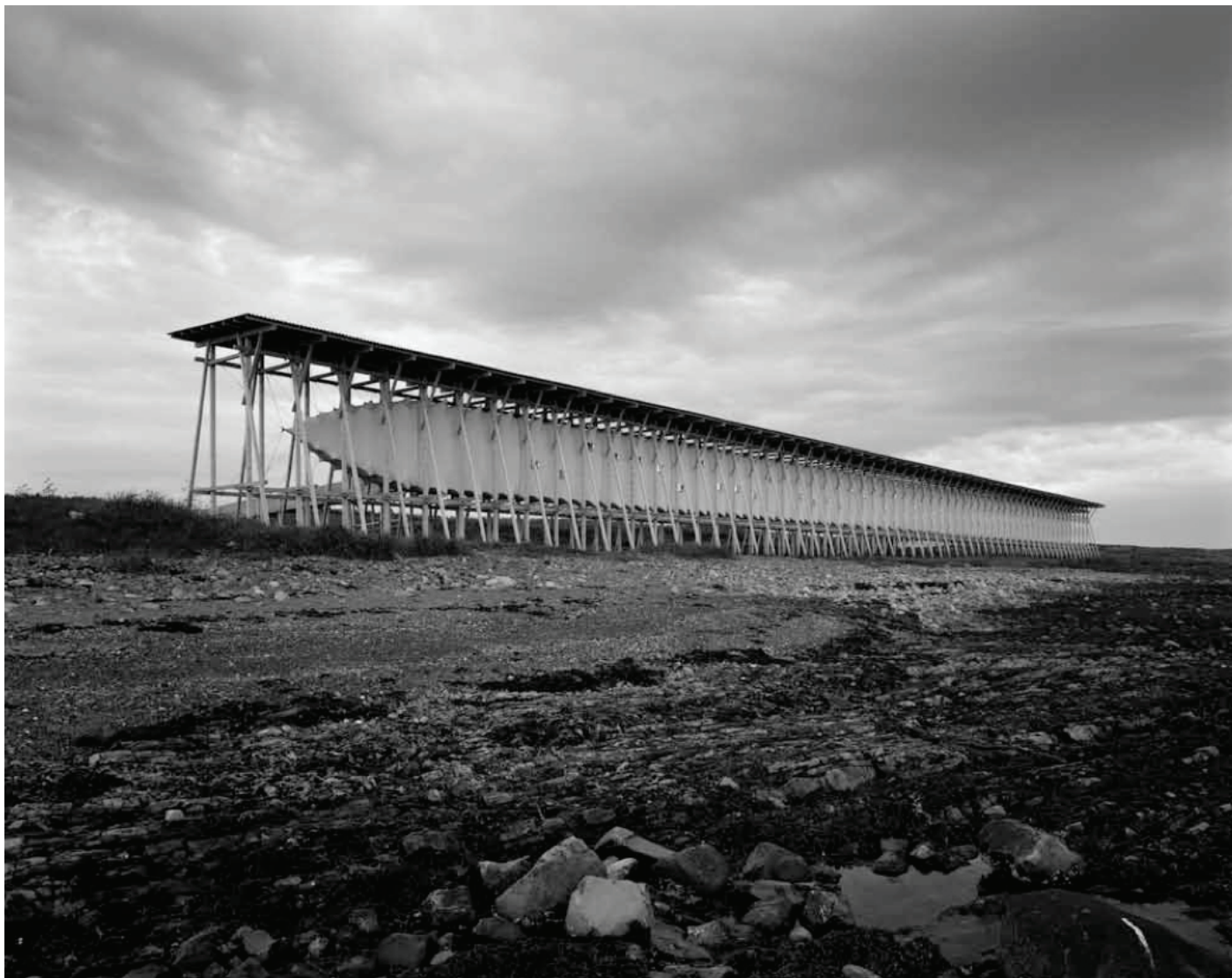
Fra Hélène Binet utstilling: Steilneset Witch Trial Memorial av Peter Zumthor, Vardø, Norway, 2011