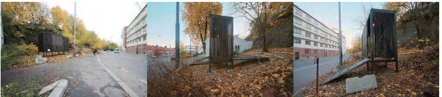
Bilder fra Transformer Pilotprosjekt 15. oktober 2012