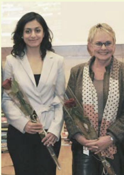
Kulturminister Hadia Tajik og nasjonalbibliotekar Vigdis Moe Skarstein ønsket velkommen til nye bokhylla.no da den åpnet 11. oktober.

I tråd med mandat og hovudmål har dei viktigaste satsingsområda i 2012 vore knytte til: