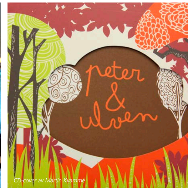
CD-cover av Martin Kvamme