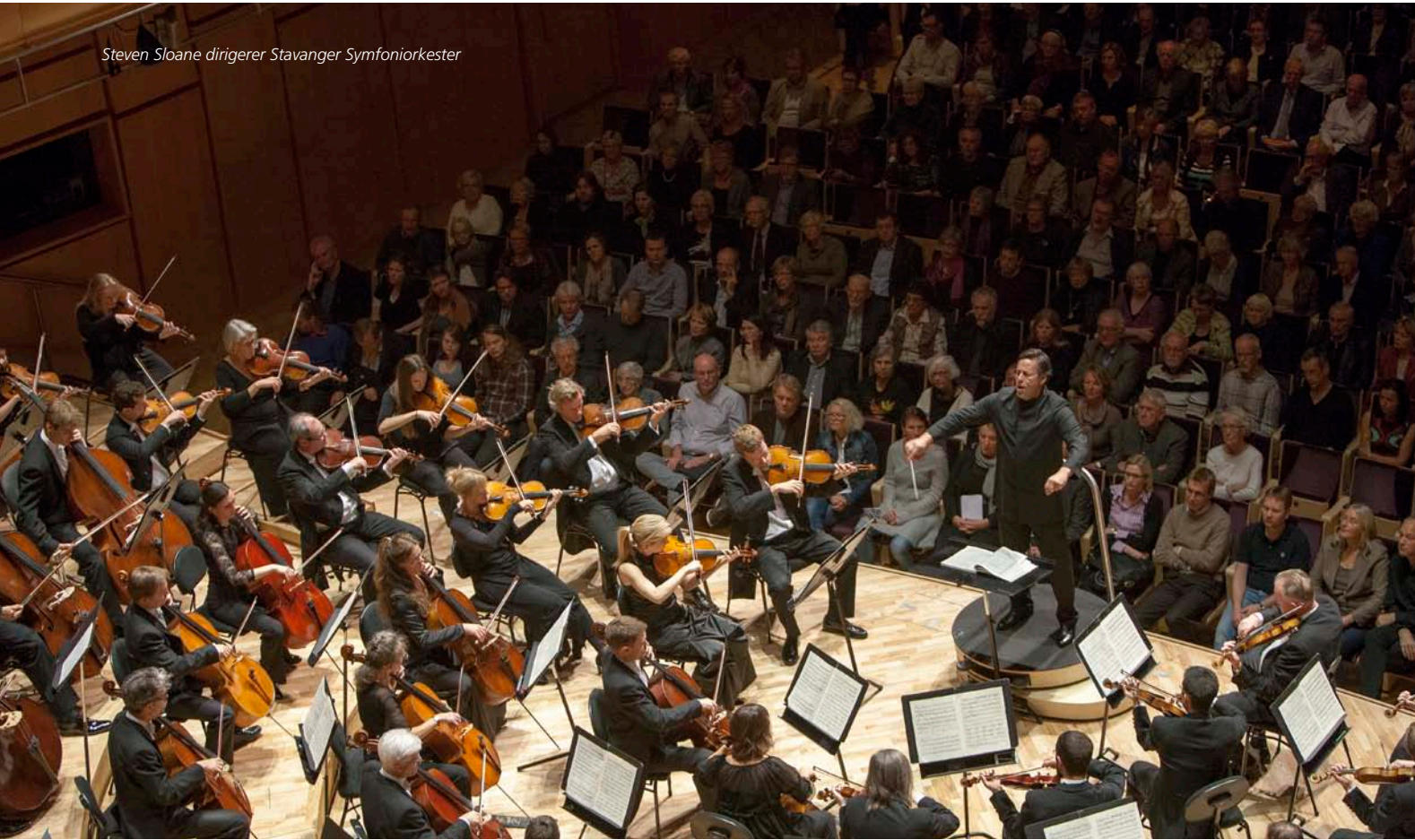
Steven Sloane dirigerer Stavanger Symfoniorkester

I tillegg til å opprettholde en normal konsertproduksjon første halvår i 2012, ble store ressurser satt inn på å sikre en mest mulig vellykket innflytting i det nye konserthuset. Før innflytting skulle akustikken testes i begge saler, med og uten publikum. Først etter testkonsertene kunne de siste innredningsmessige justeringer gjøres for å oppnå optimale klangforhold før den offisielle åpningen 15. september. Orkesterets bidrag til selve åpningsarrangementene var også omfattende og krevende for hele organisasjonen. Resultatet ble meget vellykket og orkesteret fikk umiddelbart en stor økning i publikumsbesøket. Orkesterets aktiviteter i det nye konserthuset har fått oppmerksomhet i media både lokalt, nasjonalt og internasjonalt. 2012 har utvilsomt vært et svært suksessrikt år for SSO.