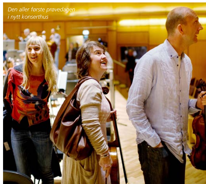
Den aller første prøvedagen i nytt konserthus