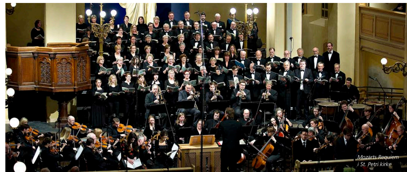
Mozarts Requiem i St. Petri kirke