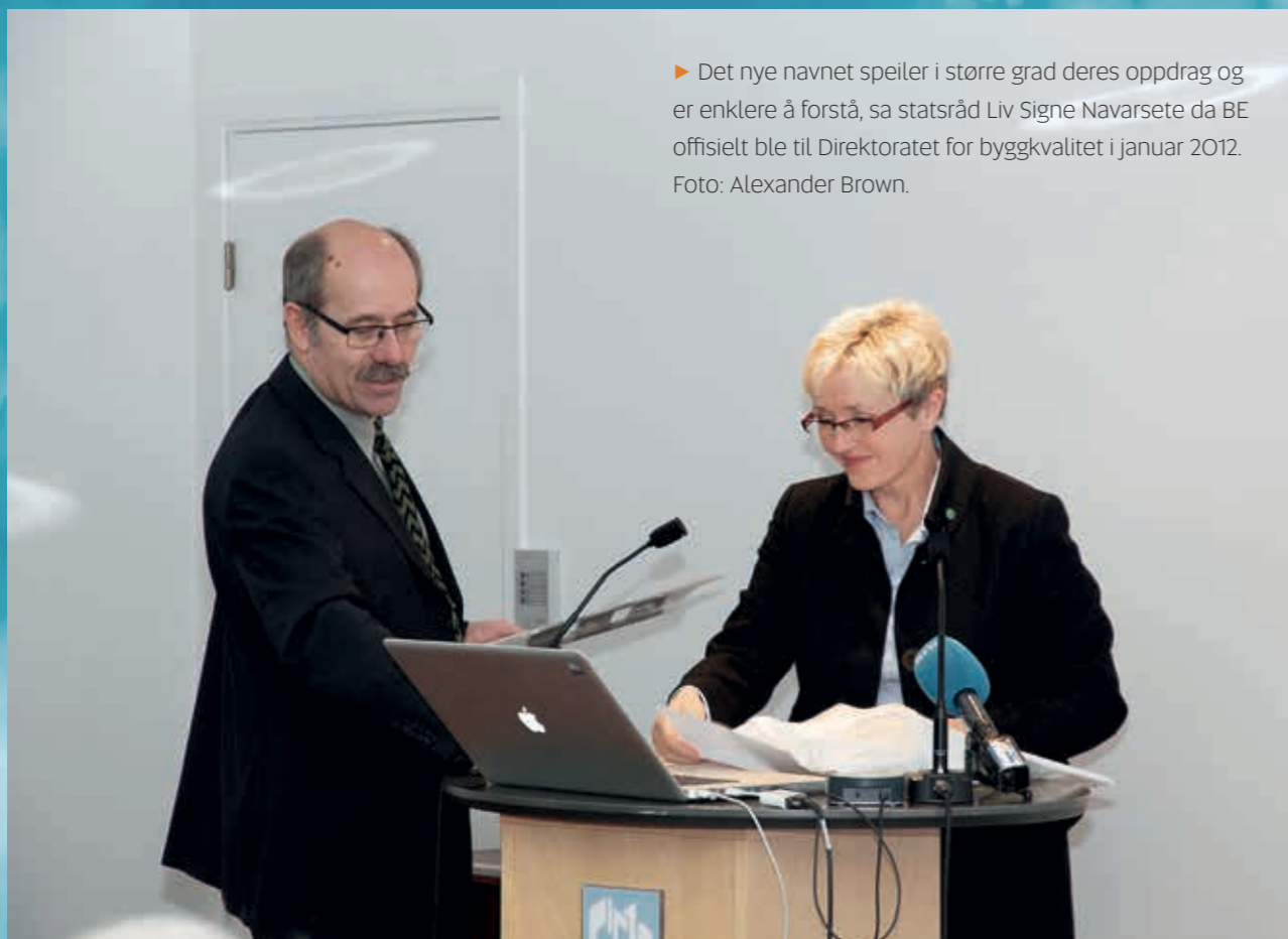
► Det nye navnet speiler i større grad deres oppdrag og er enklere å forstå, sa statsråd Liv Signe Navarsete da BE offisielt ble til Direktoratet for byggkvalitet i januar 2012.