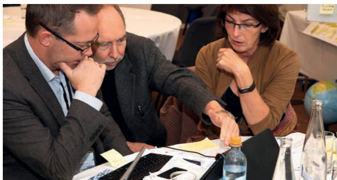
► Samarbeid og gode ideer på BYGG ENKELT ga konkrete innspill til forenkling av regelverket.

Samhandling basert på åpenhet og respekt for hverandres roller, gir resultater. Forenklingsverkstedet BYGG ENKELT er et eksempel på det. BYGG ENKELT ble arrangert med 60 deltakere i september, og ga konkrete innspill til forenkling av byggerregelverket fra kommuner, næring, departement og direktorat. Forslagene ligger til grunn for videre arbeid i Direktoratet for byggkvalitet. Statusoppdateringer presenteres på Bygg Reis Deg-messen i september 2013. ►