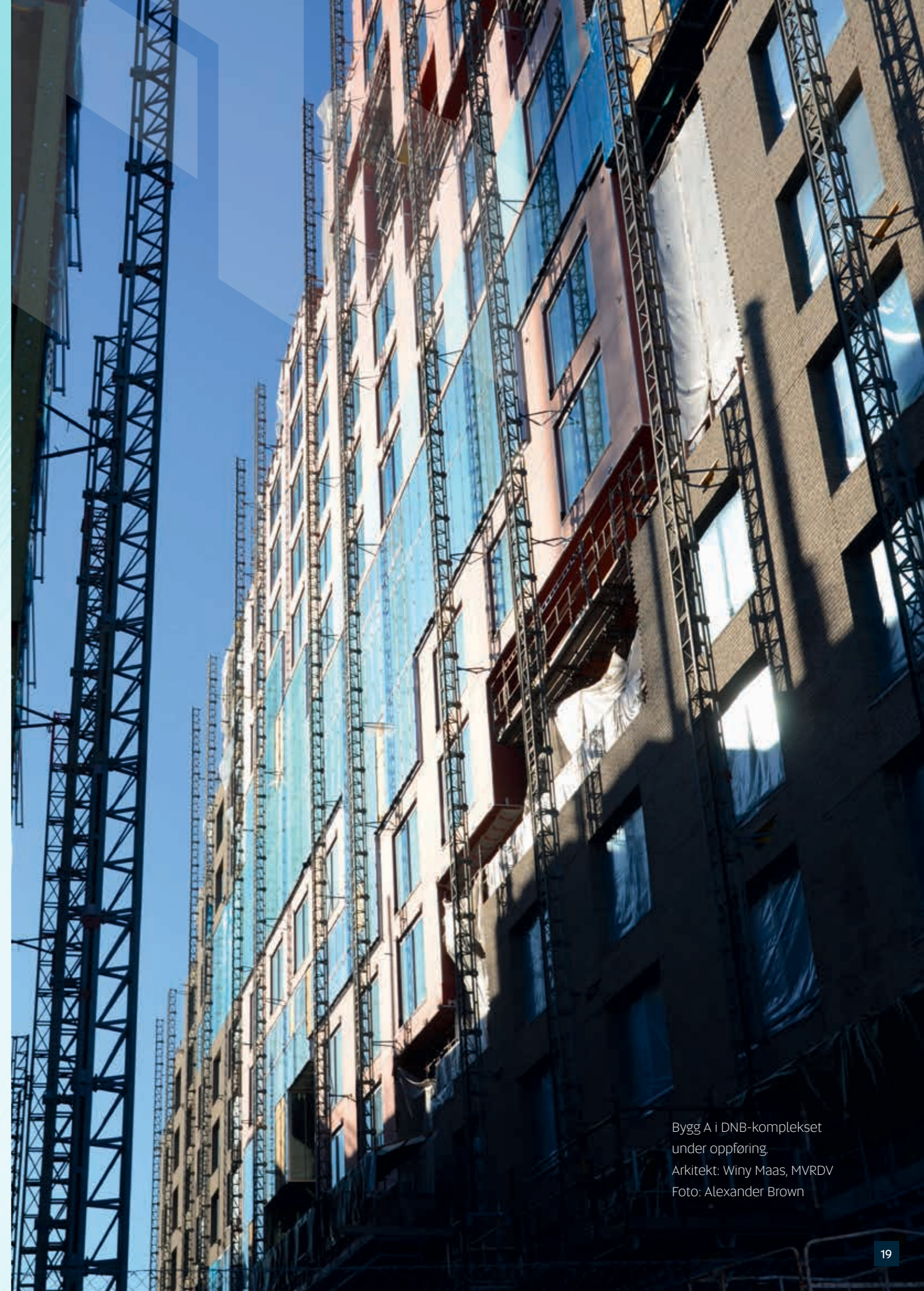
Bygg A i DNB-komplekset under oppføring. Arkitekt: Winy Maas, MVRDV