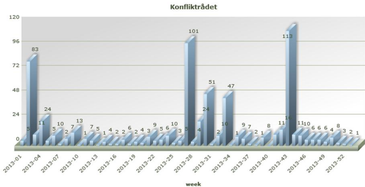
Fig. 1 Medieoppslag 2013