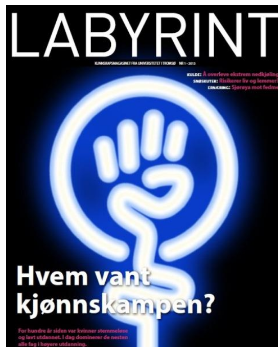
Labyrint – Gratismagasin om forskningen ved UiT - http://uit.no/nyheter/labyrint

UiT har ferdigstilt en strategi for samhandling med arbeidslivet. Strategien er forankret i Råd for samarbeid med arbeids- og næringslivet (RSA). UiT har en rekke samarbeidsflater med både offentlig og privat sektor som er integrert i instituttene og fakultetenes utdannings- og forskningsvirksomhet. Våre kontaktflater og