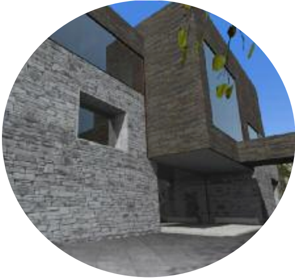
Nedre inngang, fra p-plassen, Kvarten

Museet og Statsbygg startet arbeidet med en presentasjonsbrosjyre som viser nybygget. Brosjyren skal foreligge tidlig 2014.