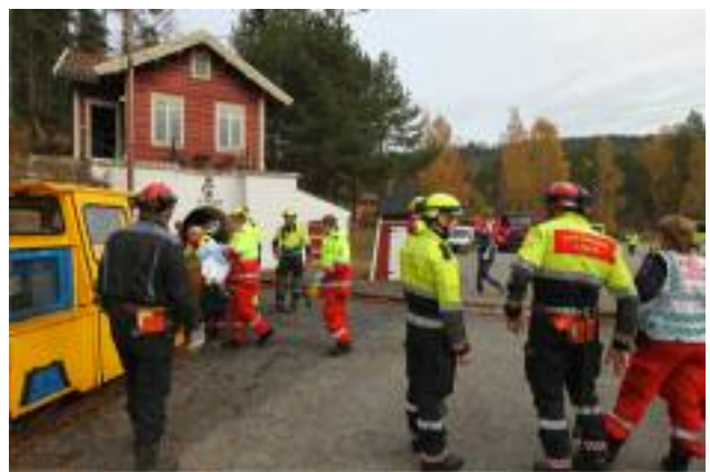
Fra beredskapsøvelsen i Saggrenda

I 2013 har museet ansatt 25 sommervikarer/helgevakter og deltidsansatte. Flere av disse har jobbet under arrangement i gruva i høst og vinter, samt hatt helgevakter på museet. I sommer jobbet 10 personer i gruva, 4 på aktivitetsplassen, 5 i sackerhus-butikken og 6 på museet i sentrum. Sykefraværet var på 3,6 %. Egenmeldt fravær er 0,6 %.