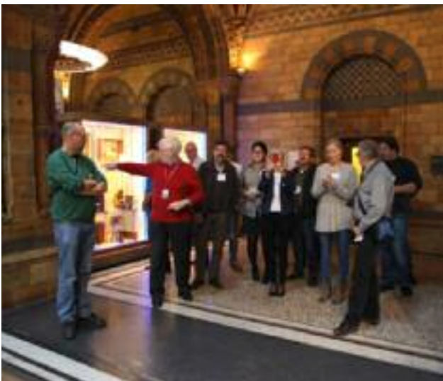
Studietur for alle ansatte, London

Digitalt HMS- system med avviksrapporing er implementert, det er blitt gjennomført opplæring og systemet har blitt tatt i bruk.