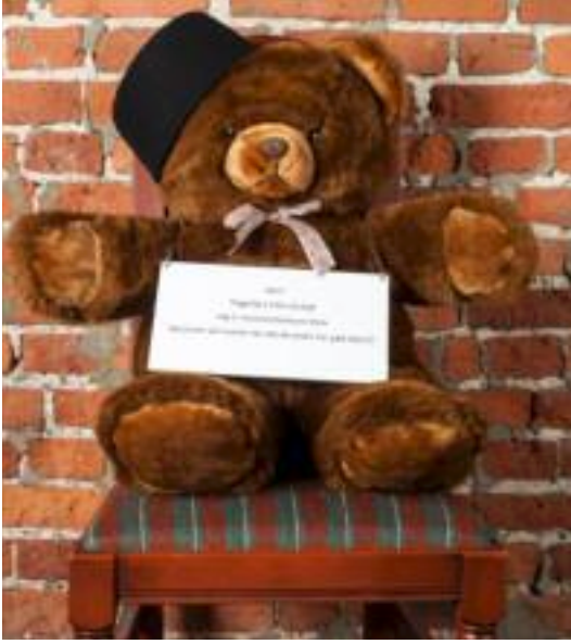
Barnas museum. Bamsen Stein