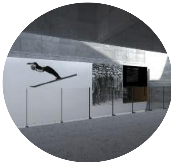
Vestibyle med utstillings skjerm, inngang fra Hyttegata