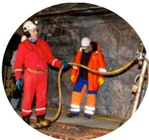
Kurs i bergsikring

Forprosjektet for nytt museumsbygg ble oversendt fra Statsbygg til Kulturdepartementet, som er oppdragsgiver, i desember 2013. Forprosjektet omfatter i tillegg til selve bygget, også utstillingsprosjekt og brukerstyr. Sikkerhet er et svært viktig aspekt ved prosjektet, og Norges Bank har vært sterkt involvert i premissgivingen rundt sikkerhet. I særlig grad er det utstillingsareal, tilførsels ganger, vare- og gjenstandsmottak og magasin som vil være omfattet av de strengeste sikkerhetskravene. Det ble bevilget kr. 7 mill. over Statsbudsjettet til ferdigstillelse av forprosjektet i 2013. Dersom første byggebevilgning bevilges over Statsbudsjettet i 2015, vil bygget kunne stå ferdig 2017/2018.