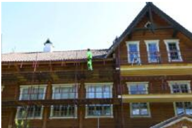
Maling av Vestre bergstue sommeren 2013

Fundament til fahrkunsten (heisen) i gruva har blitt renoverert og sto klar for bruk til sesongstart.