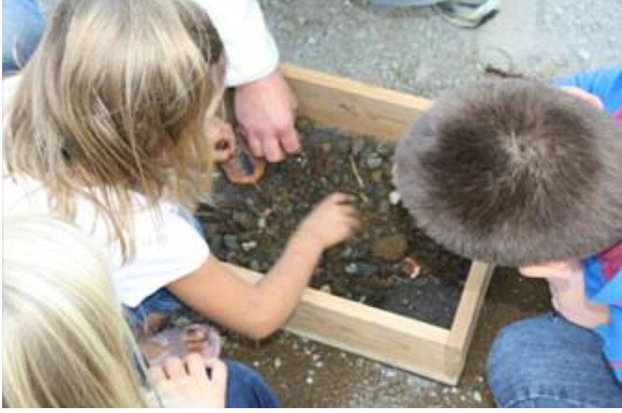
Møt en arkeolog.

fra Norsk Geologisk forening og granatjakt i regi av museet.