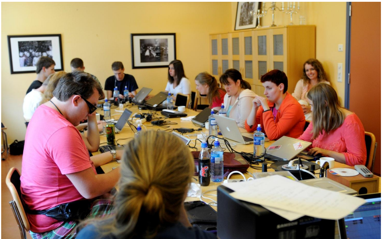
Skriveleir for ungdom med synshemming, sommaren 2013.

Sommaren 2013 arrangerte NLB for femte gong skriveleir for ungdom i alderen 16 til 25 år med synshemming. Skriveglade ungdommar fekk møte profesjonelle forfattarar og skape sine egne tekstar. I alt 15 ungdommar i alderen 18 til 25 år deltok på skriveleiren, som varte ei veke og var lagd til lokale hos Statped Sørøst.