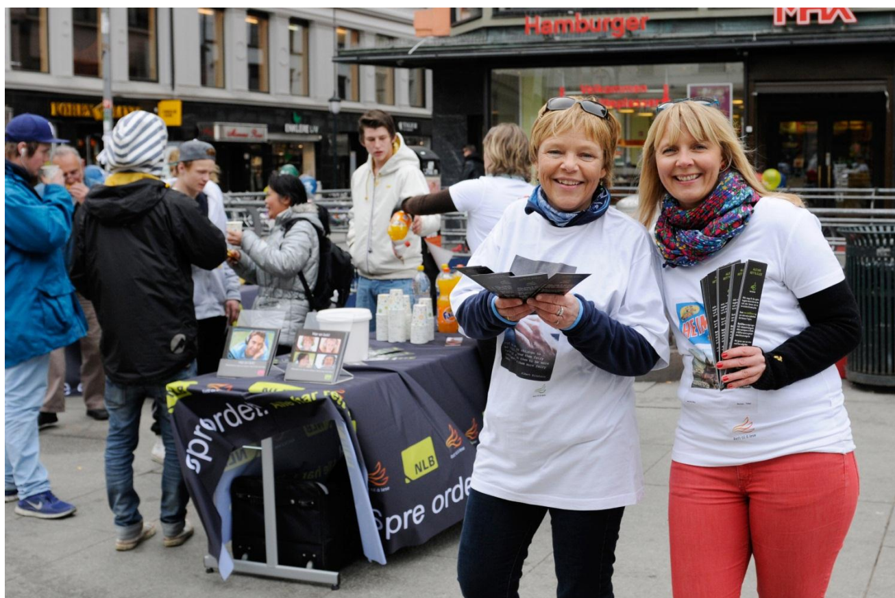
NLB-tilsette på stand under lanseringa av Rett til å lese-aksjonen, 24. april 2013.