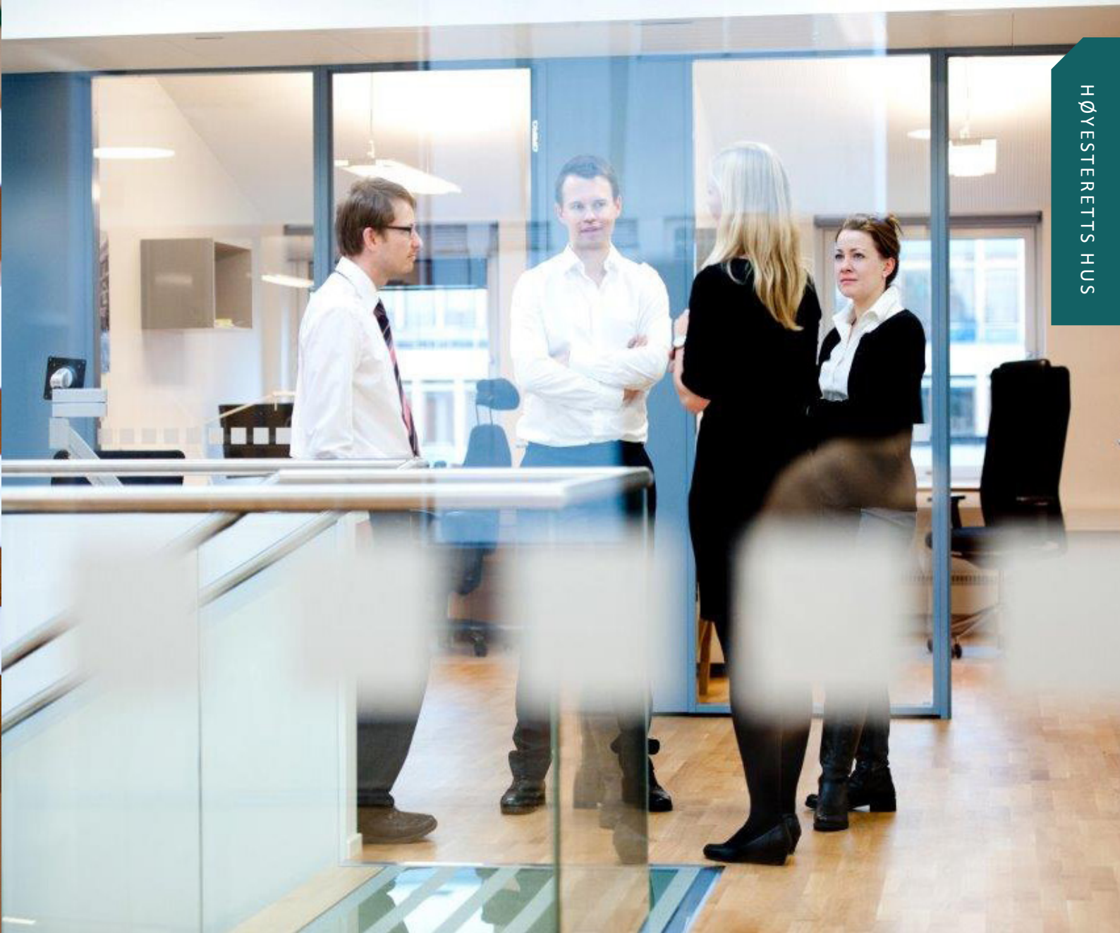
Utredningsenheten går igjennom mer enn 2000 saker i året

I dag har Høyesterett 20 juridiske utredere som forbereder ankesakene for Høyesteretts ankeutvalg, og våren 2014 var gleden stor da seks nye kontorplasser ble innviet i en ny etasje på "Loftet". De strengere formene nedover i etasjene i Høyesteretts Hus, er her løst opp.