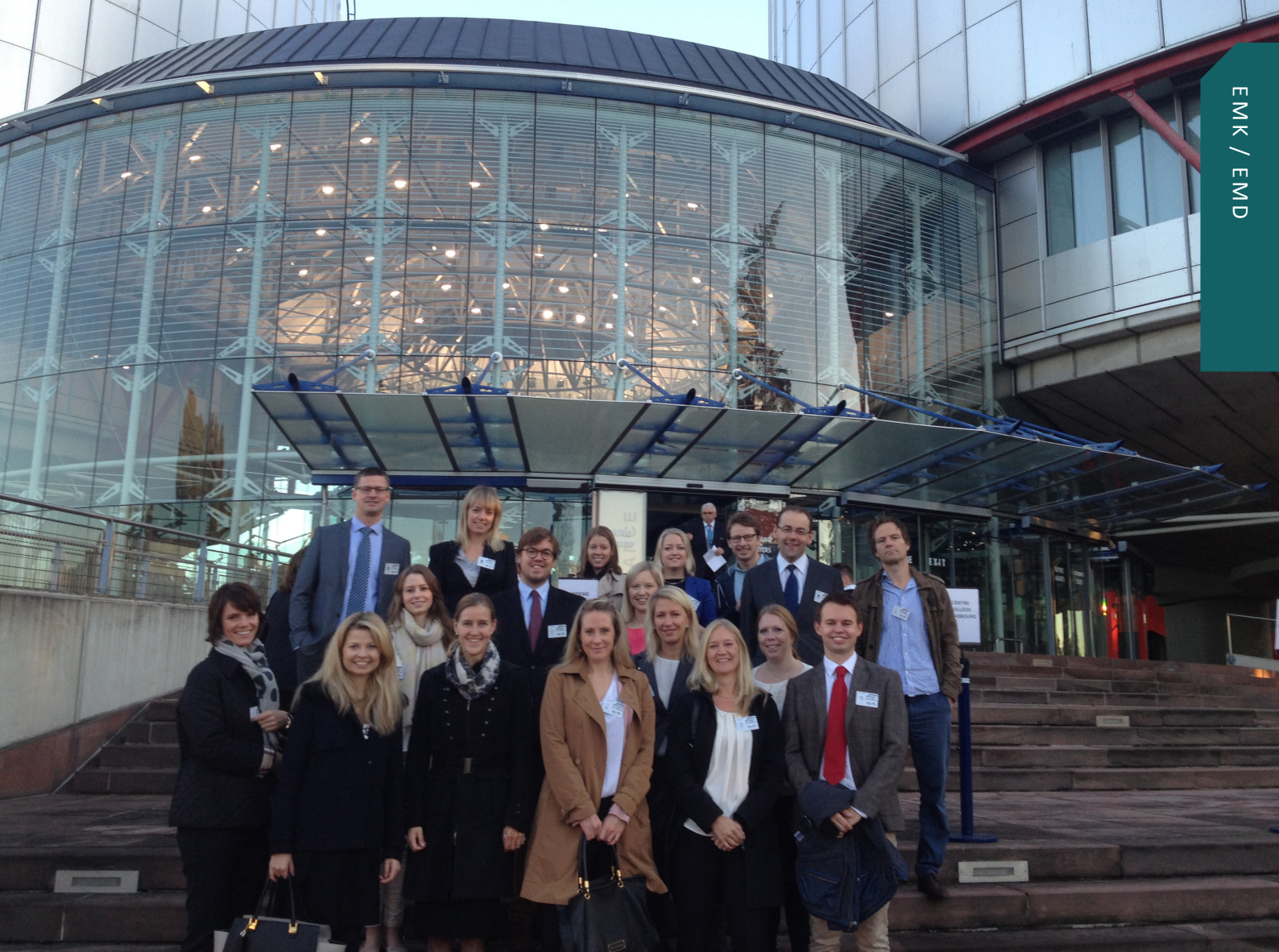
Utredere i Høyesterett på studietur til Den Europeiske Menneskerettighetsdomstol, oktober 2014.