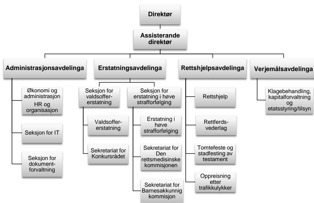
Figur 2.1 Organisasjonskart

Sentrale volumtal for verksemda kjem fram i tabellen under.