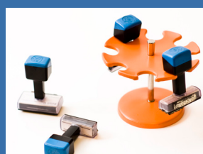
Sertifisering og verifisering