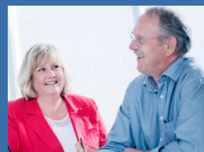
Rådgivning og konsulenttjenester