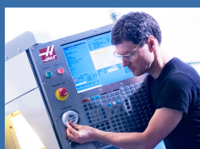
Produktutvikling og innovasjon