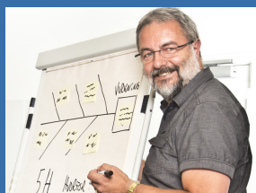
Kurs og videreutdanning