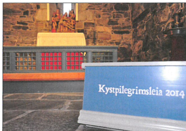
Frå St. Jøtun kyrkje. Markering av kystpilegrimsleia.