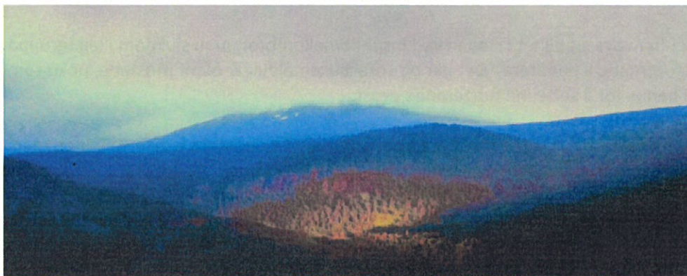
Landskap i Todalen på Nordmøre.