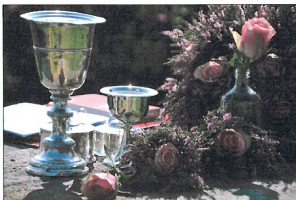
Frå gudsteneste i Herøy – markering av kystpilegrimsleia.