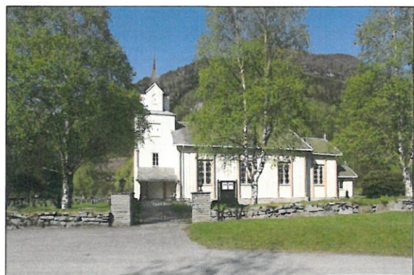
Todalen kyrkje.