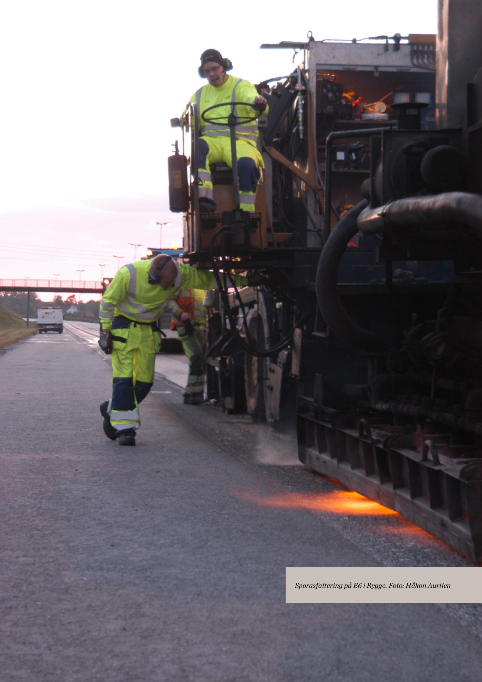
Sporasfaltering på E6 i Rygge.