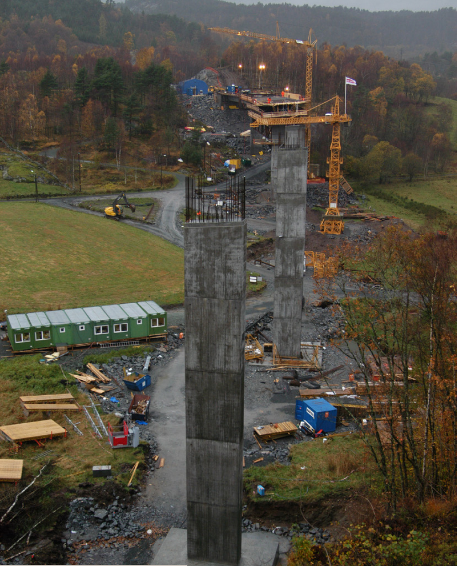
E39. Birkeland bru. Vest Agder.