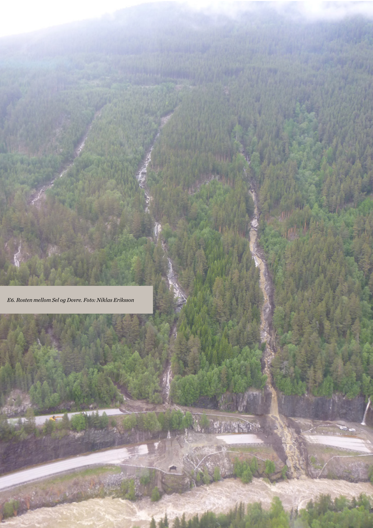
E6. Rosten mellom Sel og Dovre.