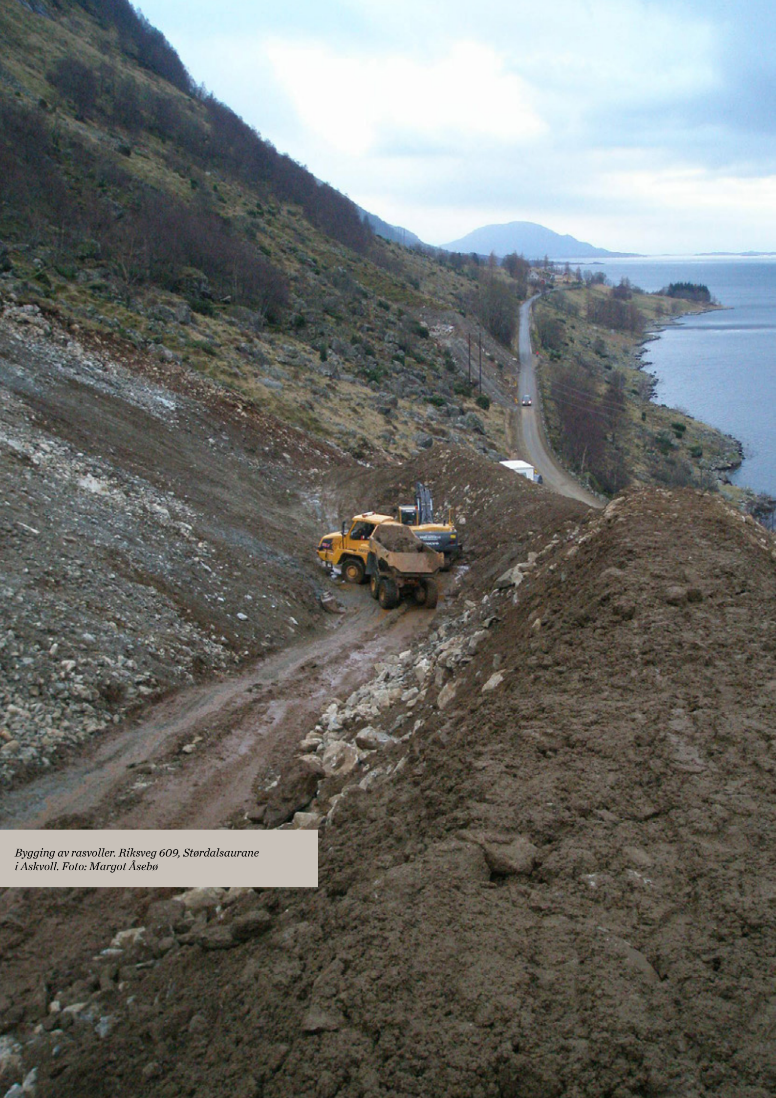
Bygging av rasvoller. Riksveg 609, Stordalsaurane i Askvoll.