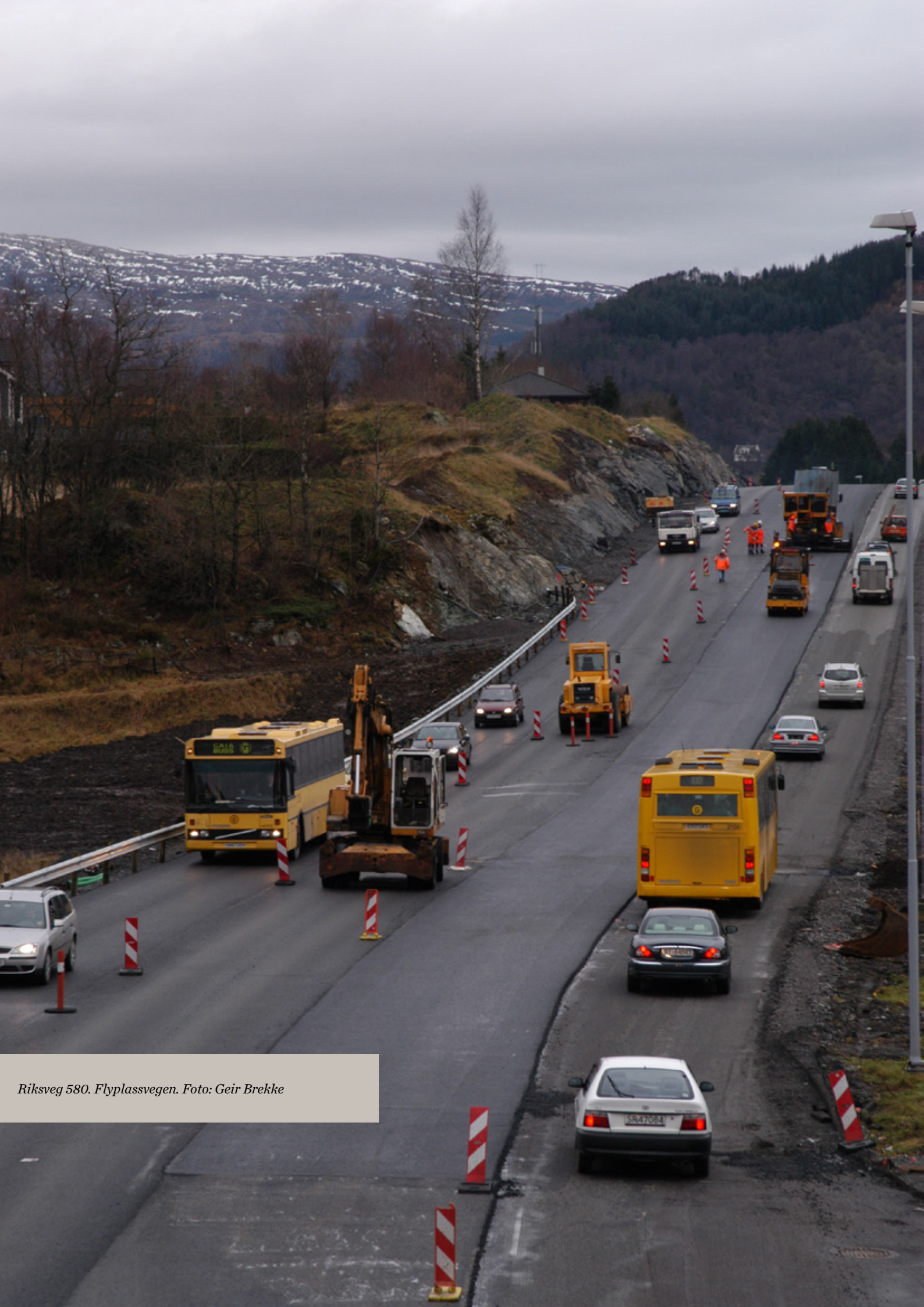
Riksveg 580. Flylassvegen.