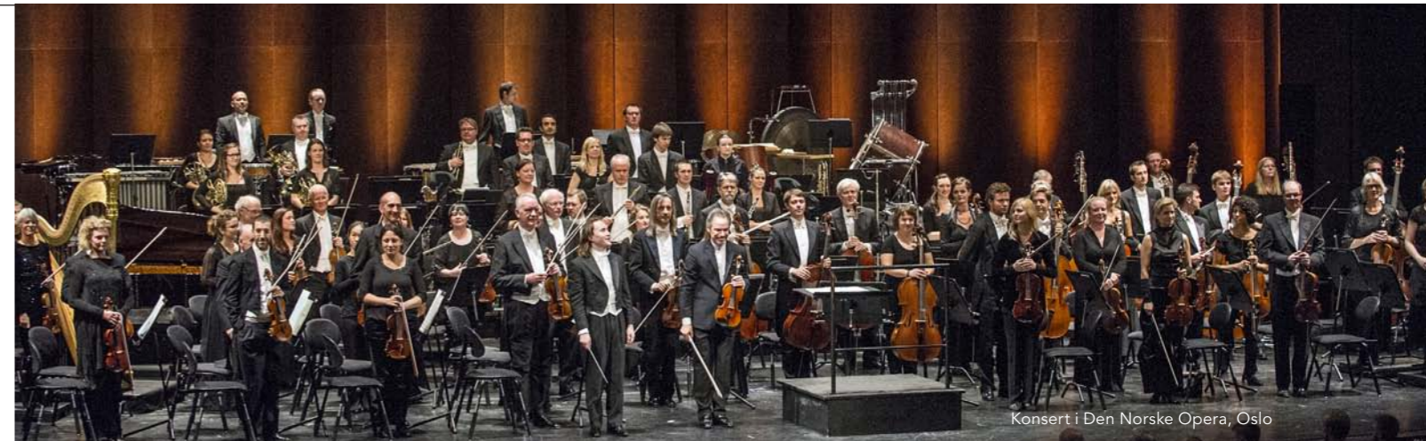
Konsert i Den Norske Opera, Oslo

Etter et jubileumsår med rekordtall på besøk og abonnenter i 2013, var utfordringen stor foran 2014. Men interessen for orkesterets konserter har holdt seg godt og vi kan til og med registrere en liten økning i totalt antall publikum og i abonnentstall. For første gang i orkesterets historie er det registrert over 1800 abonnenter, fordelt omtrent likt på de to konsertseriene.