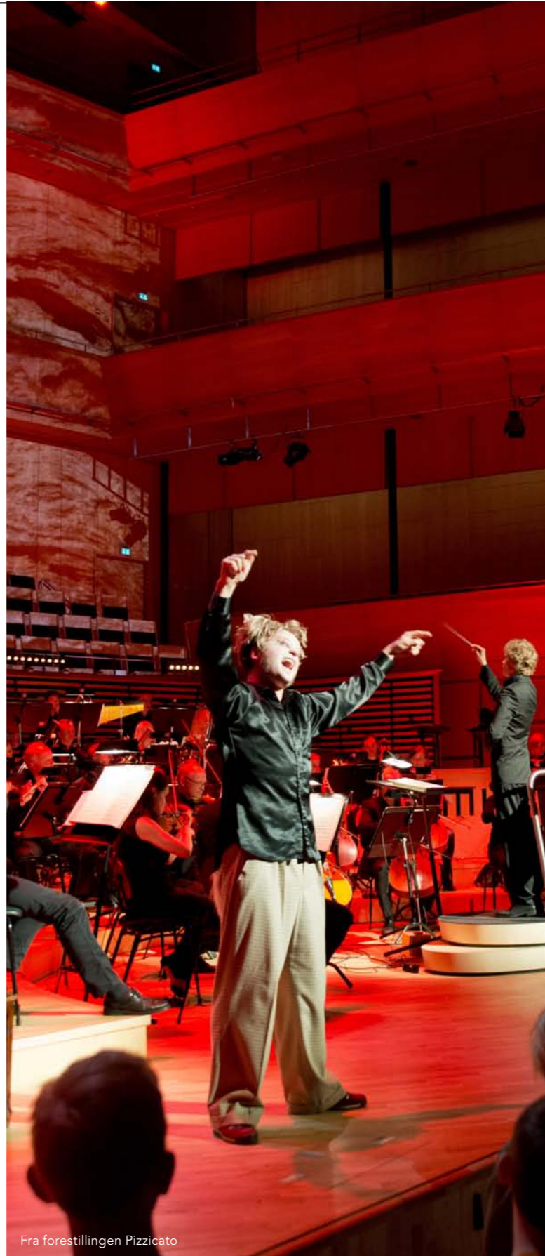
Fra forestillingen Pizzicato