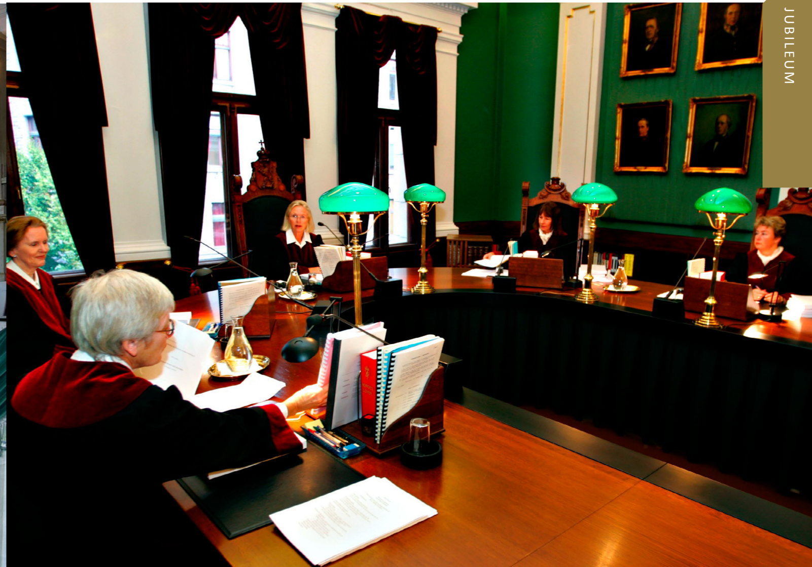
I 2004 ble en sak i Høyesterett for første gang gjennomført med bare kvinnelige dommere.