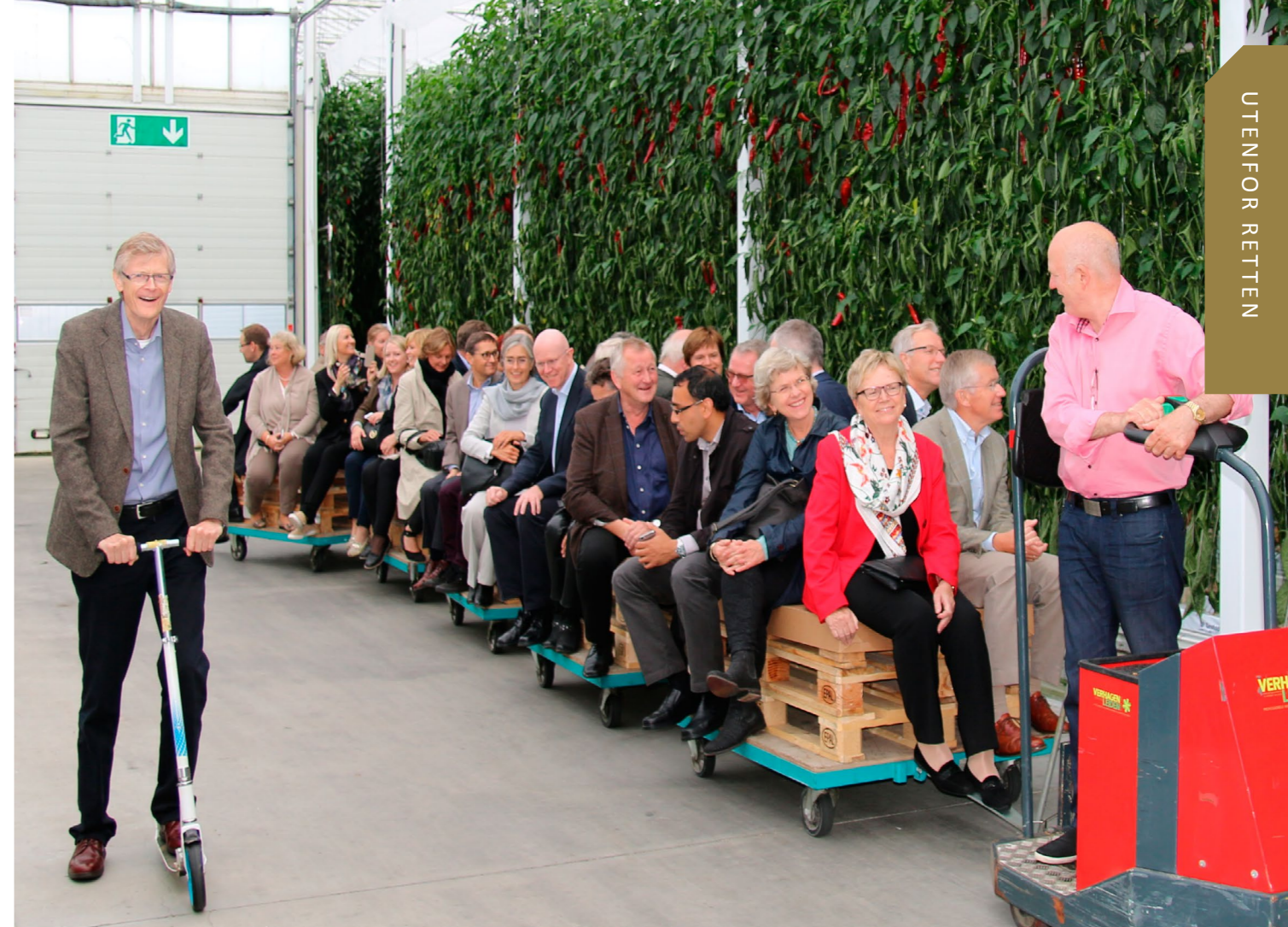
Det var god stemning under omvisningen på Miljøgartneriet i Kviamarka.