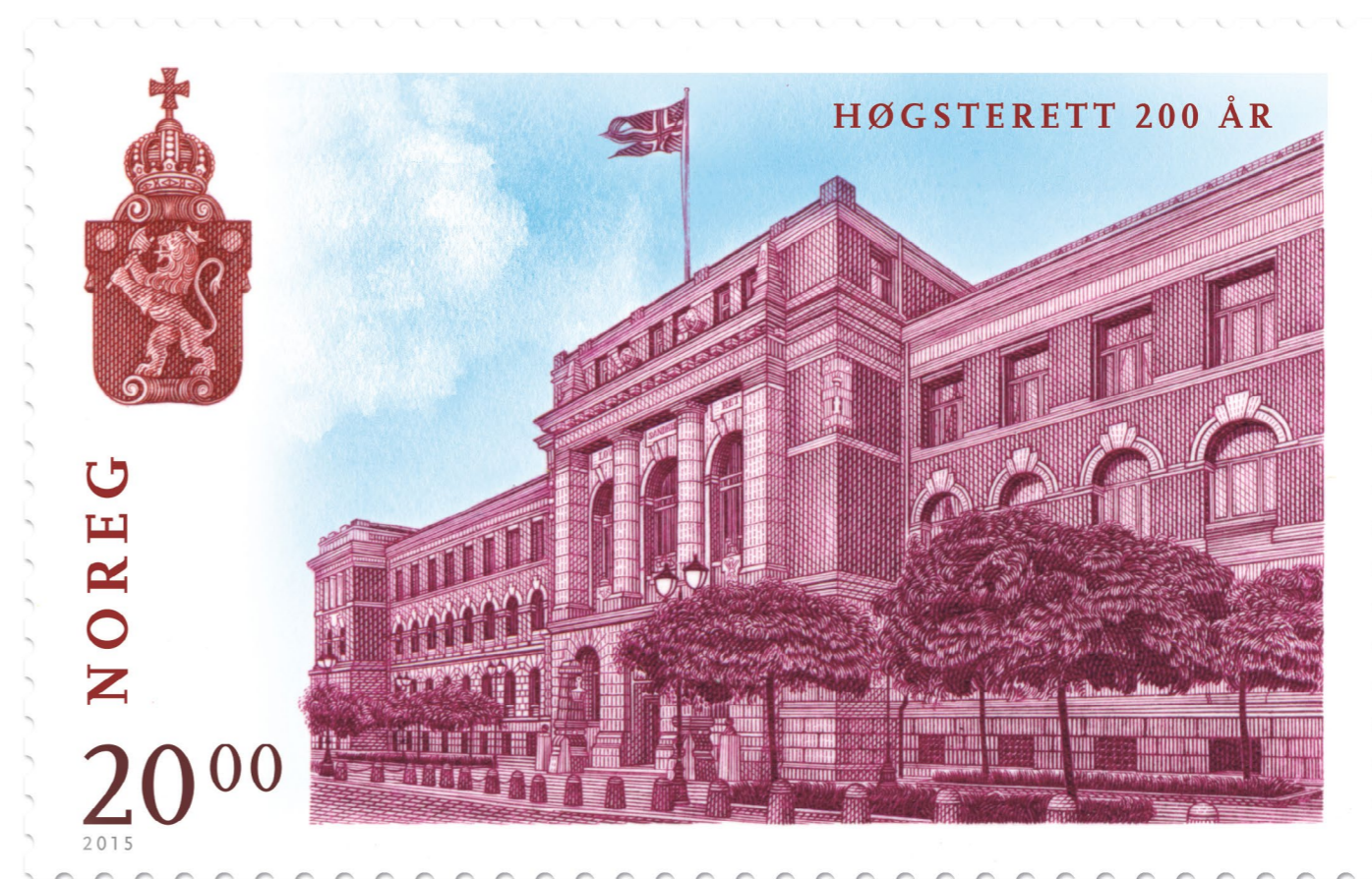
Gjengitt med tillatelse fra Posten.