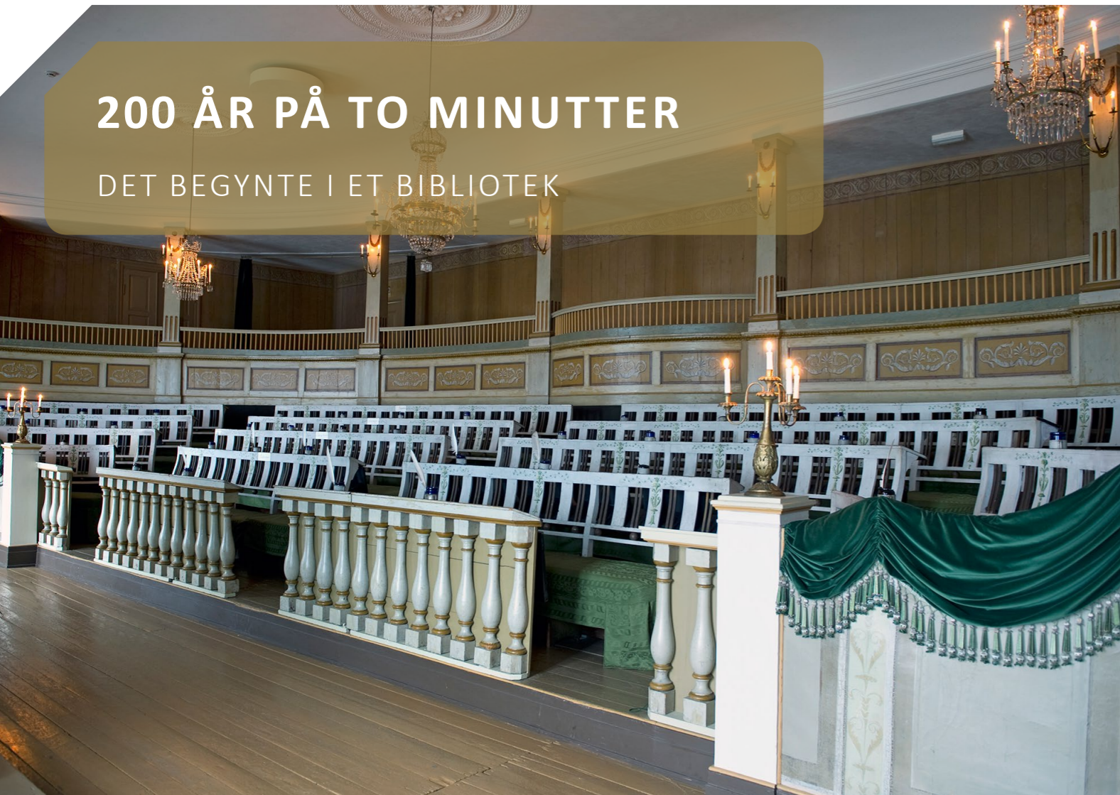
Høyesterett holdt hus i Katedralskolens bibliotek i 1815. I dag er biblioteket å finne på Norsk Folkemuseum.