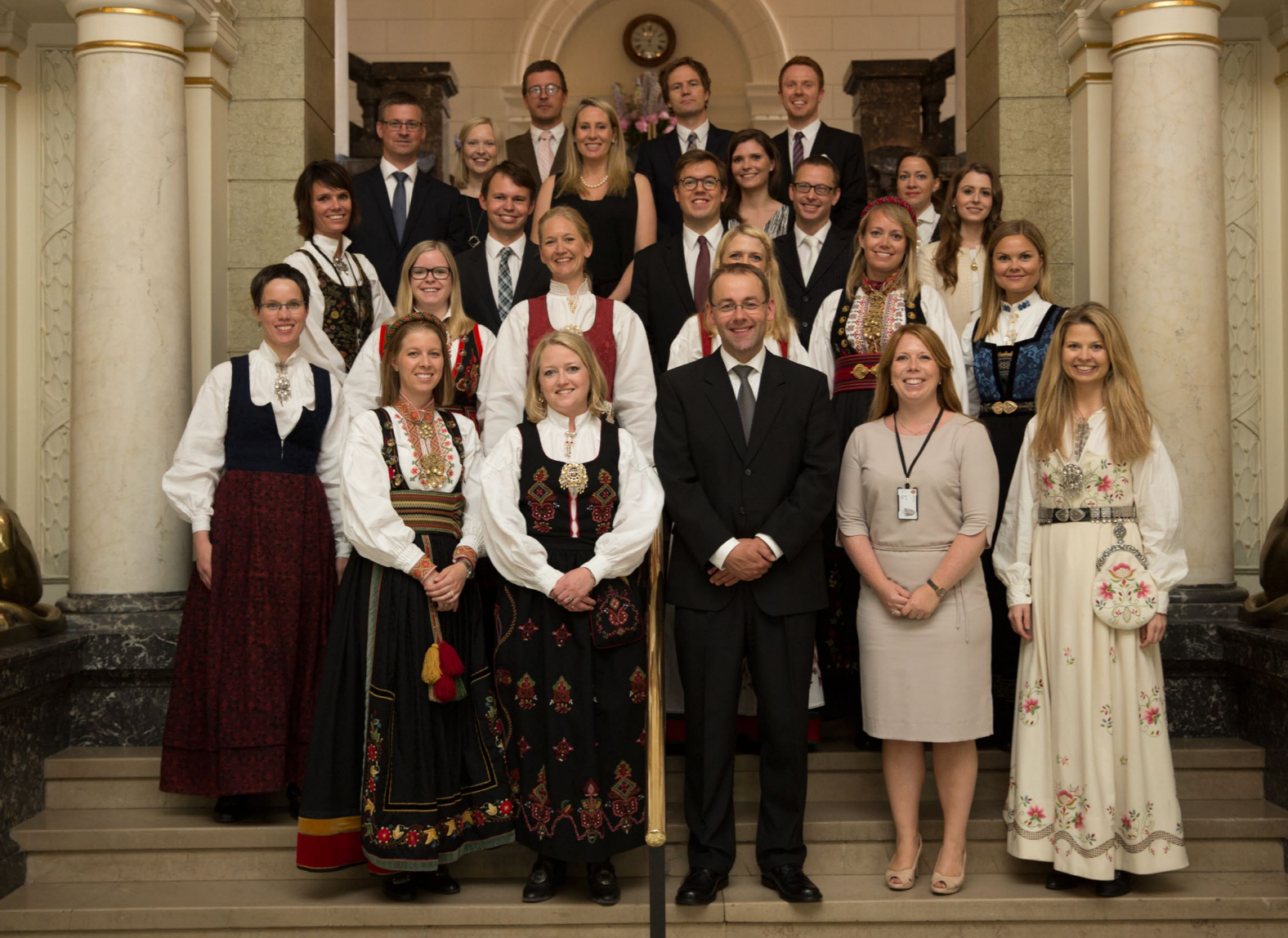
Utredene i Høyesterett fotografert under jubileumsfeiringen 30. juni 2015.