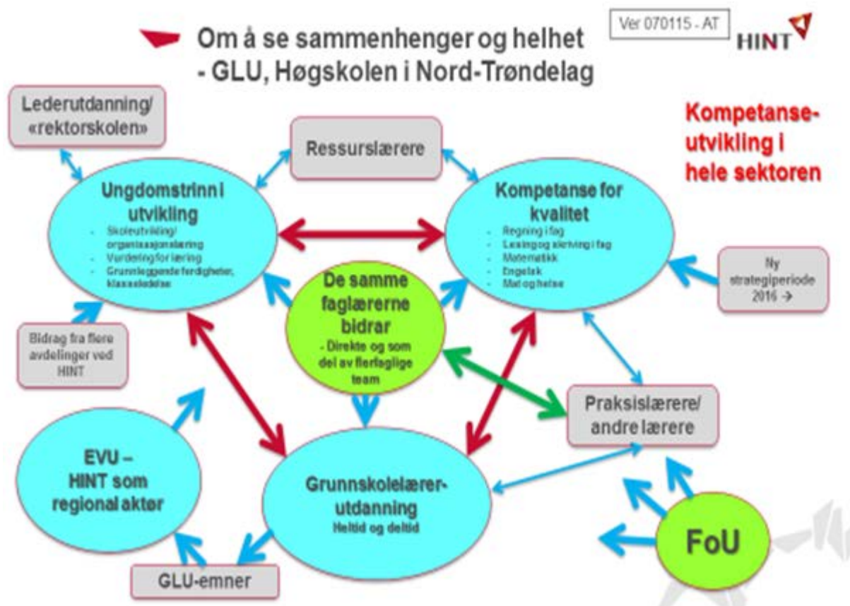
Figur 1: Aktiviteter GLU, HiNT

Studentaktiv forskning jobbes det også med på flere nivå. Vi har fortsatt arbeidet med å skape felles forståelse og en tydeligere definisjon av begrepet.