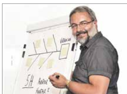
Kurs og opplæring