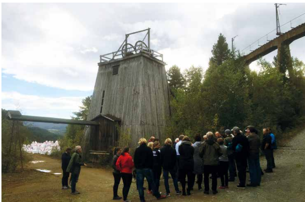
Foran sjakttårnet ved Gammelgruvesjakt, Løkken verk. Bak til høyre sees malmjernbanens «Viadukten».

Tinn/Rjukan og Notodden ble oppført på Unescos verdensarvliste i 2015. Med betydelig økt interesse i et nasjonalt og internasjonalt marked for regionen, ser museet positive synergier for Kongsberg og for museet. Den geo-