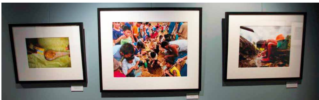
fra utstillingen Gulletts mørke side – barnarbeid i gruveindustrien i dag.