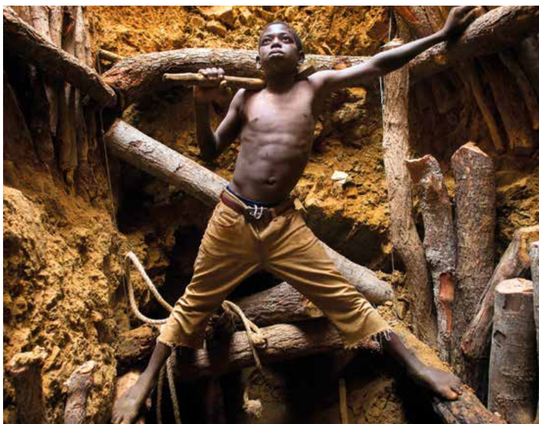
Fra utstillingen Gulletts mørke side – barnarbeid i gruveindustrien i dag.

Til utstillingen ble det utviklet et eget pedagogiske opplegg for 8.-10.trinn hvor elevene skulle lage en nyhetsreportasje hvor de selv spilte og intervjuet hverandre i rollene som henholdsvis barnarbeider, journalist, gruveeier, geolog og fotograf. Intervjuet ble filmet med