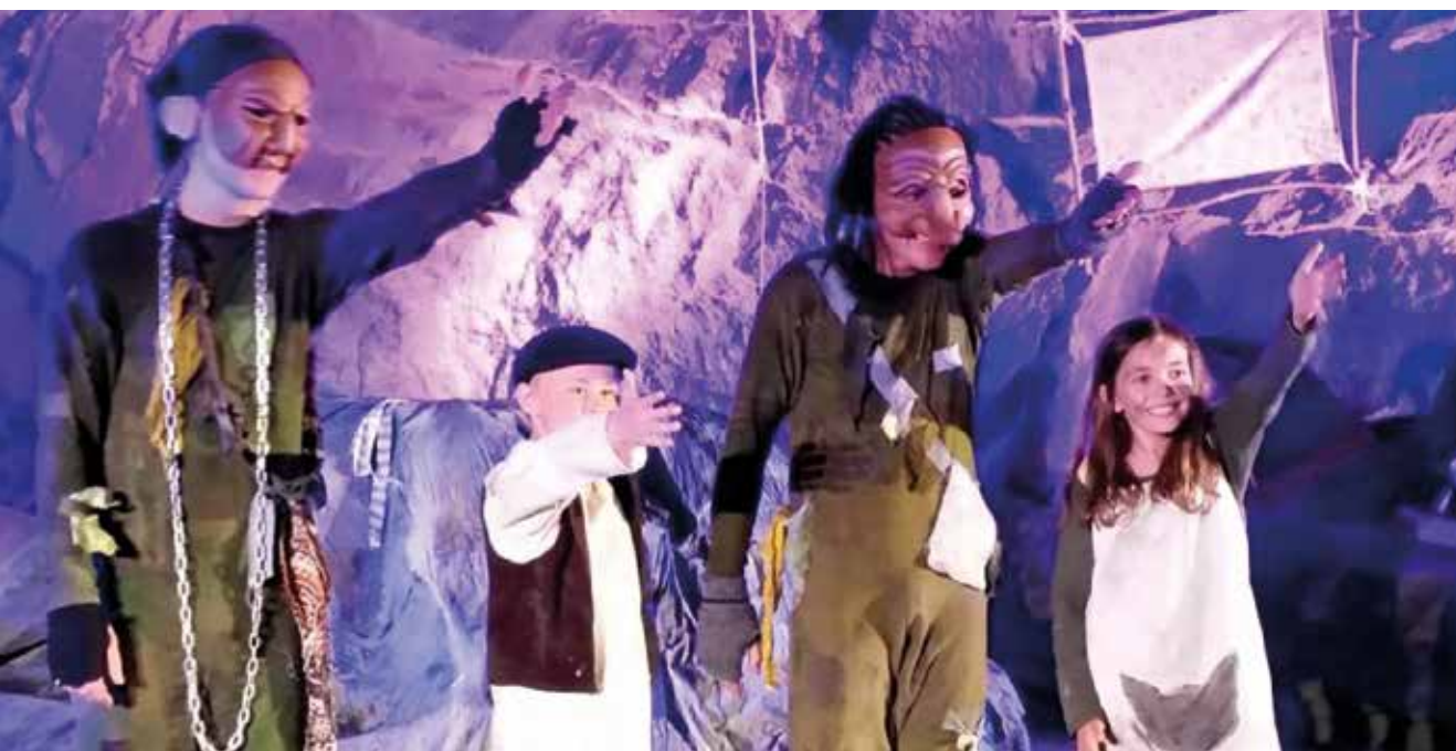
Fra forestillingen Hulenes hemmelighet.

Museet fikk god medieomtale i 2015. Sølvgruvene var et av opptaksstedene i TV-serien « Lenket » på NRK høsten 2015. Programmet ble spilt inn i april. Også Laagendalsposten har gitt museet mange og store oppslag. Det ble annonsert ukentlig i sommerhalvåret i to riksaviser. Travel Channel sendte våren 2015 en ny serie som het « Expedition Unknown », i episode