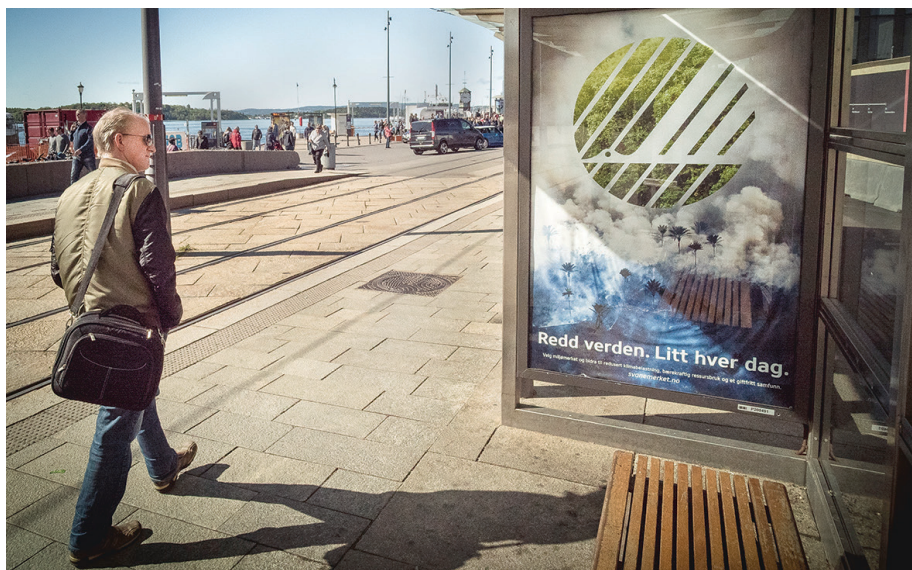
Miljømerking gjennomførte en kampanje i 2015 med slagordet "Redd verden. Litt hver dag".

Sykefraværet i 2015 var 3,8 prosent. Langtidsfraværet (over åtte uker) utgjorde 1,5 prosent og korttidsfraværet 2,3 prosent. Sykefraværet har gått opp sammenlignet med 2014 da sykefraværet var 2,1 prosent, langtidsfraværet 0,7 prosent og korttidsfraværet 1,4 prosent. I 2013 var sykefraværet 5,7 prosent, langtidsfraværet 3,2 prosent og korttidsfraværet 2,5 prosent. Sykemeldte personer er fulgt opp i tråd med IA-avtalen.