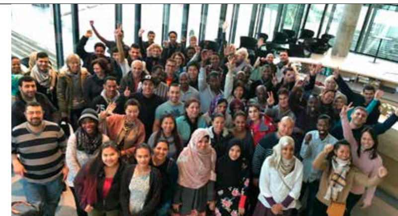
Godt samarbeid med Johannes Læringscenter