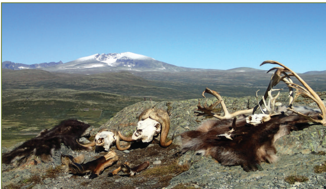
Naturveiledningseffekter ved viewpoint SNØHETTA.

Året ble avsluttet med en forespørsel fra Al Jazeera om Norsk villreinsenter kunne bidra til et innslag om villrein og klimaendringer. En av naturveilederne ble intervjuet, og sammen med villreinbilder og -film ble resultatet et innslag på nærmere 2 minutter, som ble sendt i nyhetssendingen til Al Jazeera på sosiale medier. Nedslagsfeltet for dette er noe større enn naturveilederne vanligvis forholder seg til; rundt 160 000 har sett filmklippet og intervjuet.