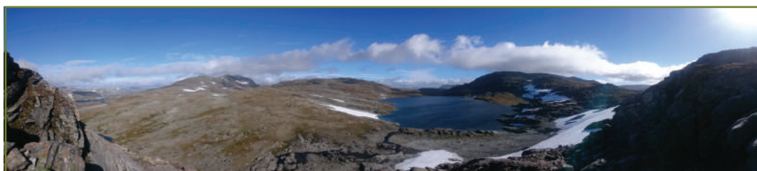
Høyalpint fjellandskap i Nordfjella villreinområde.

Oppfølgingen av de regionale planene for villreinfjella er viktig, og Norsk villreinsenter har deltatt med innlegg på de årlige samlinger for de regionale planene for Setesdal, Hardangervidda og Nordfjella.