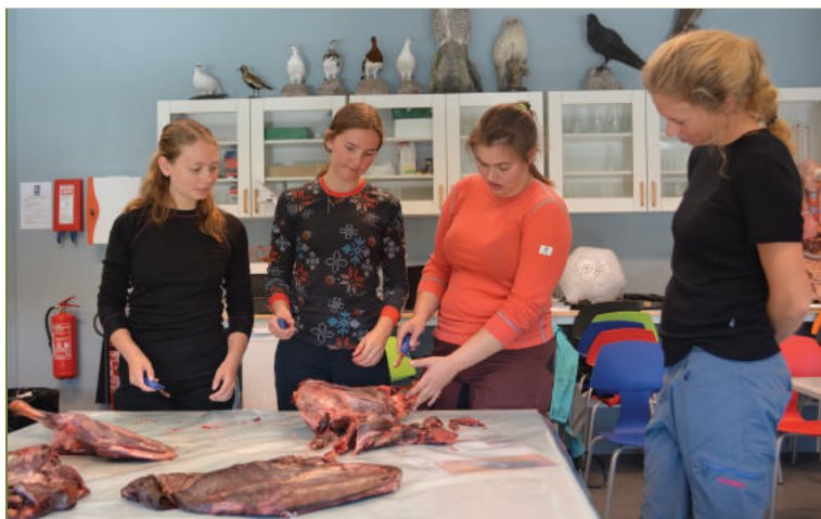
Elever ved landslinja får opplæring i slakting av rein.

Høsten 2016 tok Norsk villreinsenter Sør imot det andre kullet ved landslinja i natur- og miljøfag ved Rjukan Videregående skole, og både første og andre klasse har hatt undervisning på Skinnarbu. Satsingen er et samarbeid mellom Norsk villreinsenter Sør, Høgskolen i Telemark, Rjukan Videregående skole og Hardangerviddasenteret AS. Norsk villreinsenter Sør har ansvaret for ti undervisningsdager med temaene villrein og høyfjellsøkologi. Telemark fylkeskommune gir økonomiske bidrag til gjennomføringen av denne undervisningen.