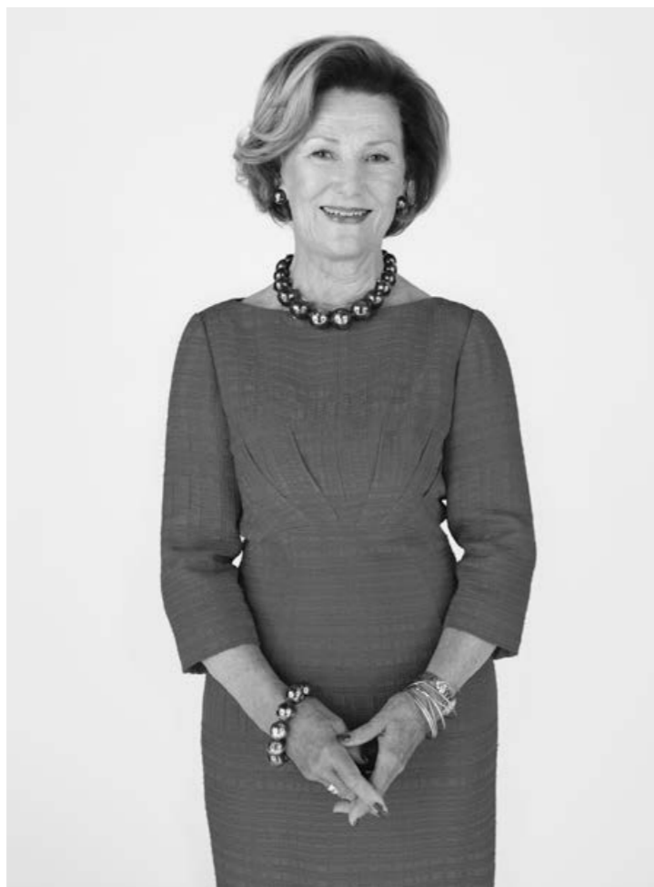
H.M. Dronning Sonja

Den Norske Opera & Balletts høye beskytter