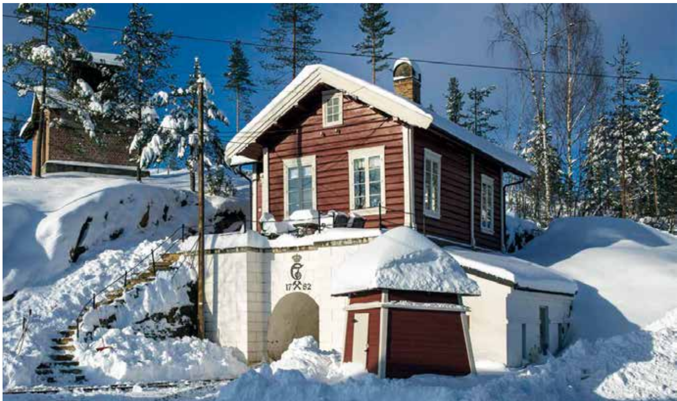
Vinter i Saggrenda. Nattstigerhuset og inngang til Chr. 7-stoll.

Flere av museets ansatte har holdt en rekke foredrag, spesialomvisninger, mindre presentasjoner på og utenfor museet. Museets ansatte har ellers deltatt på relevante kurs og konferanser, i hovedsak innenlands, og har bidratt med skriftlige arbeider til tidsskrift, årbøker, aviser og lignende.