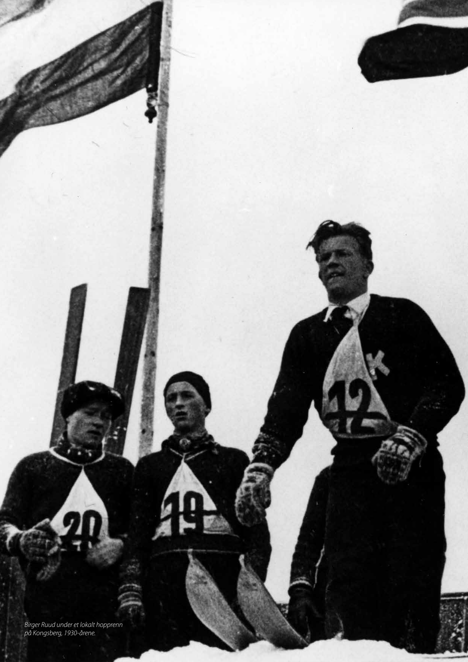
Birger Ruud under et lokalt hopprenn på Kongsberg, 1930-årene.