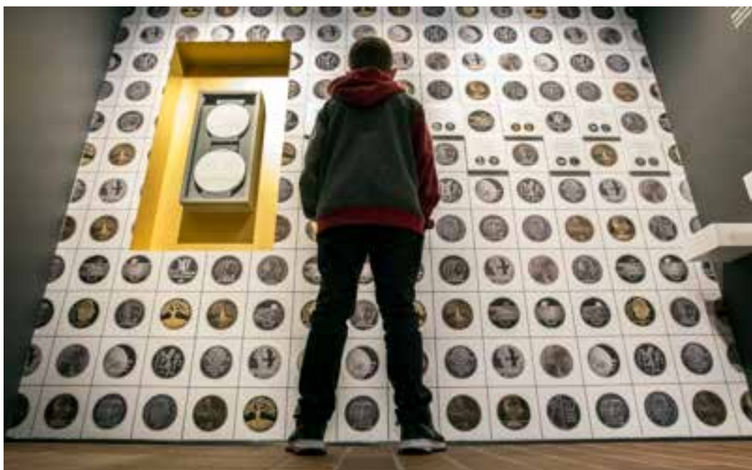
Fra utstillingen "Kongen og elgen: formgivning av mynter og medaljer i 200 år".

av Ingrid Austlid Rise ved Det Norske Myntverket. Utstillingen viser vinnermynten og de 23 andre bidragene som var med i designkonkurransen om jubileumsmynten. Utstillingen ble første gang vist på Nasjonalmuseet for kunst, Museet for samtidskunst, i Oslo 19. juni – 20. august 2016.