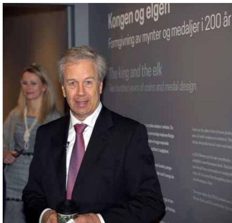
Sentralbanksjef Øystein Olsen fra åpningen av utstillingen Kongen og elgen - formgivning av mynter og medaljer i 200 år

Norsk Bergverksmuseum er ansvarlig for Bergverksnettverket, et faglig museumsnettverk for