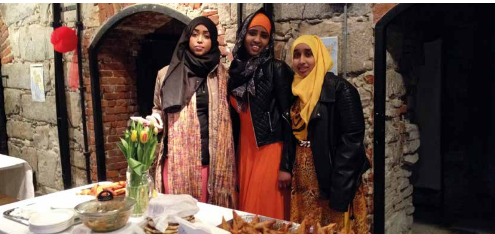
Nyttårsfeiring verden over i Smeltehytta.

Museets ansatte har i 2016 arbeidet tett med selskapet Redia om utviklingen av en app, og har gjennomført flere befaringer og kartlegging i gruveåsen. Museet mottok midler fra Sparebankstiftelsen DNB og Sølvverkets Venner, noe som også utløste gaveforsterkningsmidler fra Kulturdepartementet.