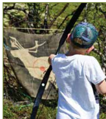
“Lavsirkelen” og bueskyting. Populære aktiviteter på Hjerkin.

Også i 2017 var det i sommersesongen ansatt en naturveileder ved Gaustatoppen. Dette er et samarbeid mellom Norsk villreinsenter Sør og en lokal prosjektgruppe opprettet for videreutvikling av Gaustatoppenområdet, ledet av VisitRjukan. Villreinsenteret finansierer stillingen, men oppfølging og opplæring skjer i fellesskap. I 2017 var det ca. 80.000 telte besøkende i løpet av sommersesongen. Med et slikt potensiale, vil satsingen videreføres og styrkes de neste årene.