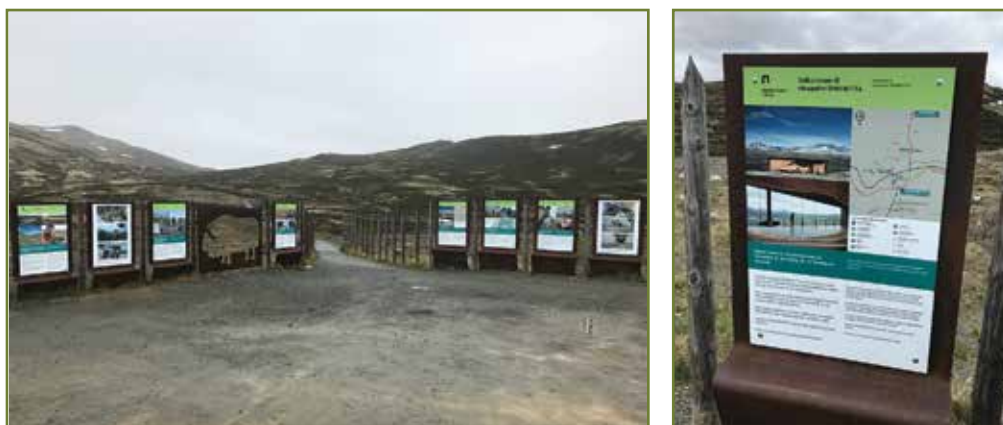
Parkeringsplassen og "inngangen" til viewpoint SNØHETTA.