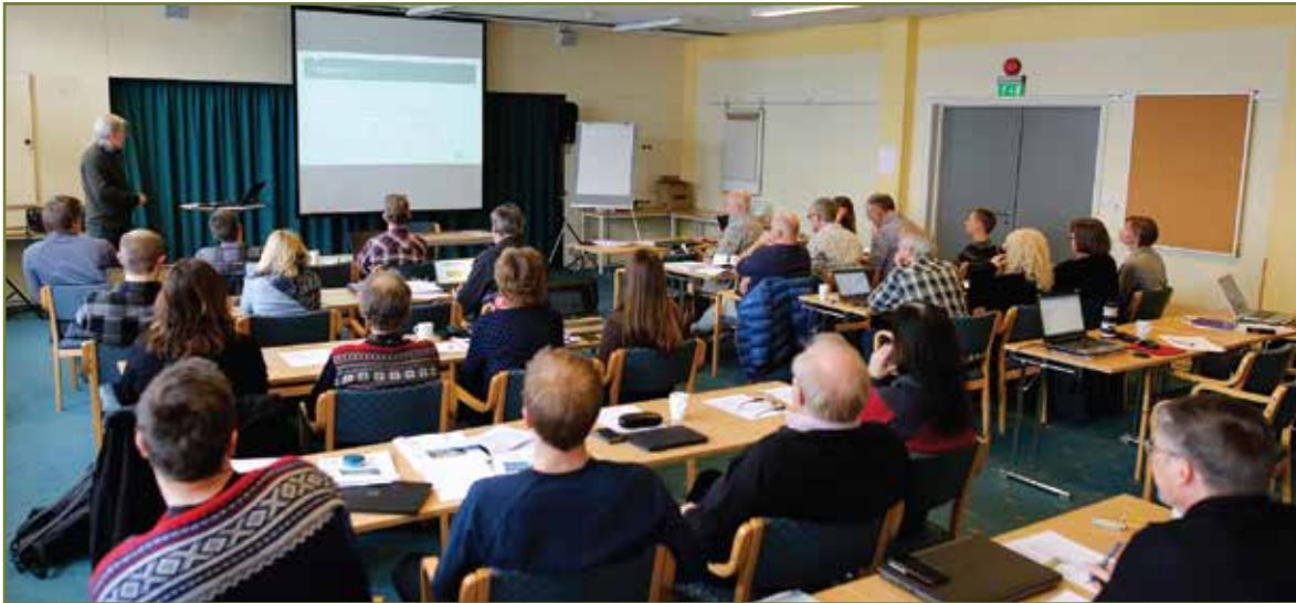
Nettverksamling for prosjektene i verdiskapingsprogrammet "Villrein fjellet som verdiskaper".