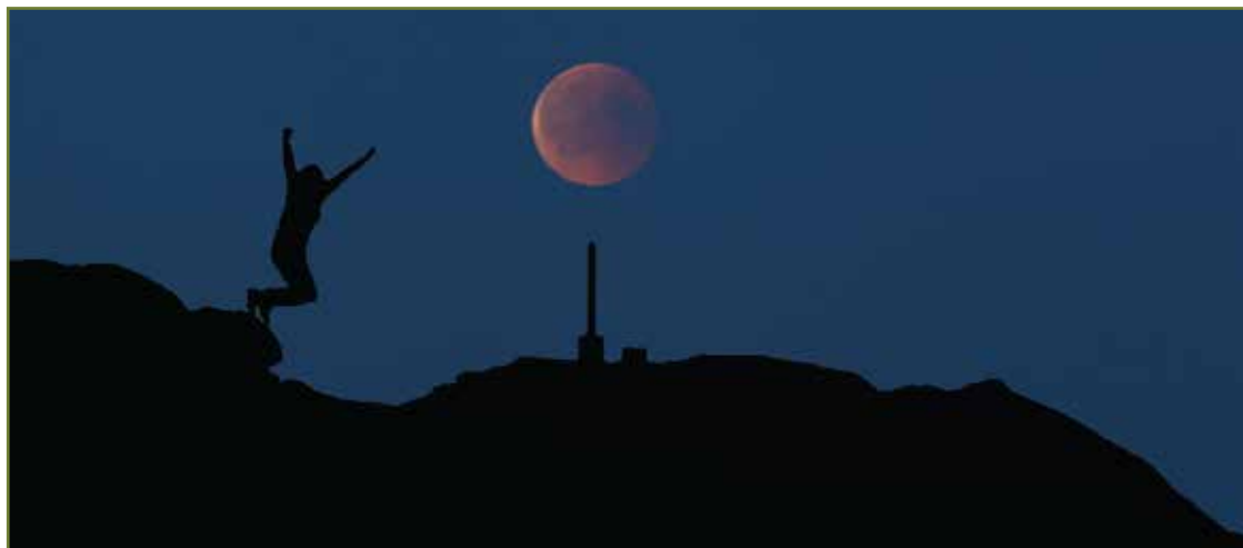
Villreinsenteret på Skinnarbu hadde naturveileder på Gaustatoppen også i 2017.

i Norge. Nettsiden ble lansert første gang i 2009 og relansert i ny form i 2014. I 2017 har det igjen vært en betydelig økning i antall besøk, sammenliknet med foregående år. Nettsiden har gjennom året hatt 87.304 unike besøkende og 236.279 sidevisninger. Sammenliknet med 2016 er dette en økning på hhv. 62 og 34 %.