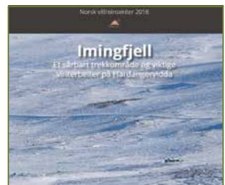
Skjermdump fra kartfortellingene om "fokusområder" og fokusområdet "Imingsfjell".