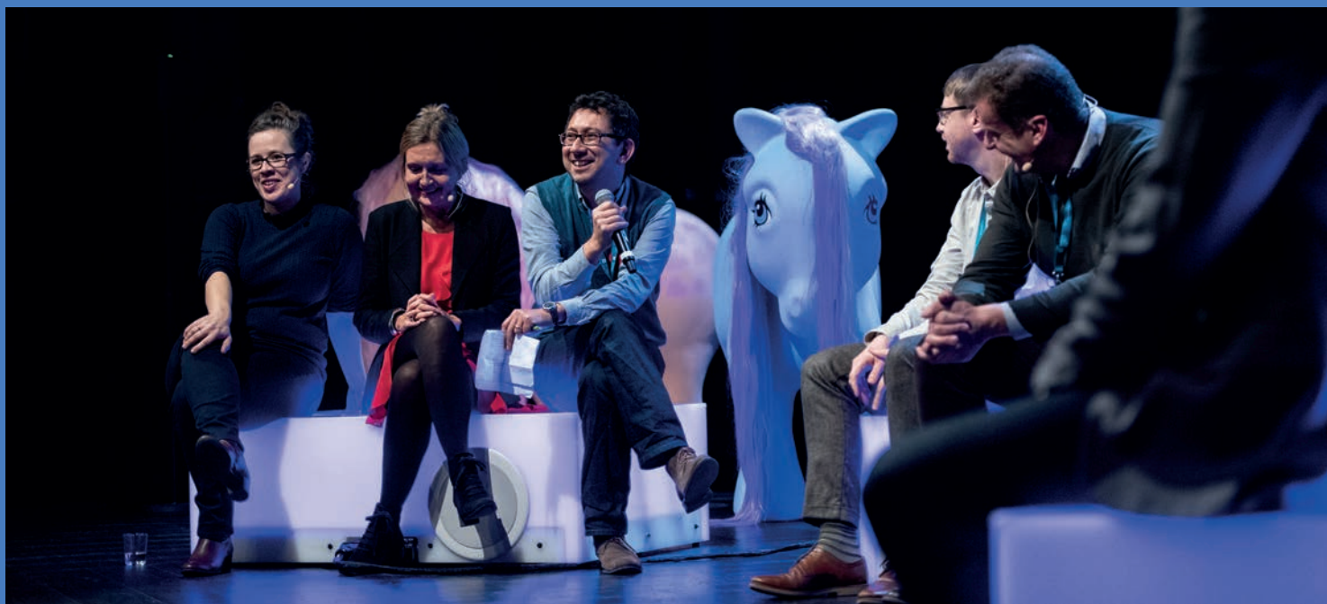
KVALITET. FoU-konferansen Kvalitet i kunst og kultur til barn og unge gikk av stabelen i november, med gjester fra blant annet Arts Council i England.