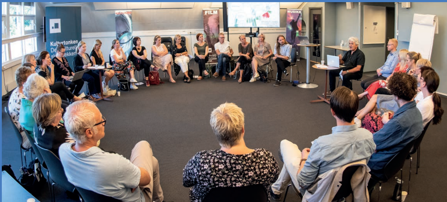
SAMTALER. I høst deltok over 70 personer på heldagssamtaler om fagområdene scenekunst og visuell kunst i Den kulturelle skolesekken (DKS).