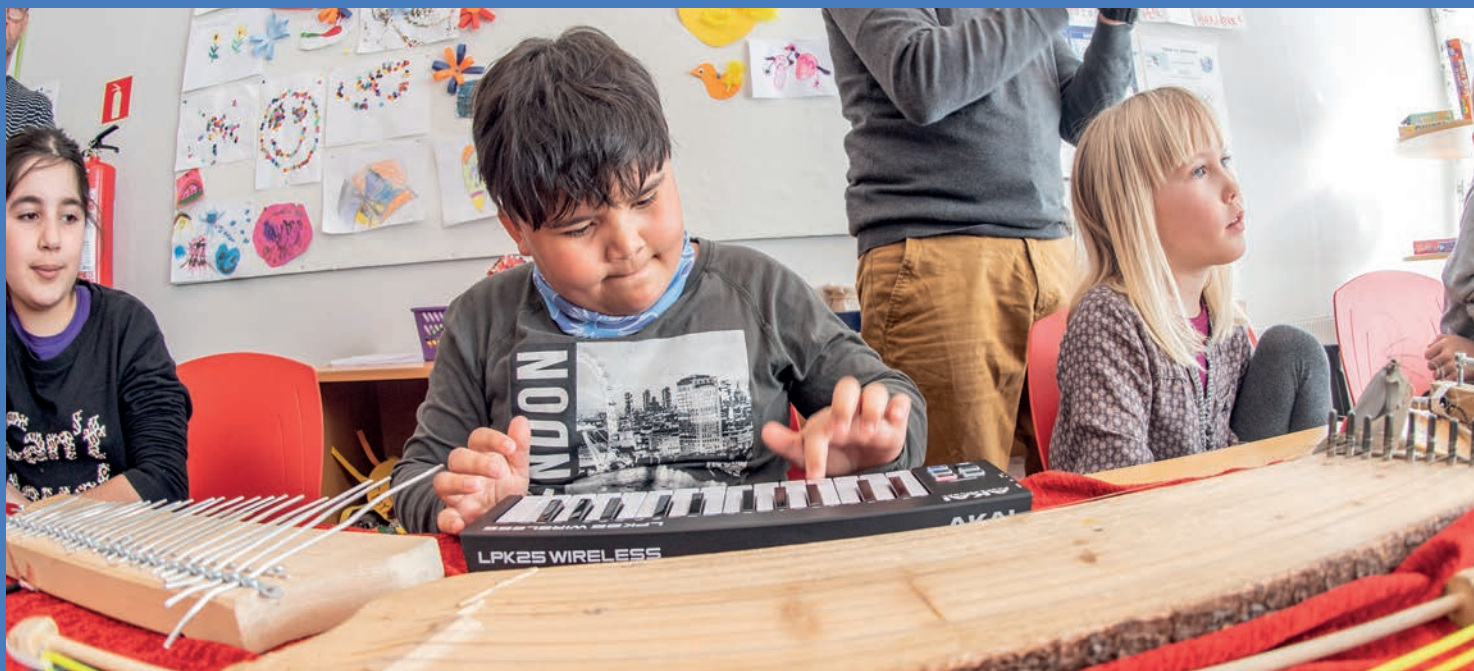
LYDLOFT — Drivhusets komposisjonsverksted på turné i Finnmark.