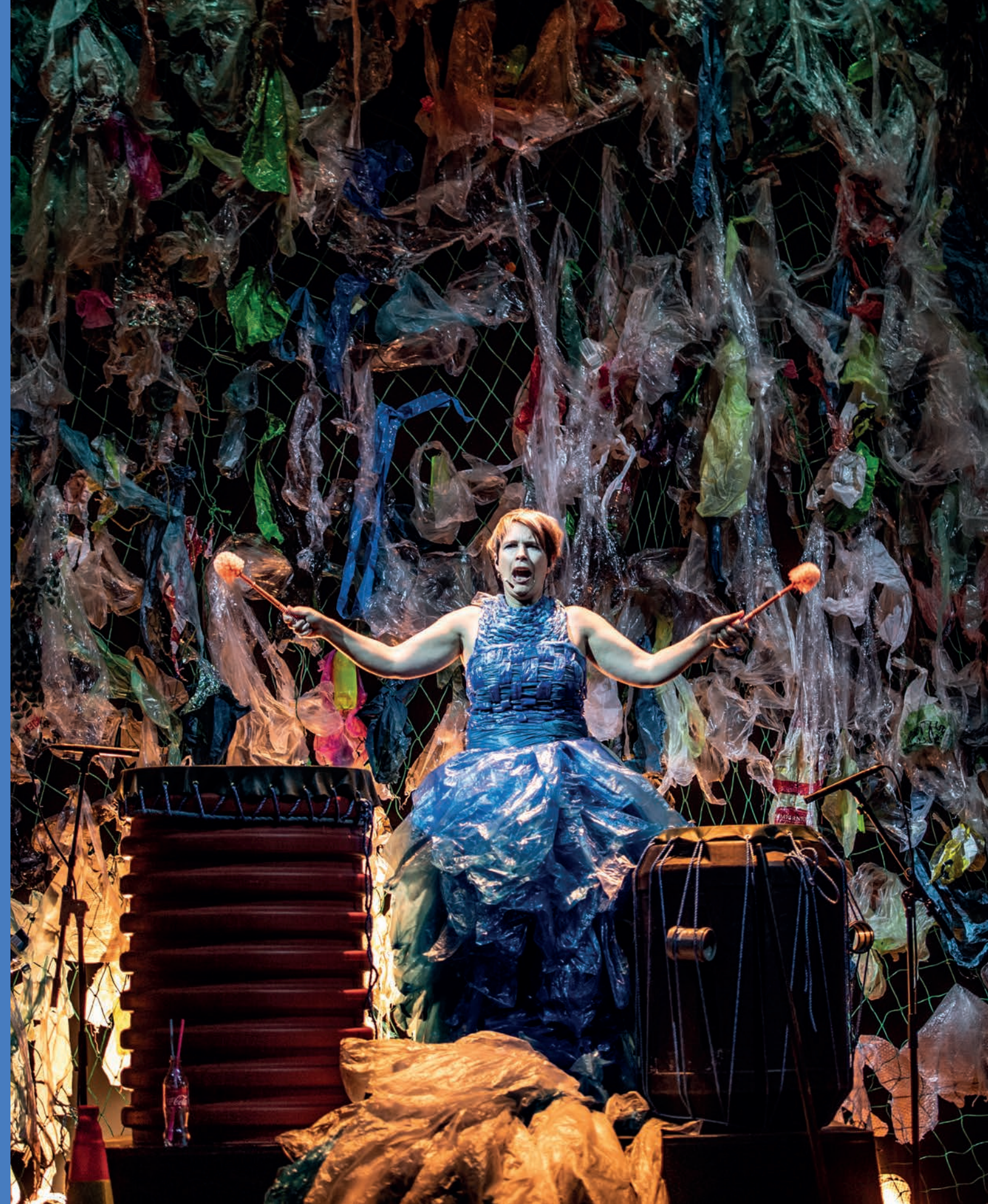
Sustain, en konsertforestilling om forsøpling og menneskers forhold til naturen — fra DKS Vestfolds visningsarena Marked for musikk i Larvik, oktober 2018.

Oppsett: Lars Opstad Forsidefoto: Danser Abir Alyousofi, fra Teater Innlandets danseforestilling Hello, regi/koreografi: Therese Slob. Bildet er tatt under Scenekunstbrukets visningsarena Showbox, desember 2018.