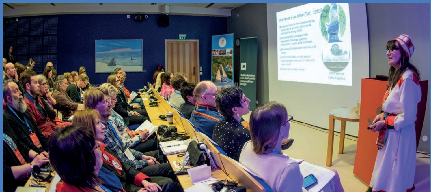
NASJONENS STEMME — konferanse på Sametinget i Karasjøk markerte startskuddet for fokus på samisk kunst og kultur i DKS.