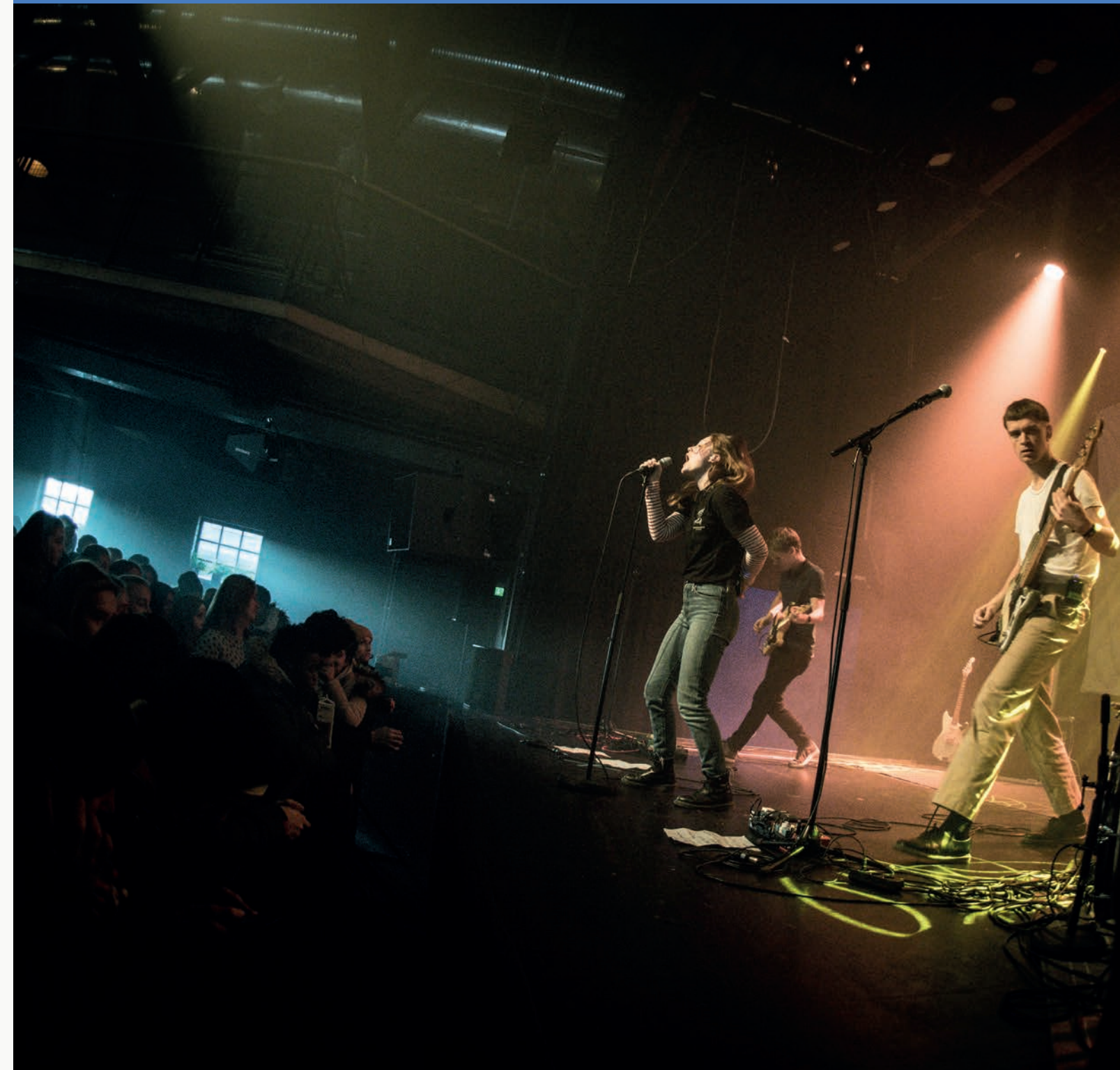
Formiddagspunk med feministisk trøkk. Elever ved videregående skoler i hele Buskerud fikk i høst besøk av Slotface

Skolekonsertordningen opphørte formelt 13. august 2018. Vårsesongen 2018 var den siste i skolekonsertordningens historie, og øremerkede midler ble tildelt for siste gang. I forbindelse med avvikling av ordningen ble den tilhørende TONO-avtale sagt opp fra og med 1. januar 2019. Konsertutstyr fra Kulturtankens lager ble distribuert til våre tilskuddsmottakere etter søknad og behov.