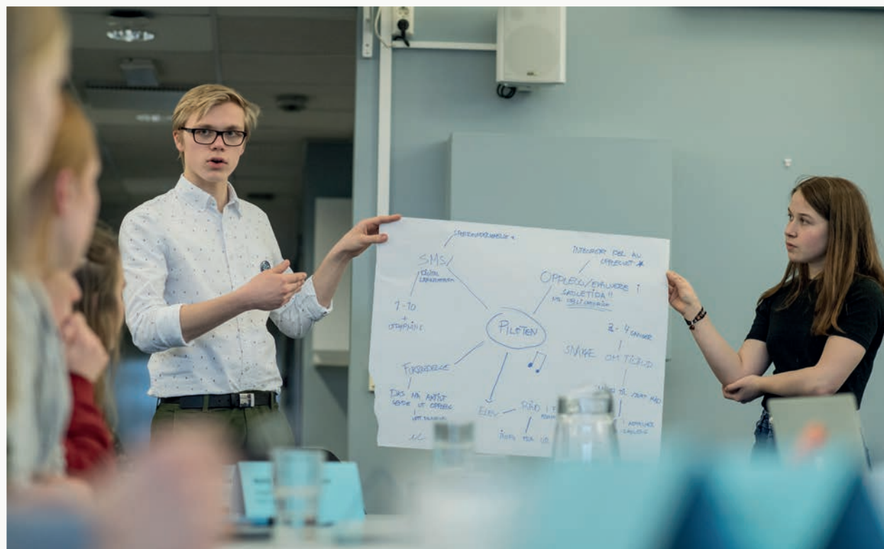
Det nyetablerte ungdomsrådet i full sving under en workshop i Kulturtankens Kunstlab.

På møtene har Ungdomsrådet arbeidet med elevmedvirkning i Den kulturelle skolesekken og utarbeidet forslag til piloter om elevmedvirkning i DKS, arbeidet og forberedt Ungdomsrådets involvering i konferansen om elevmedvirkning, gitt tilbakemeldinger på tilskuddsmottakernes forslag til piloter på elevmedvirkning i skoleprosjektet samt gitt innspill til kulturarv og involvering i Arena kulturarv.