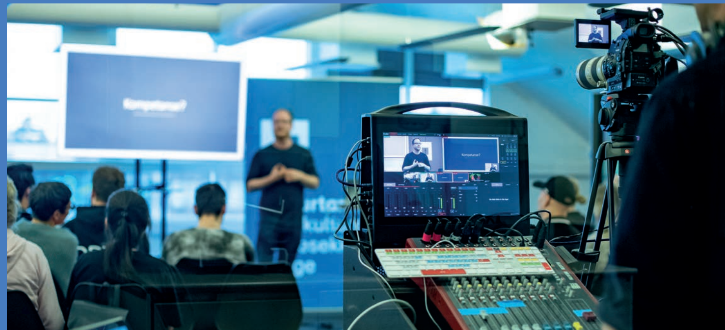
KUNSTLAB — Kulturtankens kunstlab brukes som testlab for nye DKS-produksjoner med fokus på digital formidling og seminarer som strømmes direkte.