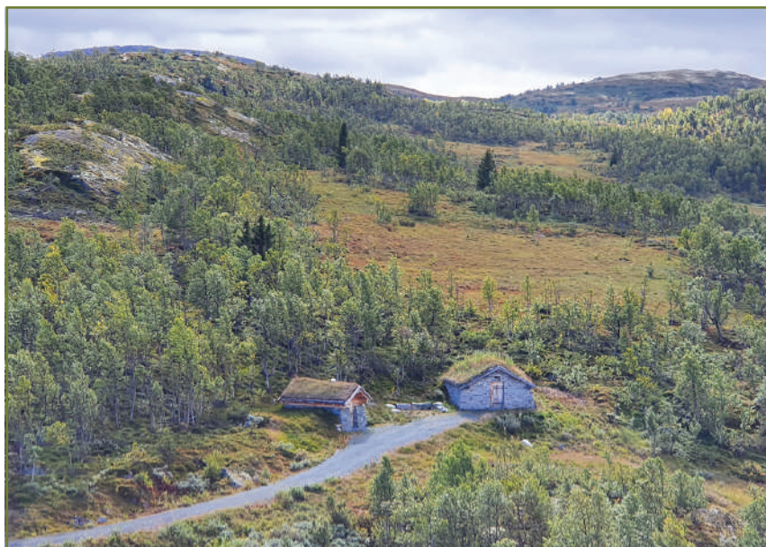
Steinbua og servicebygget.

Som følge av nedleggelsen av Statens naturoppsyns naturveiledningsseksjon har det ellers vært lav aktivitet rundt både Oldemorstien og Steinbua. Dette vil endre seg i 2020 som følge av ansettelsen av en naturveileder ved villreinsenteret.