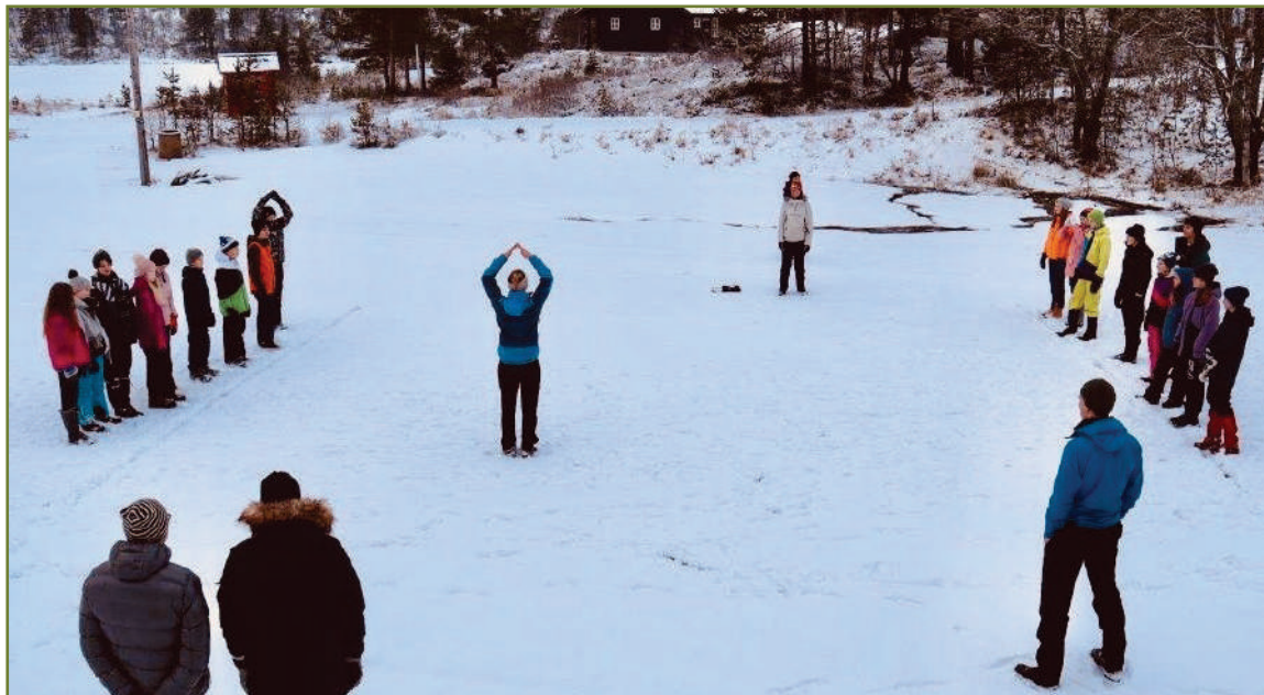
Opplæring av leirskoleansatte, som del av verdiskapingsprosjektet i SVR.

Naturveilederen har også deltatt på Miljødirektoratets årlige samling for besøkssentre, og holdt også opplegg på naturveiledersamlinga på Hjerkin.