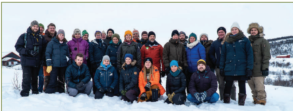
Naturveiledersamling på Hjerkin.

I februar 2019 var naturveilederne ved Norsk villreinsenter Nord vertskap for ei samling for naturveiledere fra hele landet. Det var et vellykka og veldig lærerikt arrangement. Det er nyttig for oss med slike treffpunkt, selv om vi arbeider med alle slags typer natur og på veldig ulike besøkssenter. Det var få andre arrangement med muligheter for faglig oppdatering i 2019, så denne samlinga var et viktig påfyll for alle deltakerne.