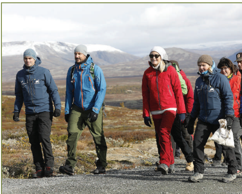
Kronprinsparet besøkte viewpoint SNØHETTA i september 2019.

17. september startet kronprinsparet sitt fylkesbesøk i Oppland med et besøk på viewpoint SNØHETTA. Dovre kommune var vertskap, og Norsk villreinsenter bidro med naturveiledning og tilrettelegging ved besøket. Mye folk, god stemning, moskus og flott utsikt bidro til en flott dag på fjellet!