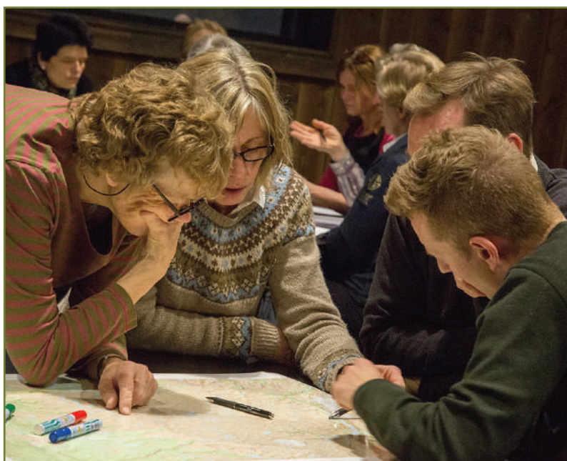
Ivrige seminardeltakere jobber med å identifisere fokusområder på Hardangervidda.

Norsk villreinsenter Sør har også tilrettelagt for flere møteplasser utenfor Skinnarbu i året som gikk. Dette gjelder som tidligere de årlige møtene i FoU-prosjektene på villrein i Langfjella, men i 2019 også et stort 2-dagers seminar på Geilo om villrein og ferdsel på Hardangervidda. Seminaret ble arrangert i samarbeid med Miljødirektoratet og var en oppfølger til tidligere seminarer om villrein og ferdsel som ble holdt henholdsvis på Hjerkind i 2009 og Geilo i 2018. Seminaret trakk over 80 deltakere og presenterte siste nytt fra ferdselsprosjektet på Hardangervidda, som er et delprosjekt under GPS-merkeprosjektet på villrein på Hardangervidda og i Nordfjella. Seminaret hadde som hovedfokus å starte arbeidet med å identifisere, avgrense og foreslå tiltak innenfor såkalte fokusområder. Gjennom dette ønsker man også å bidra til felles kunnskapsgrunnlag for de ulike forvaltningsprosessene som nå går parallelt (besøksstrategi for Hardangervidda nasjonalpark, rullering av regional plan for Hardangervidda og verdiskapingsprosjektet "Velkommen til villrein fjellet"), samt å bli bedre kjent med de ulike brukergruppene rundt vidda.