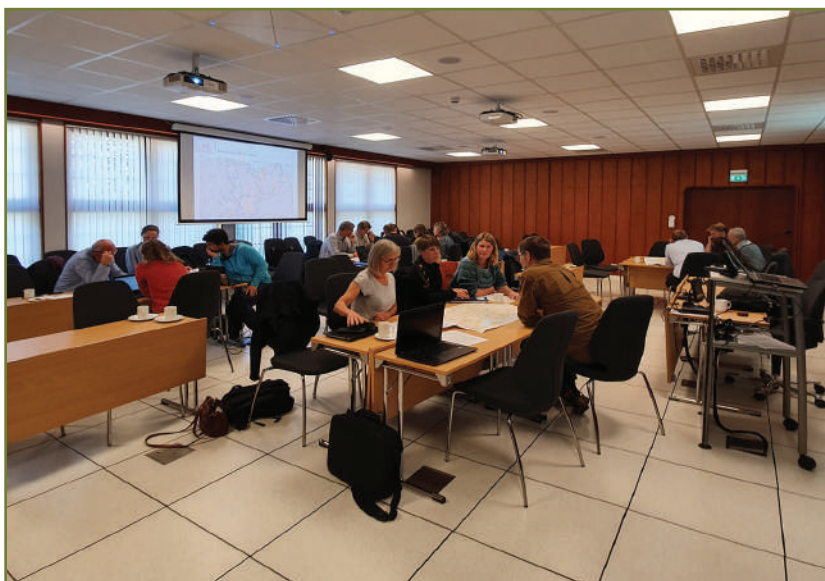
Møte i referansegruppa for arbeidet i Fjellheimen.

Norsk villreinsenter Sør er involvert i arbeidet med kartlegging av villreinens arealbruk i Fjellheimen, både gjennom deltakelse i styringsgruppa for prosjektet og som sekretariat for en bredt sammensatt referansegruppe. Referansegruppa har i 2019 møttes to ganger. Dette har vært organisert som gruppearbeid med hovedmål rettet mot å identifisere fokusområder og mulige tiltak innenfor disse. Et notat om arbeidet i referansegruppa er forventet ferdigstilt parallelt med avslutning av kartleggingsarbeidet i løpet av første kvartal 2020.