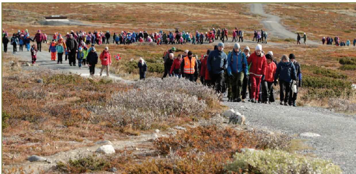
Besøkende på vei til viewpoint SNØHETTA.

De fleste gruppene som kommer til Hjerkin for naturveiledning, er med på tur til viewpoint SNØHETTA. Uteområdet ved Fjellportalen blir fortsatt brukt til naturveiledning for grupper og skoleklasser. Området egner seg godt for grupper som ikke ønsker å bruke tid på å gå opp til viewpoint SNØHETTA, ofte etter en lang bussreise. Vi ser fram til å utvide tilbudet nede ved senteret med faglig innhold i Fjellportalen i løpet av 2020. Fjellportalen med uteområde er også et godt alternativ dersom været er dårlig og lite egnet for en tur til viewpoint SNØHETTA. Antall grupper som ønsker natur- og kulturveiledning i uteområdet er mindre enn for viewpoint, men når vi får heldagsbesøk av skoleklasser, gjør vi ofte begge deler. Etter hvert som Fjellportalen blir ferdigstilt, regner vi med at aktiviteten av både planlagte og tilfeldige besøk vil øke.