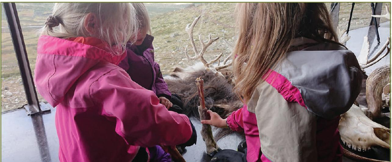
Femåringer opplever villrein og moskus på viewpoint SNØHETTA.

"Fjellportalen" er under utvikling. En del elementer, som for eksempel kart og turforslag, kom på plass i 2019. Det samme gjorde den steinmura «Ura» hvor de besøkende kan slappe av og fyre bål. I løpet av 2020 vil innholdet i selve Fjellportalen utvides ytterligere, og knyttes opp mot de eksisterende rekonstruksjonene i uteområdet som viser menneskers bruk av fjellet i tidligere tider. Her skal de besøkende få bli kjent med den fantastiske villreinen, og få innsikt i vår felles ferdselshistorie på Dovrefjell fram til dagens utfordringer knyttet til ferdsel og bruk av fjellet.