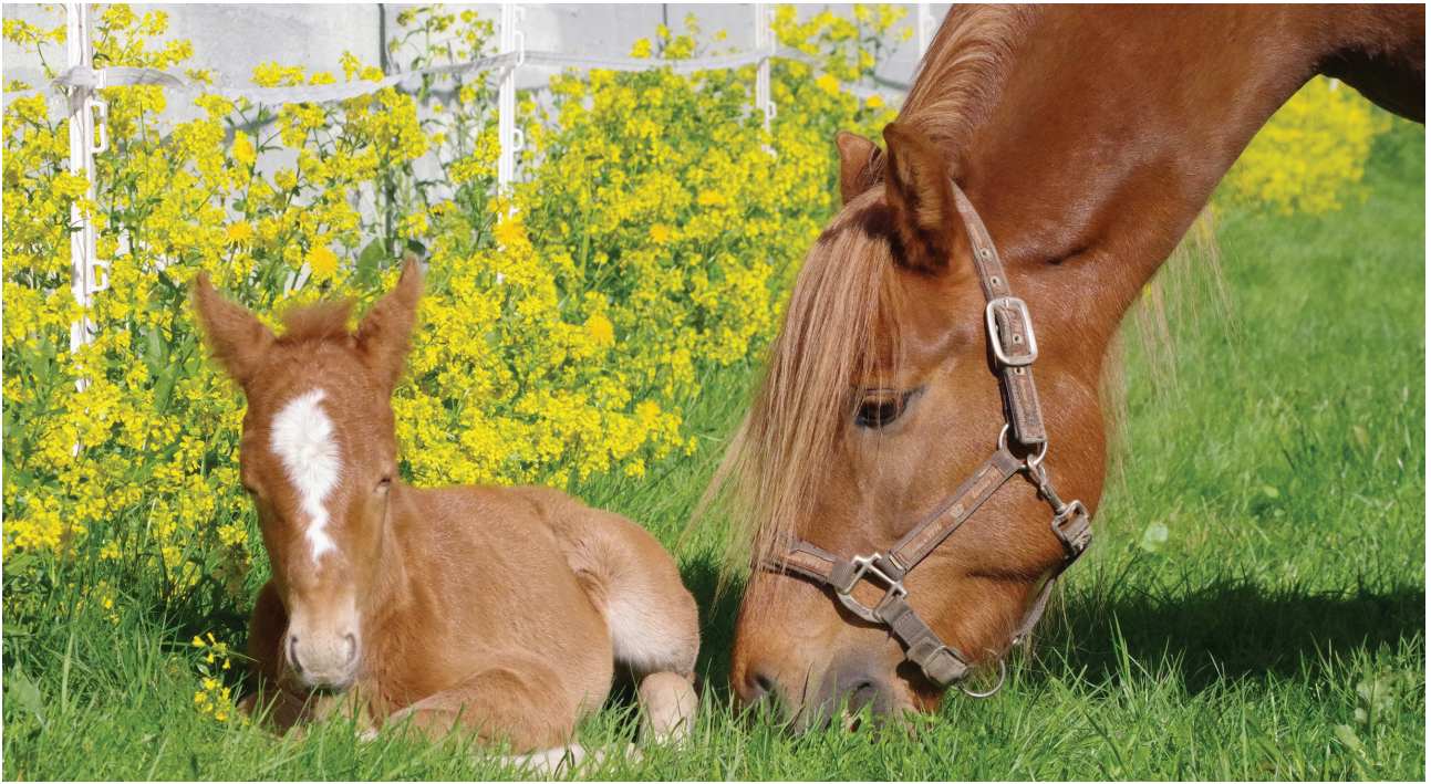
Starums Tora ble født på Starum i mai 2019, og er en av nordlandshest/lyngshestene som ble registrert dette året.