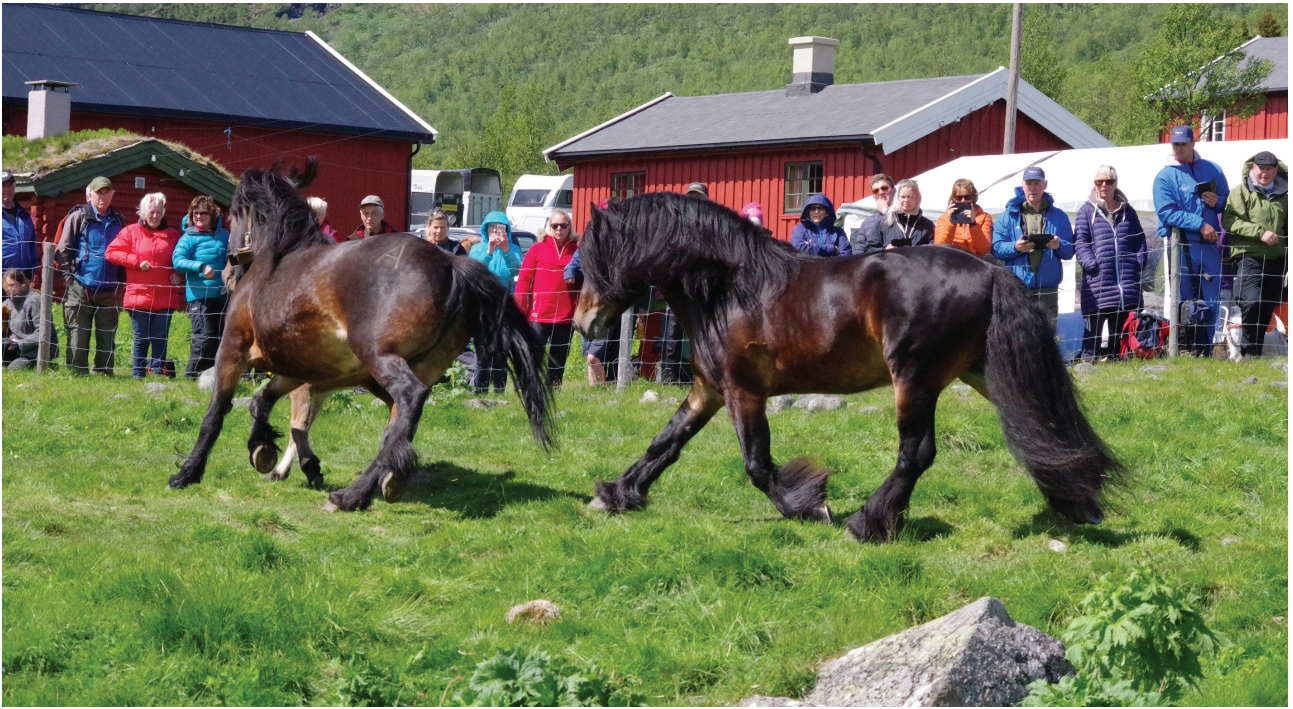
Stjerne Gut under slippet i Åkrehamna i 2019.