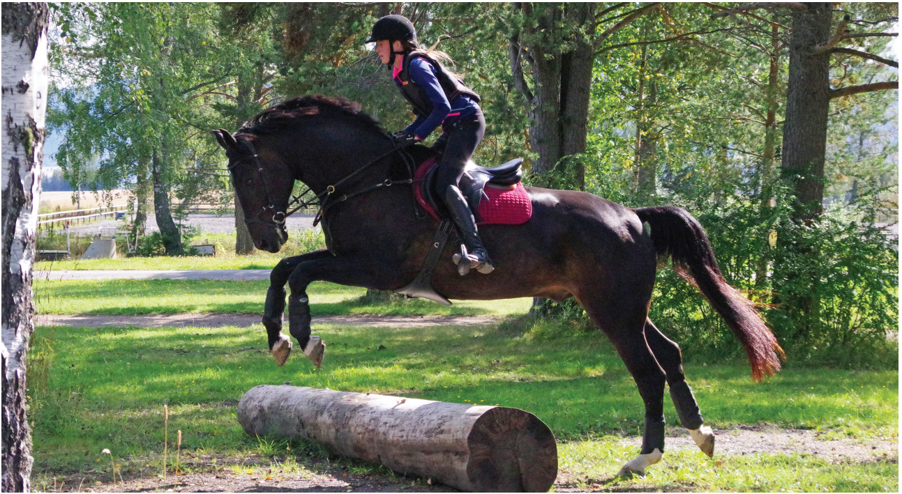
Studenter på ridelærer 1 får undervisning i terrengritt.