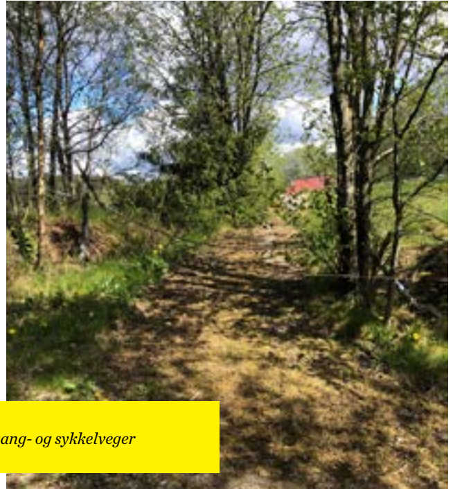
Fotografier fra inspeksjon av gang- og sykkelveger