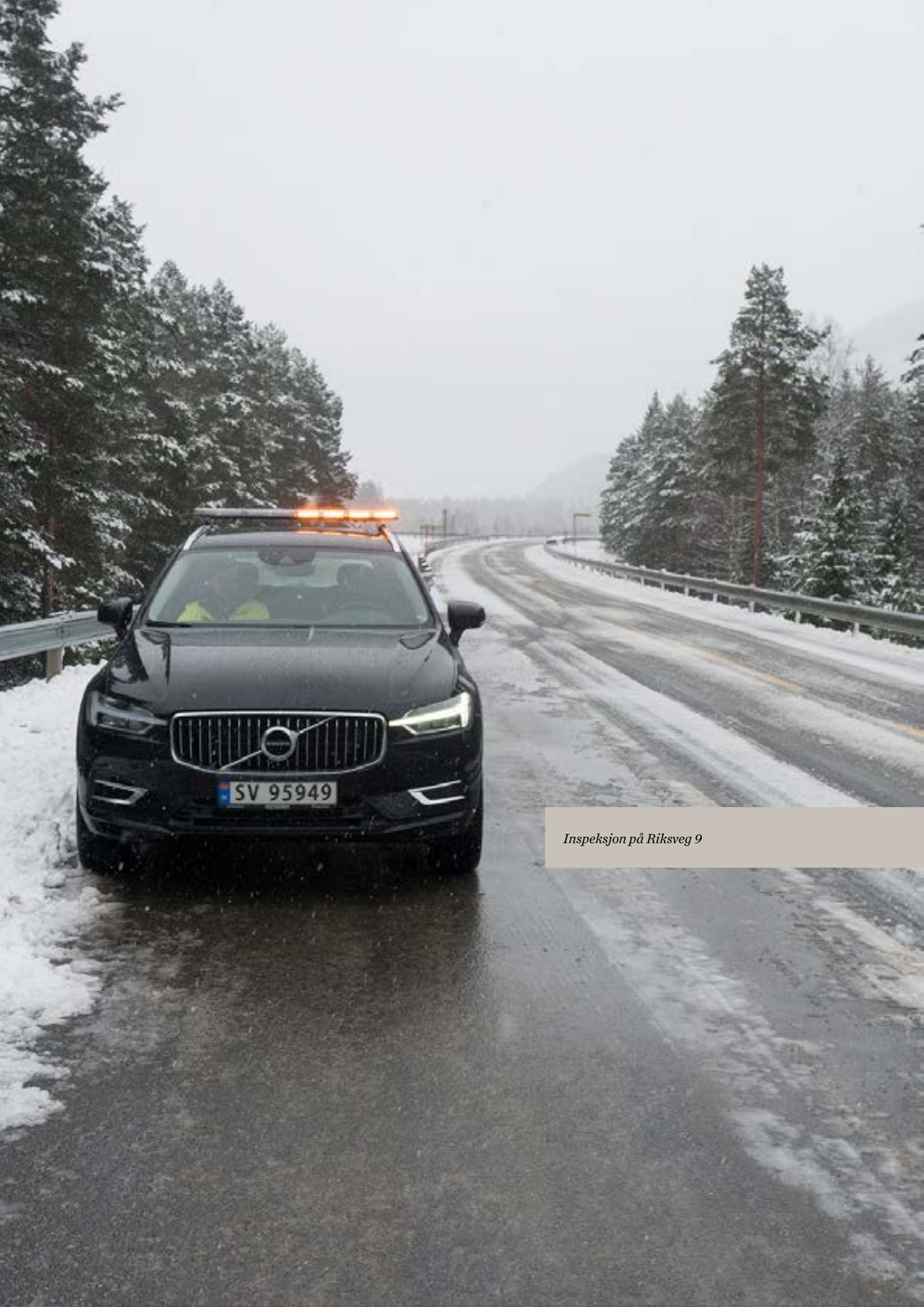
Inspeksjon på Riksveg 9