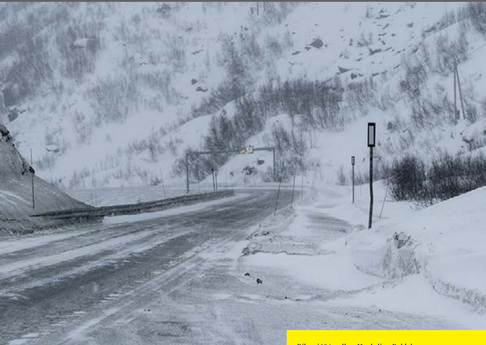
Riksvei 134 mellom Haukeli og Røldal