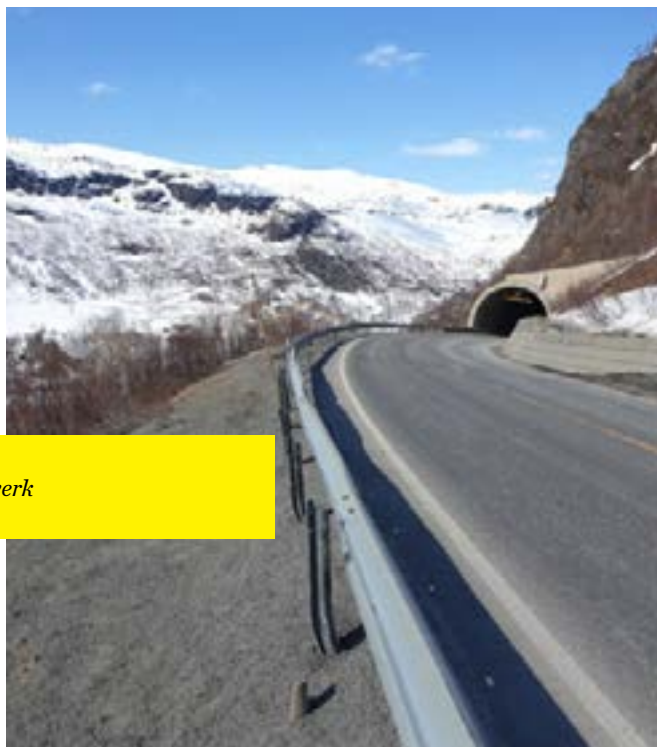
Fotografier fra inspeksjon av rekkverk