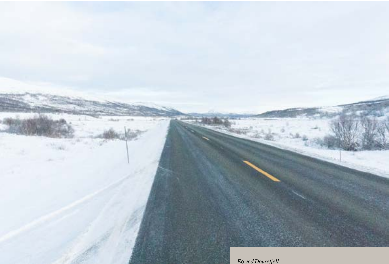
E6 ved Dovrefjell