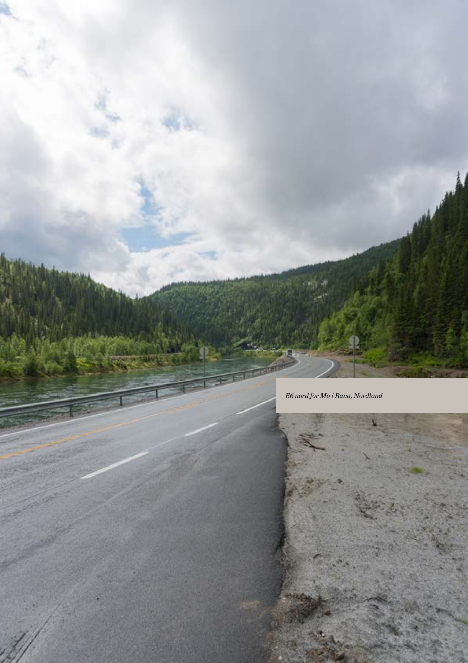
E6 nord for Mo i Rana, Nordland