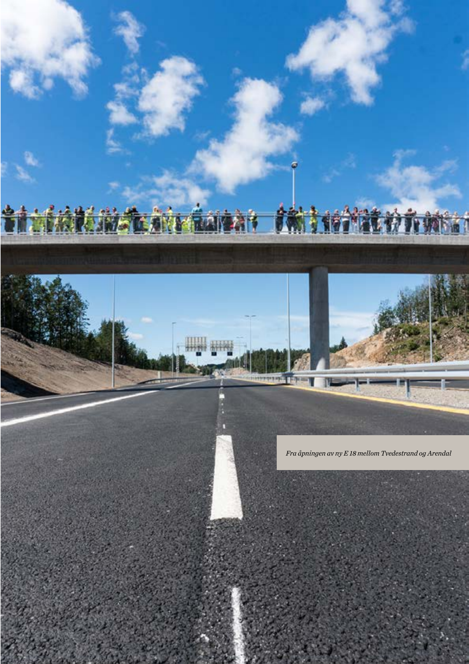
Fra åpningen av ny E18 mellom Tvedestrand og Arendal