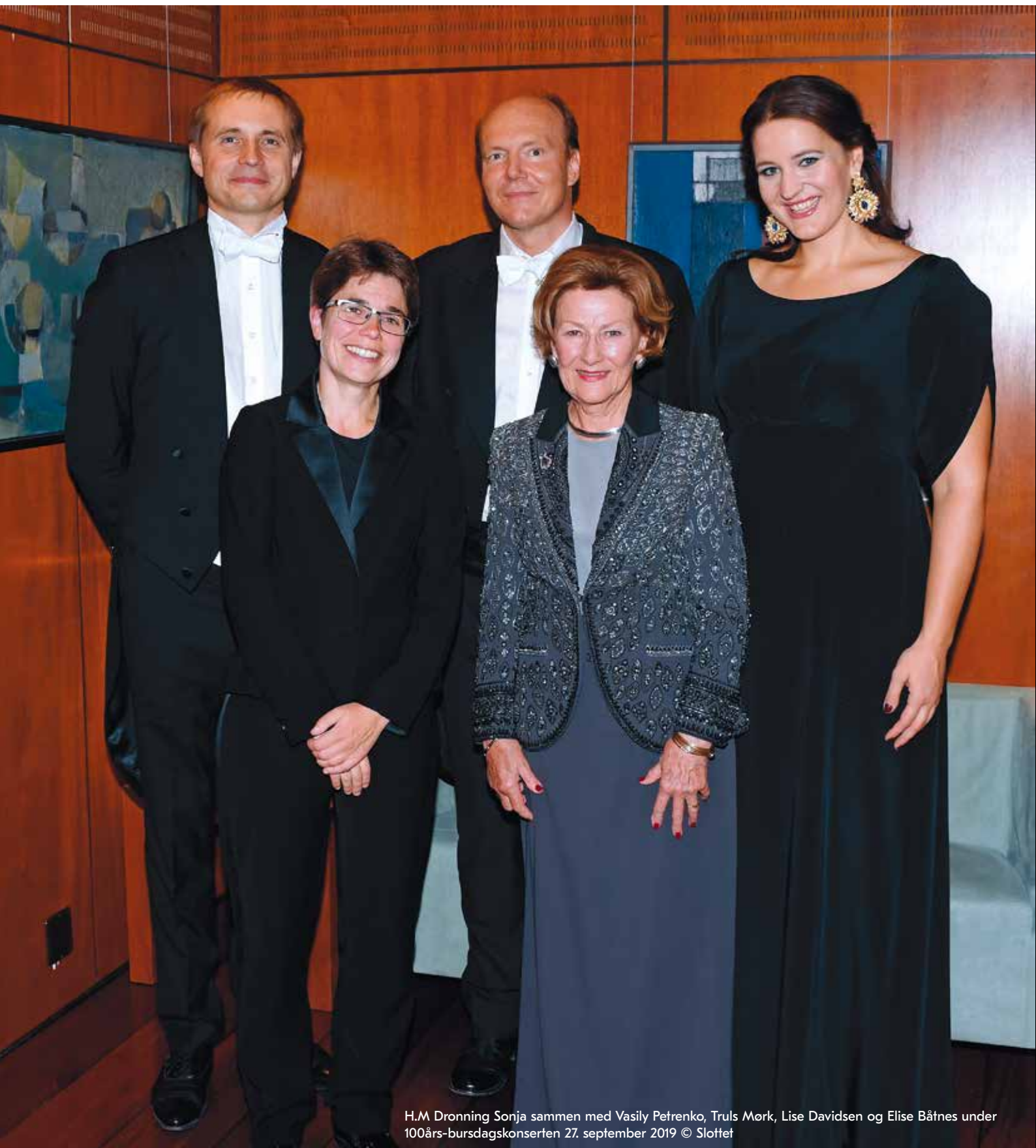
H.M Dronning Sonja sammen med Vasily Petrenko, Truls Mørk, Lise Davidsen og Elise Båtnes under 100års-bursdagskonserten 27. september 2019