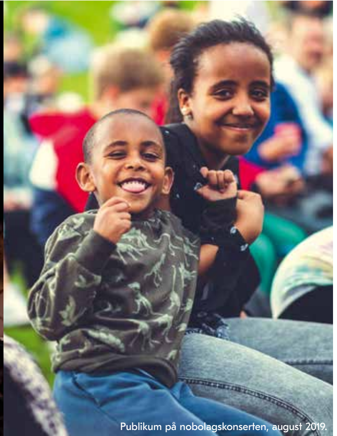
Publikum på nobolagskonserten, august 2019.