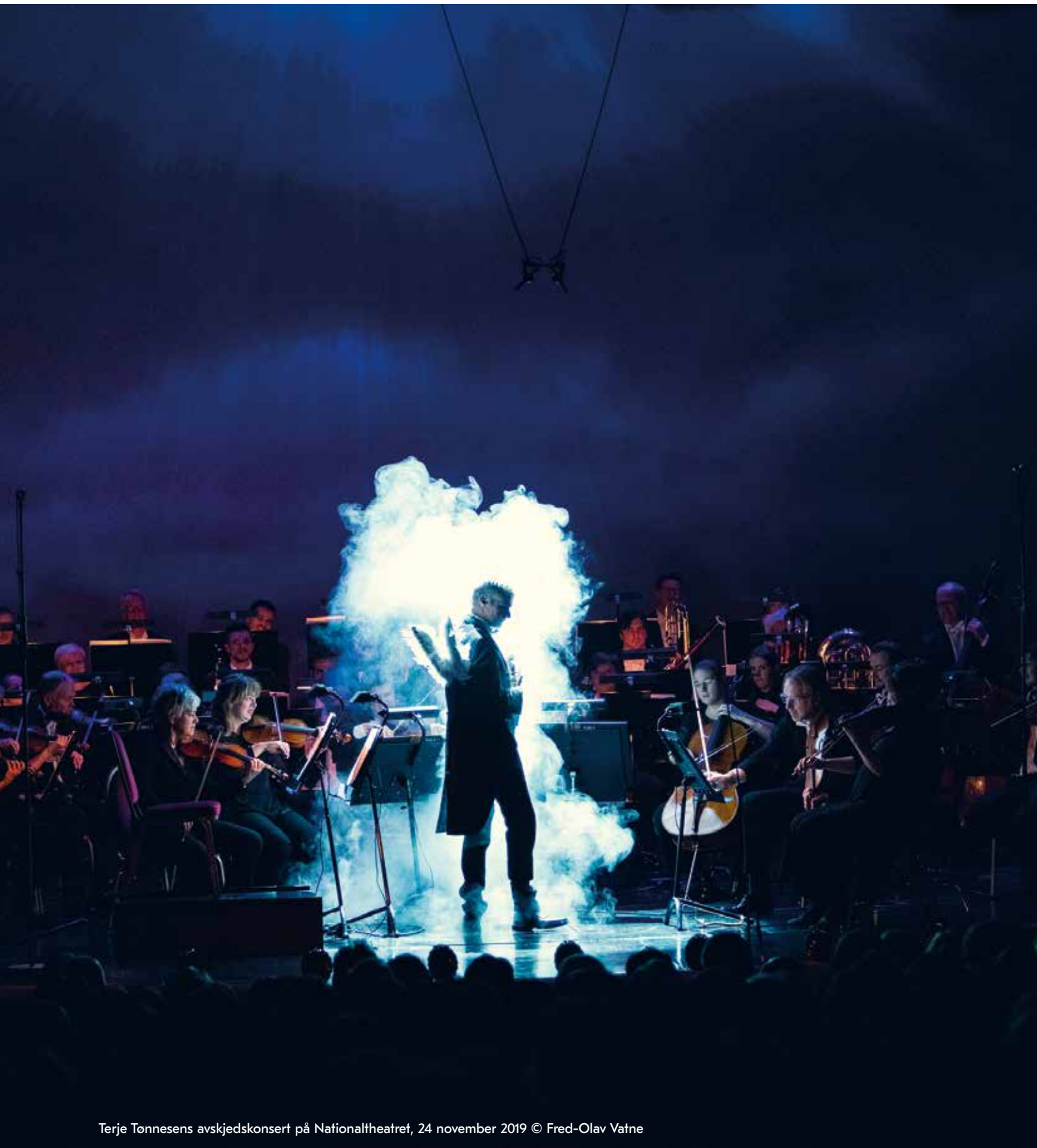
Terje Tønnesens avskjedskonsert på Nationaltheatret, 24 november 2019