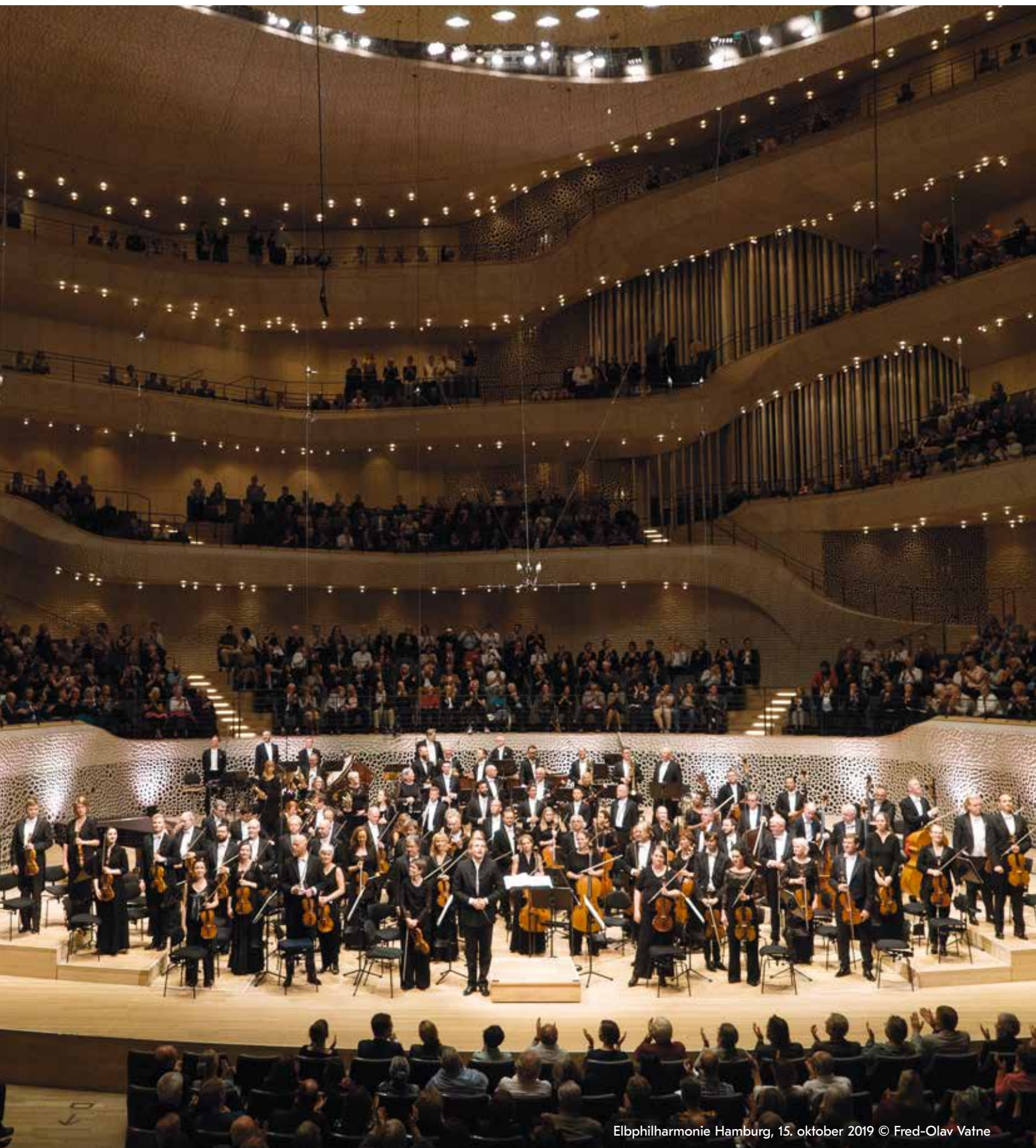
Elbphilharmonie Hamburg, 15. oktober 2019