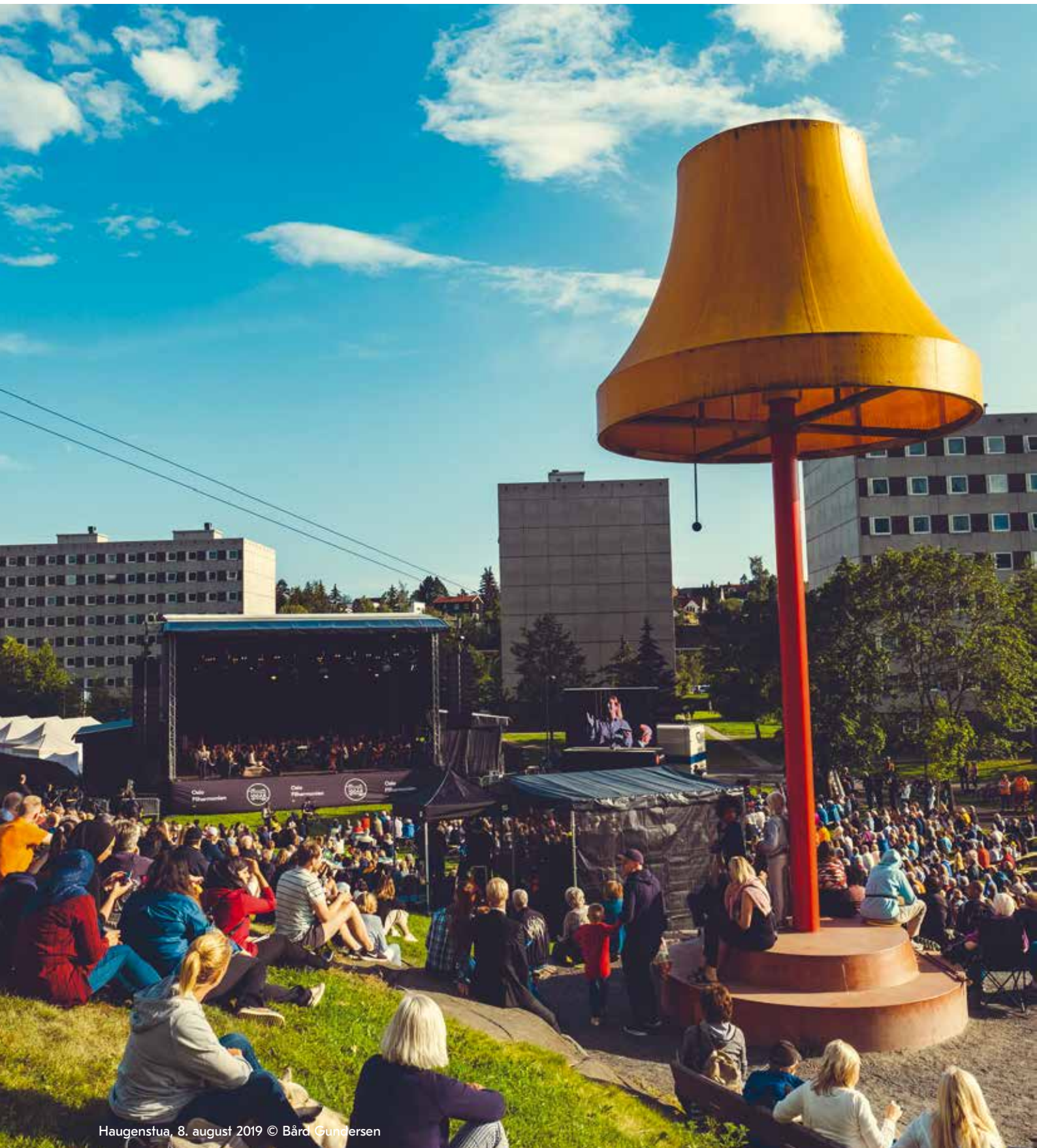
Haugenstua, 8. august 2019