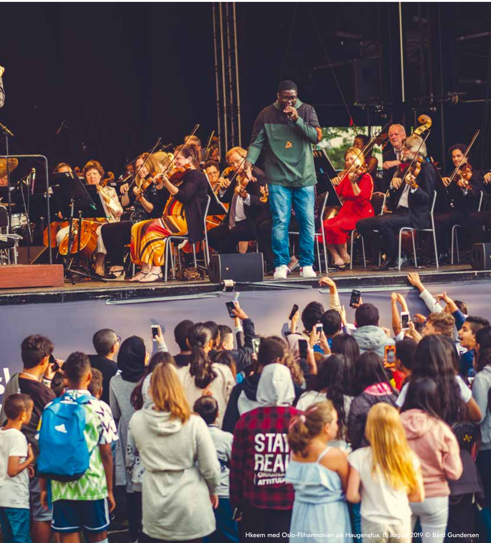
Hkeem med Oslo-Filharmonien på Haugenstua, 8. august 2019