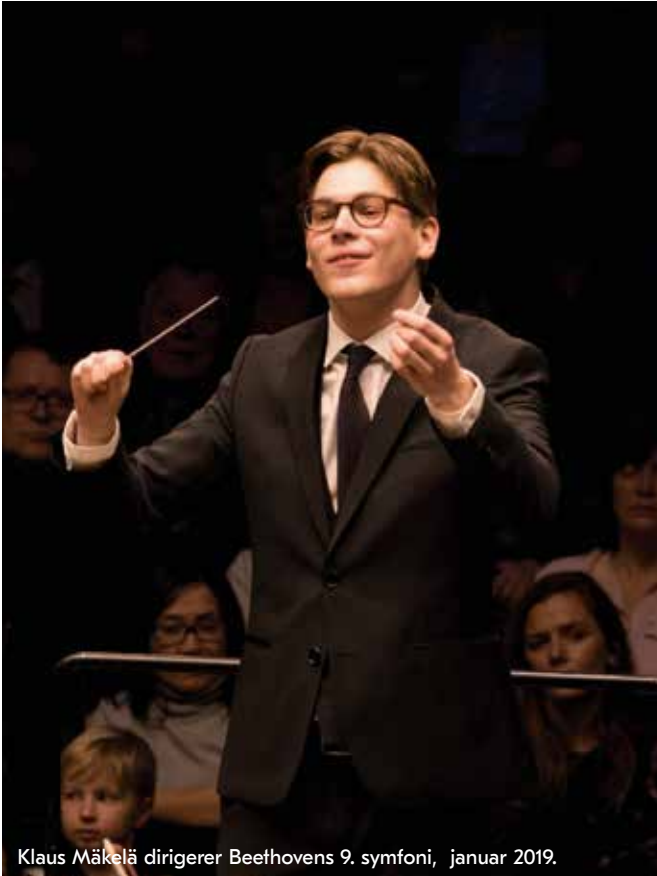
Klaus Mäkelä dirigerer Beethovens 9. symfoni, januar 2019.