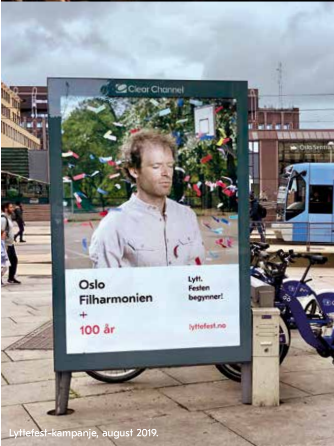
Lyttfest-kampanje, august 2019.