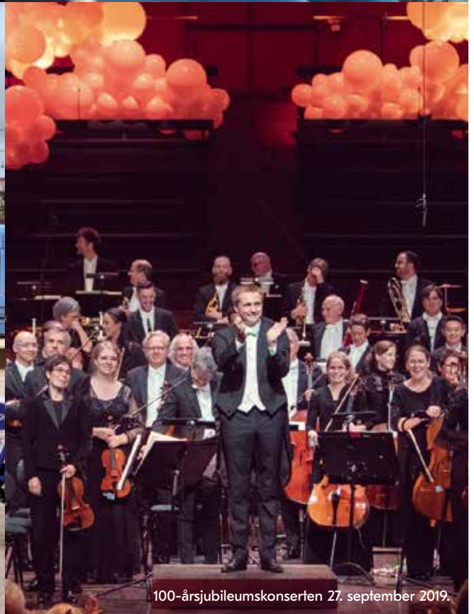
100-årsjubileumskonserten 27. september 2019.