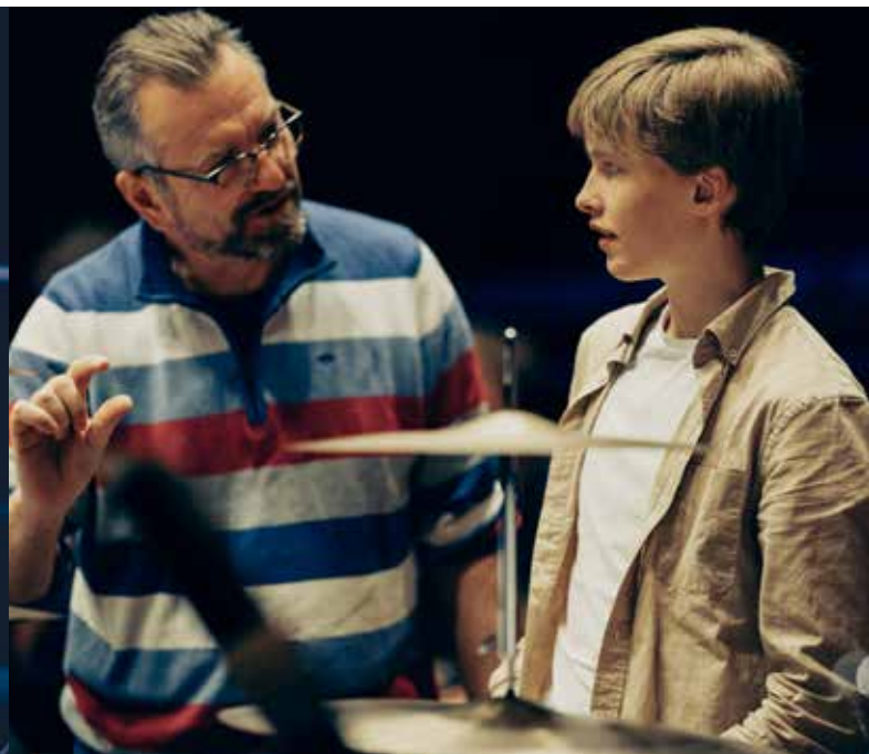
Ung Filharmoni, oktober 2019