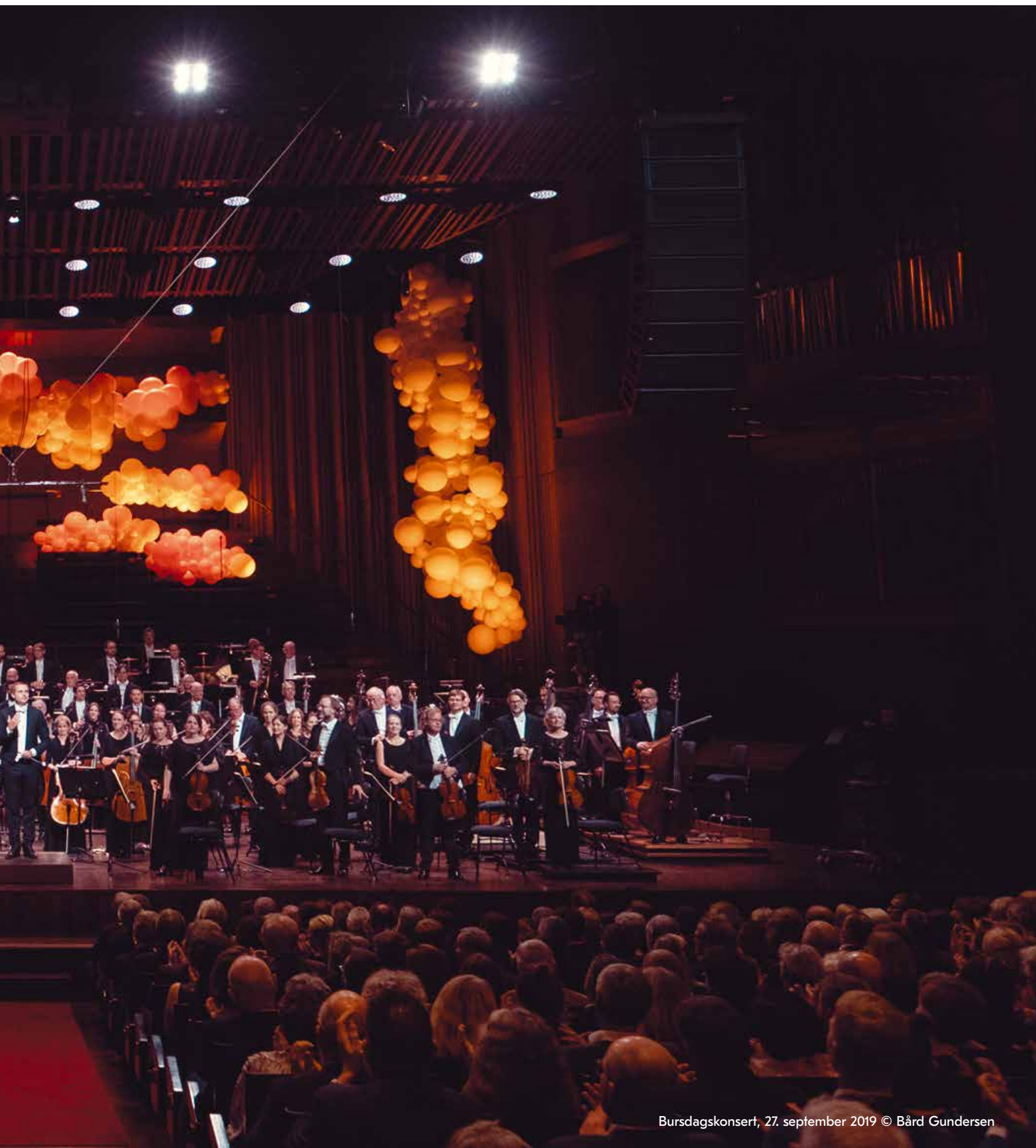
Bursdagskonsert, 27. september 2019