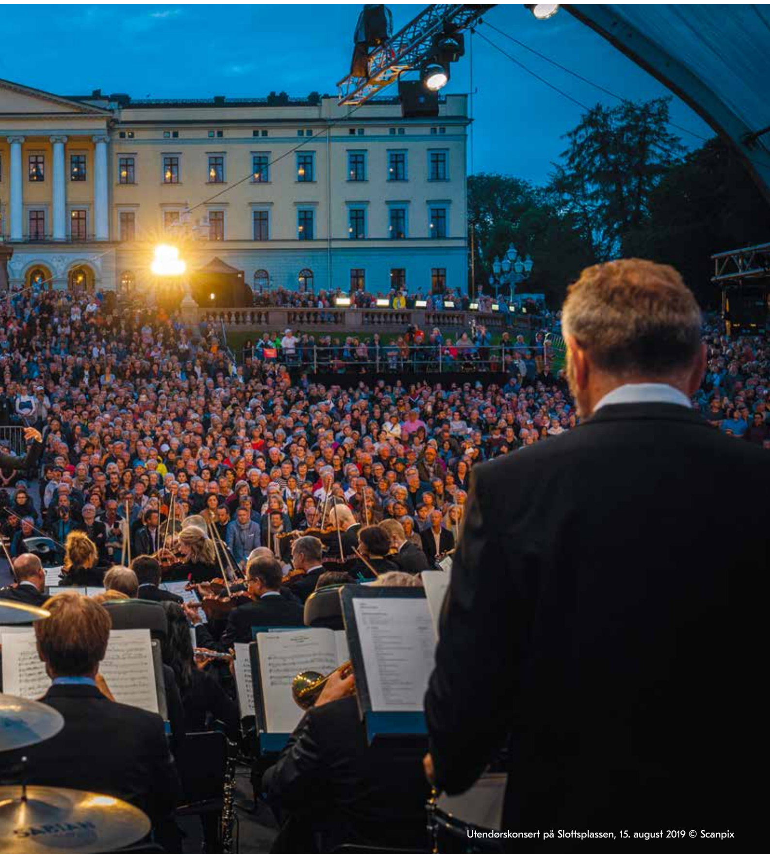
Utendørskonsert på Slottsplassen, 15. august 2019