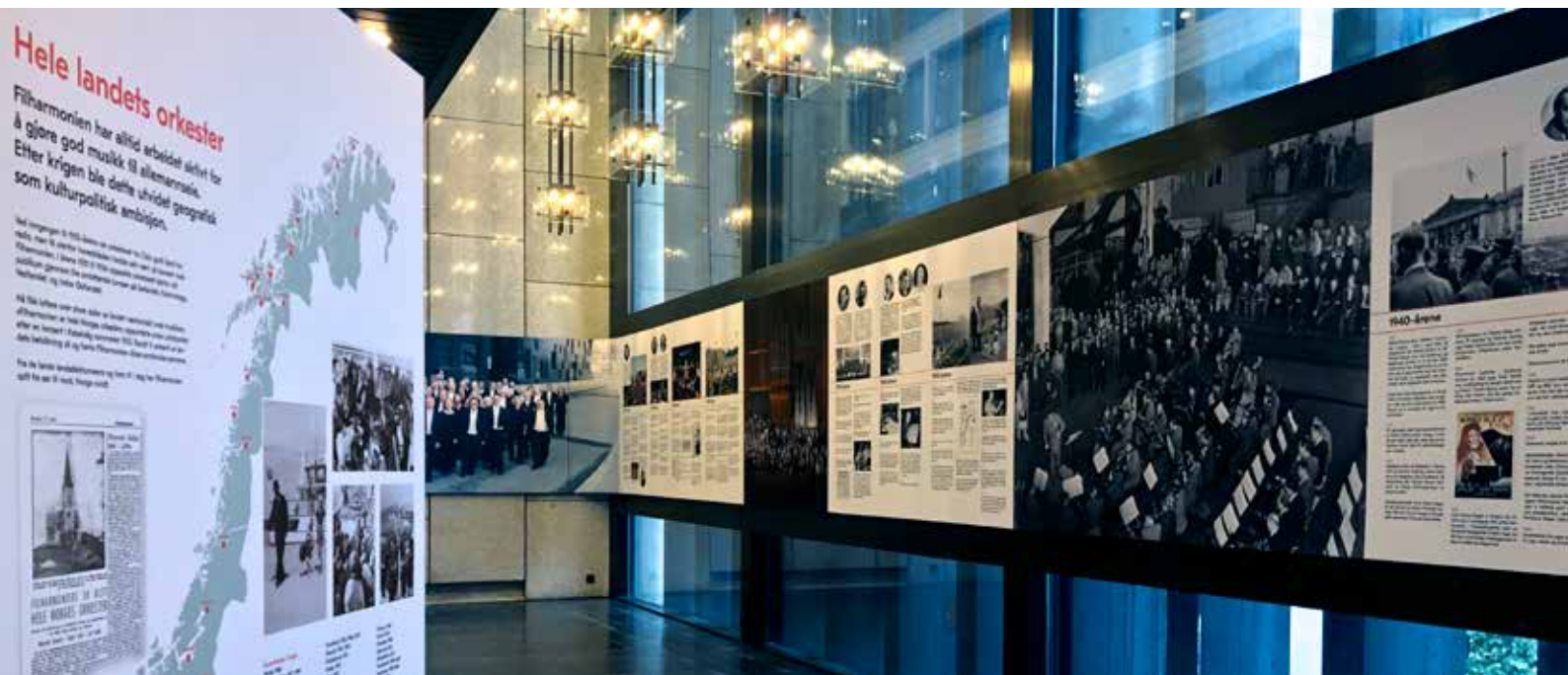
Jubileumsutstilling, september 2019

ble bredt eksponert på sosiale medier og boards i hele Oslo i starten av sesongen. Samarbeidet med en rekke ulike private aktører, deriblant Sporveien, for å få enda større oppmerksomhet rundt nabolagskonsertene og konserten på Slottsplassen, ga resultater.