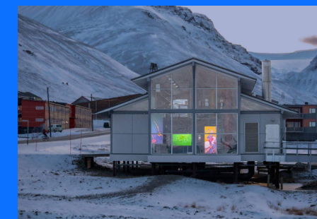
↑ Prosjekt Isfjorden – Skulptur i form av dom med mobilé – laget av 44 Flavours og Longyearbyen Folkehøyskole

I 2019 har vi mottatt prosjektstøtte fra Samfunnsløftet til Prosjekt Isfjorden.