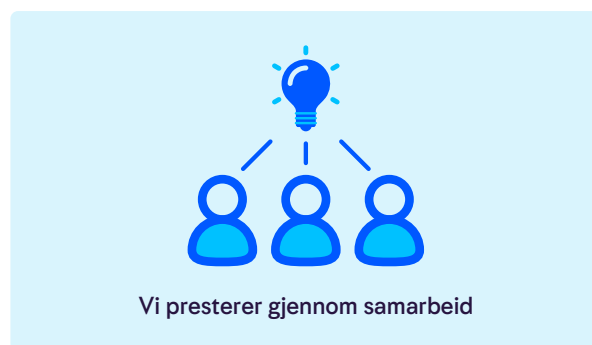
Verdibasert ledelse og lederprinsipper

Etter en stor omorganisering i 2018, var 2019 året da vi sammen fikk den nye organisasjonen til å fungere.