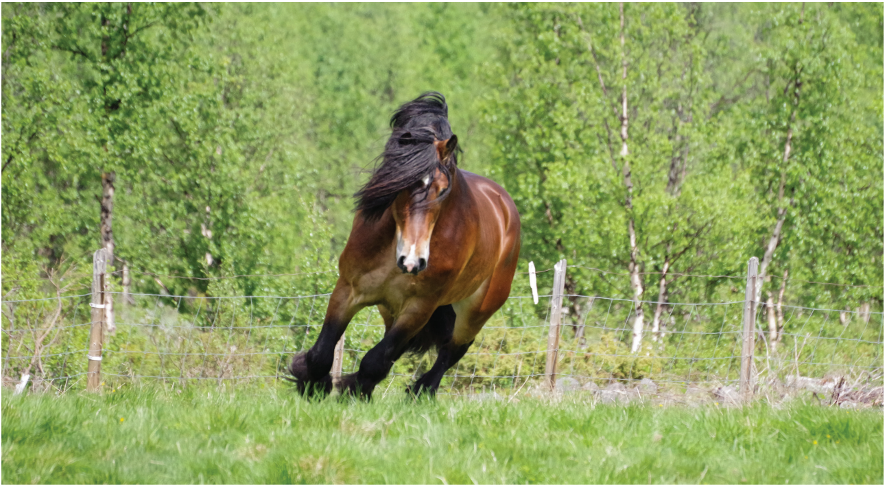
Sellands Even under slippet i Åkrehamna (Sikkilsdalen) i 2020.