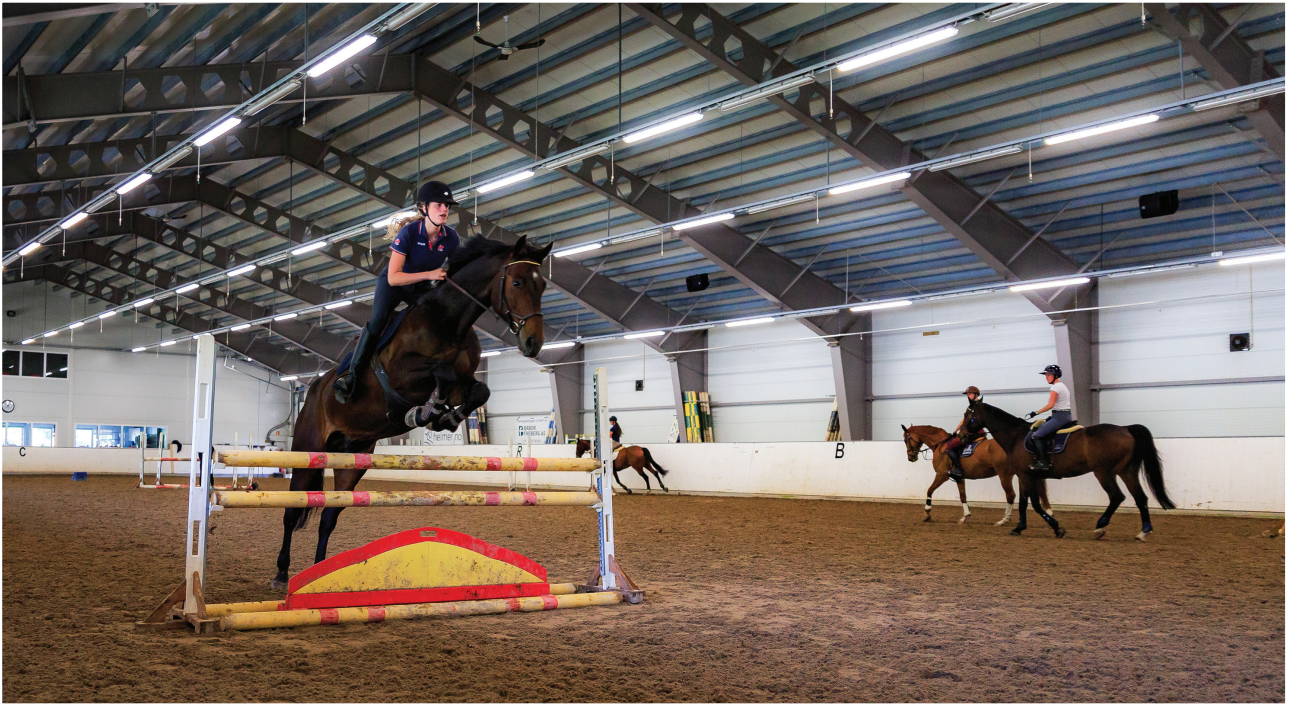
Sprangundervisning i øvre ridehus.

Norsk Hestesenter eier et betydelig anlegg som er nødvendig for å drive utdanningsvirksomheten. Anlegget består blant annet av tre ridehus, stallplass til nesten 150 hester, internat for studentene og kurscenter med overnattingskapasitet. Det er ride- og kjøreløyper over hele anlegget, kjørebane og kjørehinder. I tillegg er det utendørs sprangbane, dressurbane, islandshestbane (ovalbane), naturridebane og feltritt hinder over hele anlegget. Det er også travbane, to rettstrekker og to skrittemaskiner.