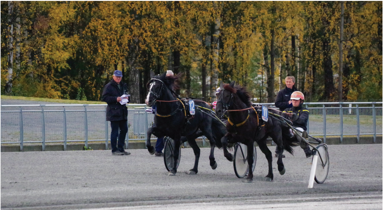
Fra travprøva under kåringa av kaldblodshingster på Biri travbane høsten 2020.

tidig avlsgodkjenning for 2020 basert på vurdering av veterinærattest og testing for sølvgen. Det ble godkjent 18 hingster for avlssesongen 2020 med en kvote på 5 hopper. Hingstene må møte til ordinær vurdering i 2021 for videre avlsgodkjenning.