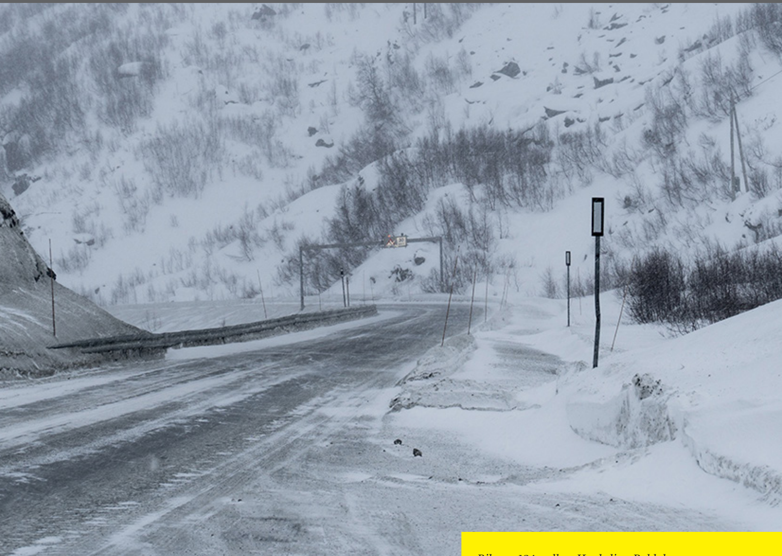
Riksveg 134 mellom Haukeli og Røldal