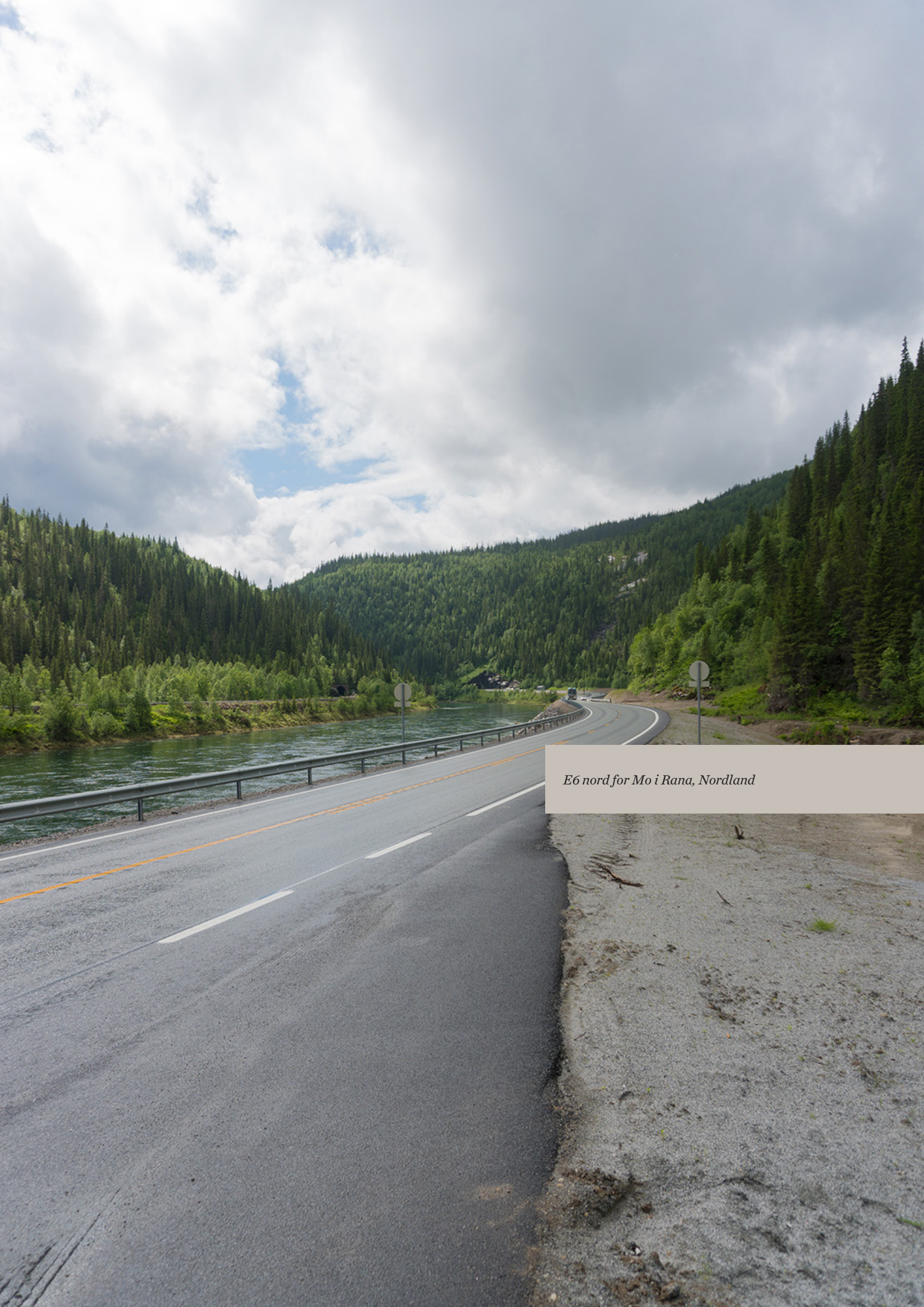
E6 nord for Mo i Rana, Nordland