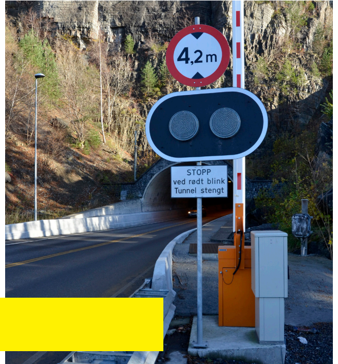
Fotografier fra inspeksjoner