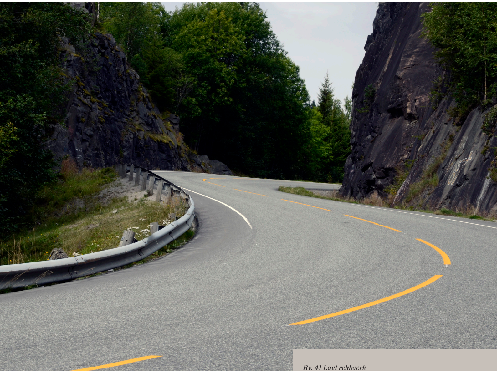
Rv. 41 Lavt rekkverk