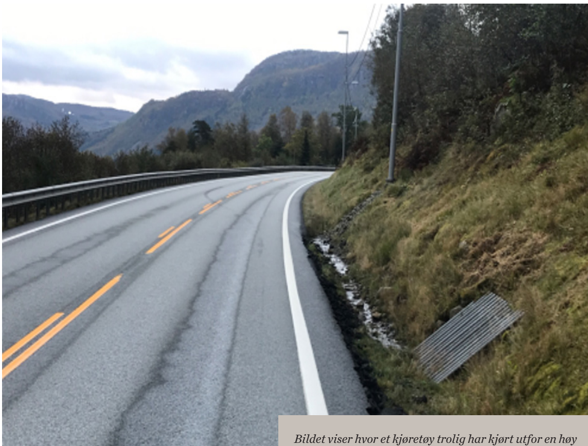
Bildet viser hvor et kjøretøy trolig har kjørt utfor en høy asfaltkant, skadet kanten, og så skrenset over i motsatt