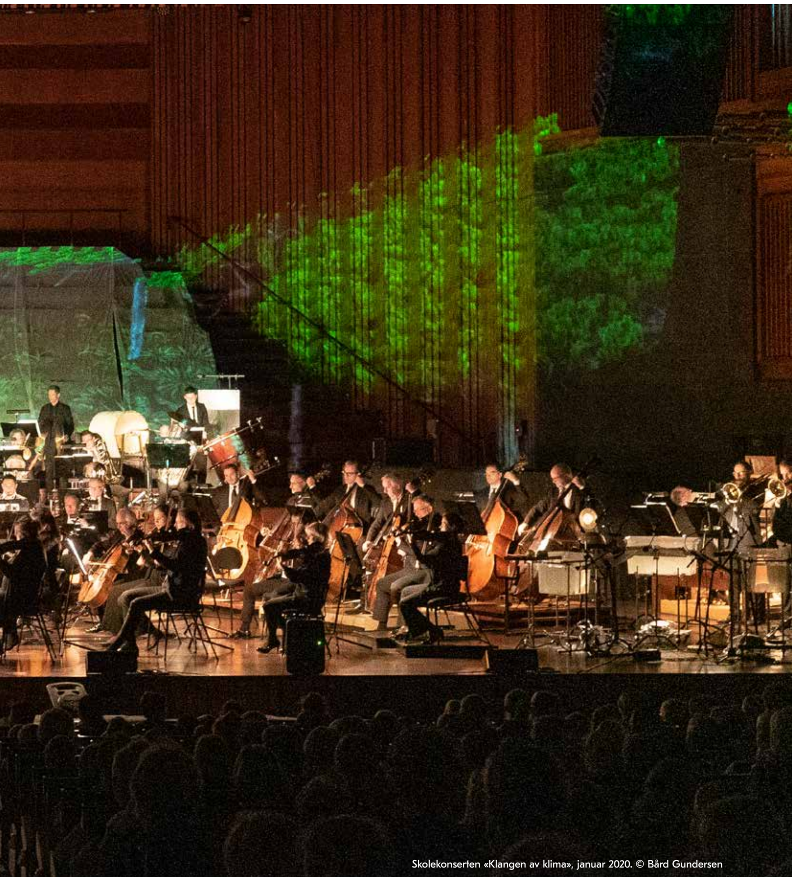
Skolekonserten «Klangen av klima», januar 2020.