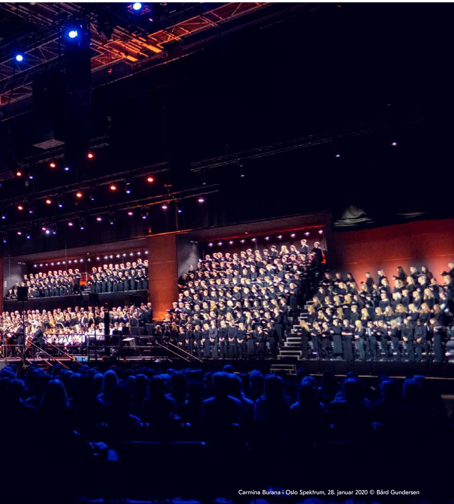
Carmina Burana i Oslo Spektrum, 28. januar 2020