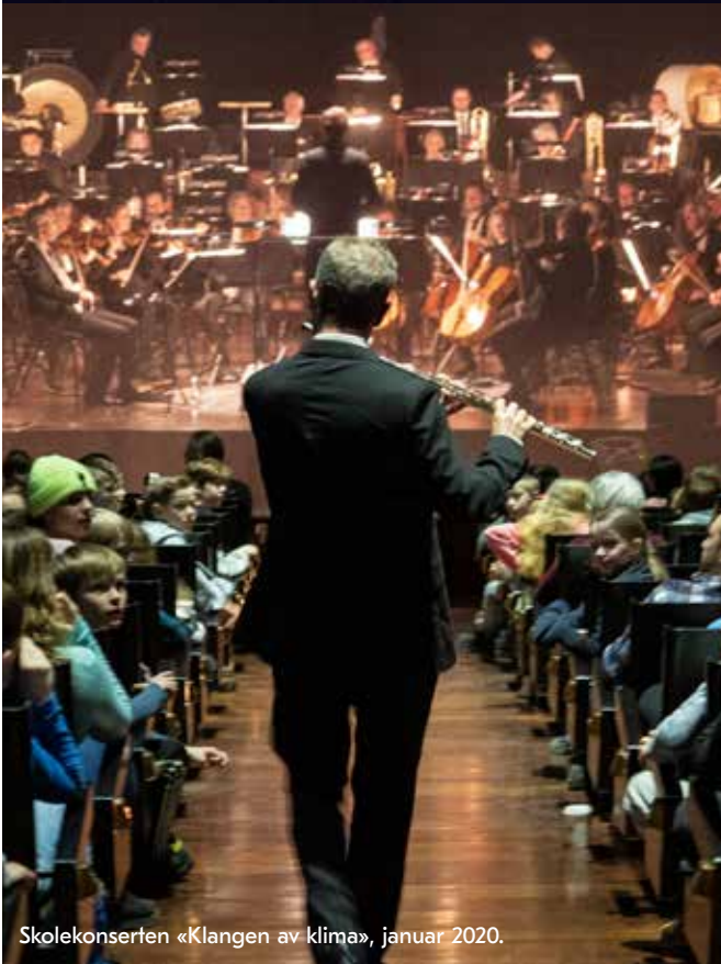
Skolekonserten «Klangen av klima», januar 2020.