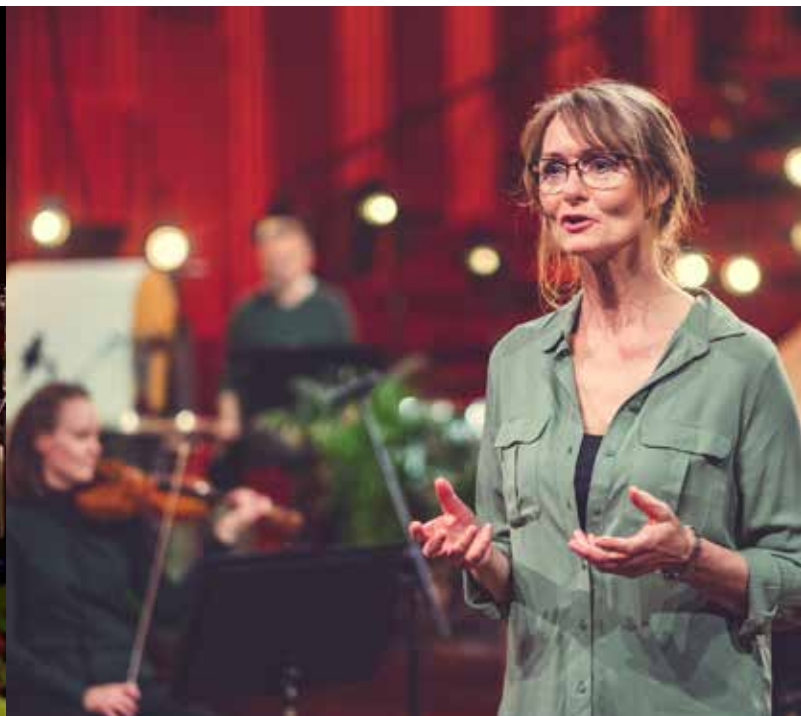
Mellomspill, Eventyrskogen 19. mai 2020

Vi rakk å gi ut tre innspillinger i 2020 med musikk av Richard Strauss, Rimsky-Korsakov og Miaskovskij