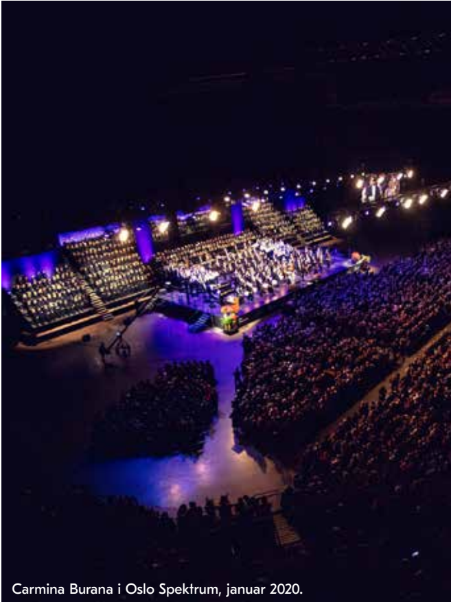
Carmina Burana i Oslo Spektrum, januar 2020.