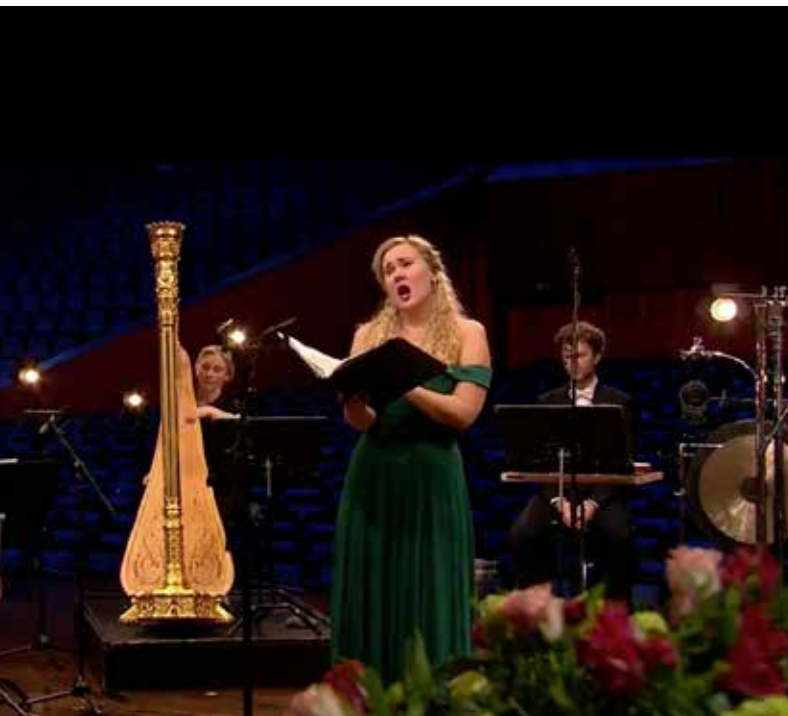
Mellomspill, 20. mai 2020

oppmerksomhet. Mäkelä har, tross sin unge alder, allerede oppnådd en oppsiktsvekkende posisjon i musikkmiljøet. At vi er det første orkestret som han er sjef for, genererer stor interesse.