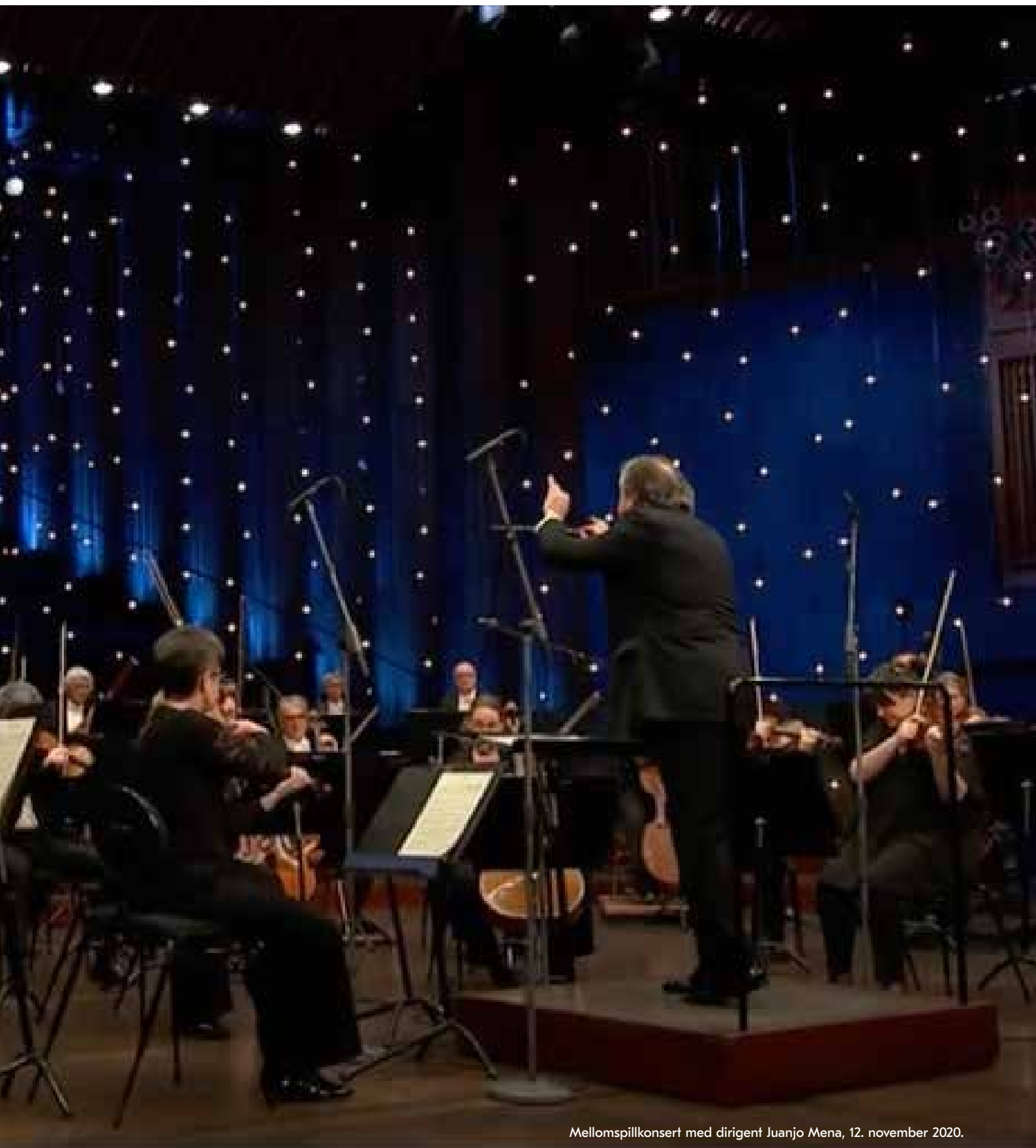
Mellomspillkonsert med dirigent Juanjo Mena, 12. november 2020.