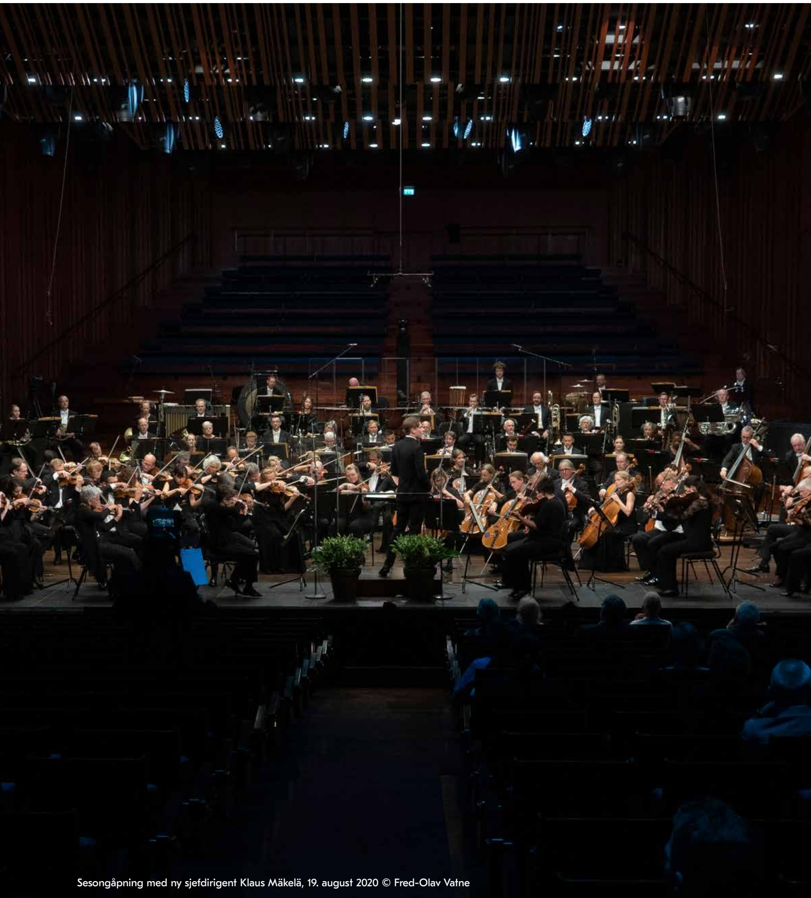
Sesongåpning med ny sjefdirigent Klaus Mäkelä, 19. august 2020