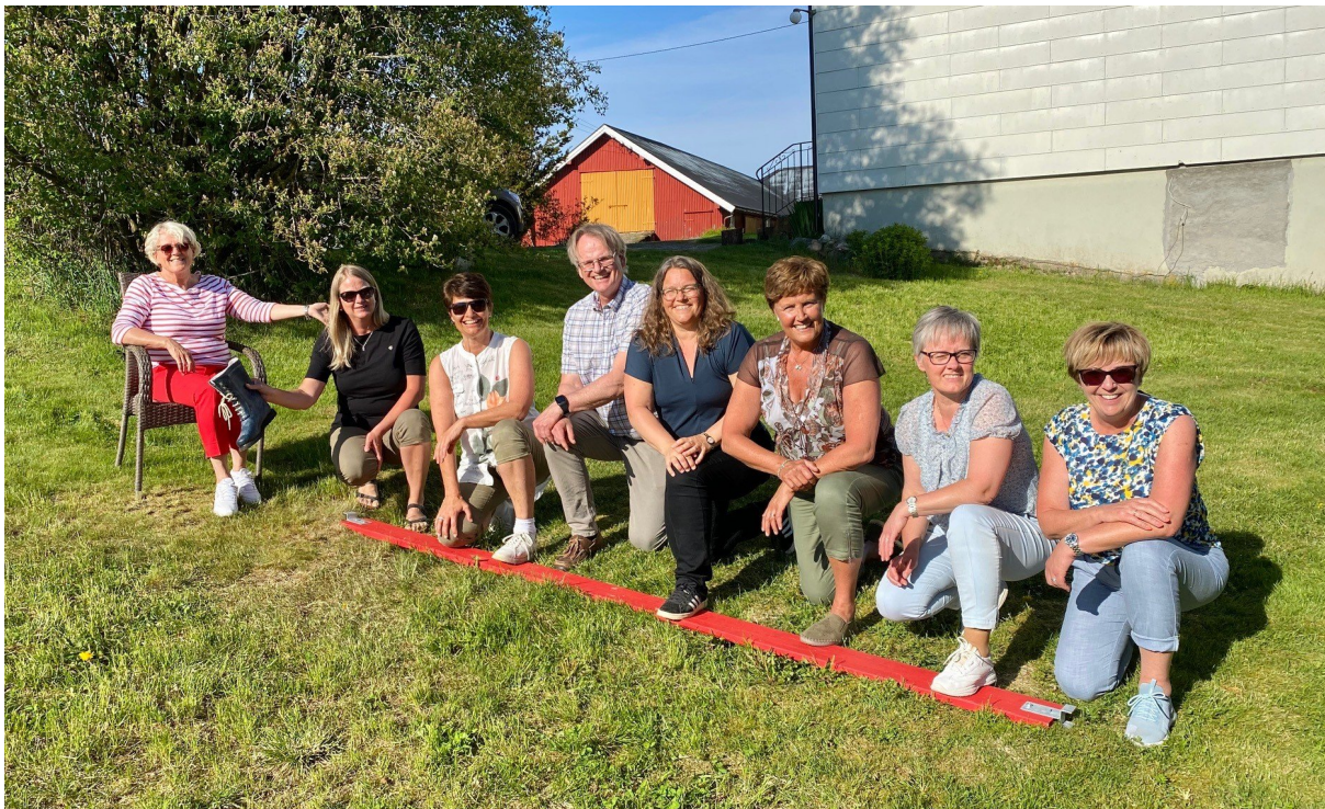
Leiarsamling 31. mai 2021

Statsforvaltaren i Møre og Romsdal er lokalisert på Fylkeshuset i Molde. Vi er tilsaman 151 tilsette, og i 2021 utgjorde dette 131,6 årsverk.