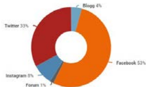
Tabell: Oversikt over sosiale medier der NIHs merkenavn var synlig i 2021 (kilde: Retrievev)

I sosiale medier er Facebook den viktigste kanalen når det gjelder synlighet, etterfulgt av Twitter og Instagram. Facebook er også den kanalen hvor tilbøyeligheten til deling blant følgerne er størst.