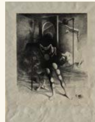
Wilhelm Freddie, Ars Konstserie , 1945. © Freddie, Wilhelm/BONO