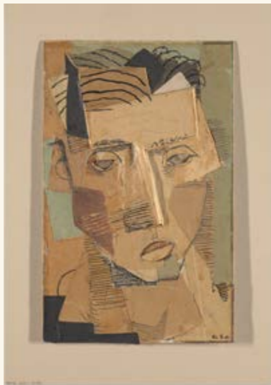
Aage Storstein, Selvportrett i collage , 1931. © Storstein, Aage/BONO.