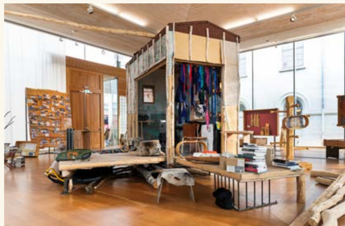
Fra utstillingen «Girjegumpi. Samisk arkitekturbibliotek» på Nasjonalmuseet – Arkitektur.