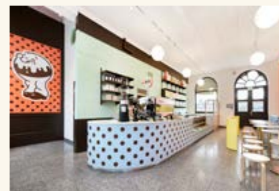
Bollebar, det nye Nasjonalmuseets første serveringssted, åpnet 3. september.