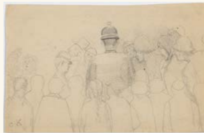
Christian Krohg, Gatescene , 1880-tallet.