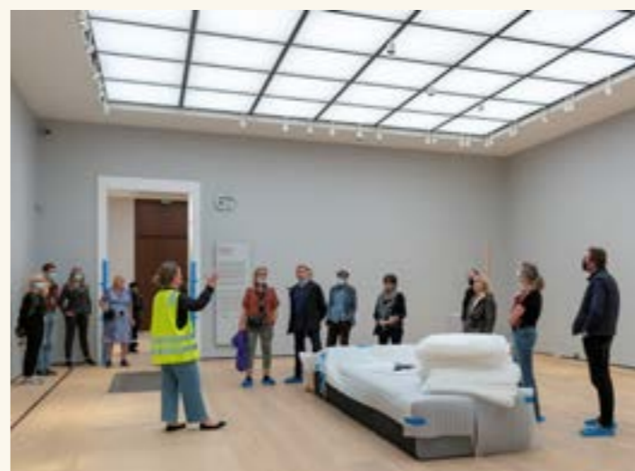
Fra juni ble publikum invitert til inn i det nye museet mens det ble ferdigstilt i omvisningsserien «Velkommen inn». Omvisningene var gratis og i løpet av året benyttet over 3 700 mennesker seg av tilbudet, som fortsetter ut februar 2022.