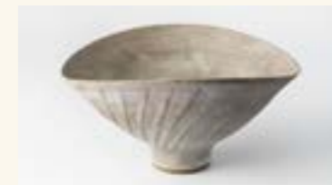
Lucie Rie, Flared Fluted Bowl , ca. 1980.