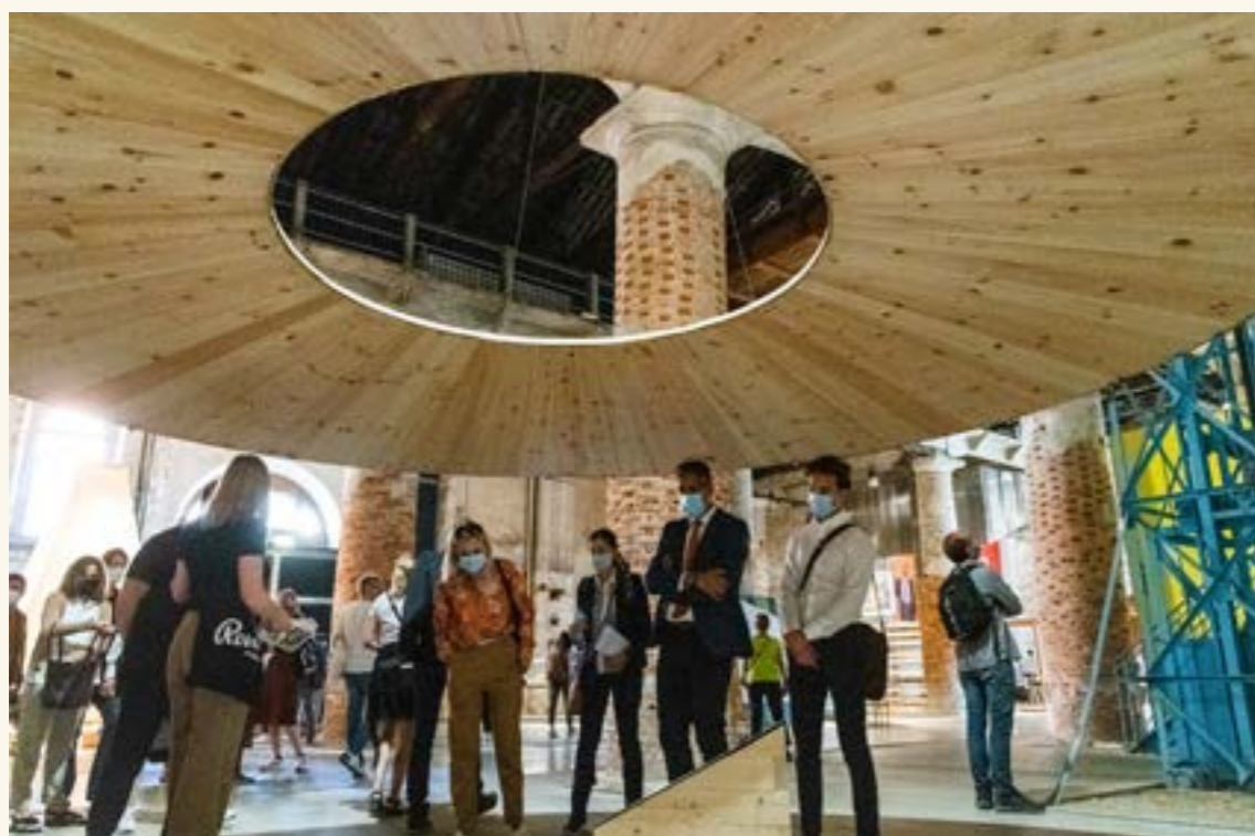
Nasjonalmuseet sto for utstillingen «Det vi deler» («What we share») sammen med arkitektkontoret Helen & Hard i den nordiske paviljongen på arkitektbiennalen i Venezia.