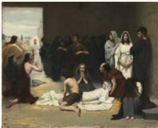
Asta Nørregaard, Kristus kommer , antakelig 1881.