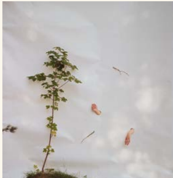
Else Marie Hagen, Diverse tilhørende elementer , 2019. © Hagen, Else Marie/BONO