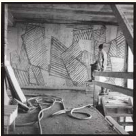
Carl Nesjar, Verk av Tore Haalands i Høyblokka , antakelig 1958. © Nesjar, Carl/BONO.