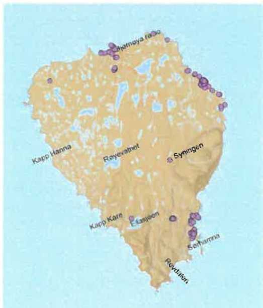
Registrerte kulturminner Bjørnøya

Bjørnøya ligger i Barentshavet mellom Svalbard og fastlandet. Øya er ca. 178 kvadratkilometer. Den nordligste delen av øya er flat og den sørlige ender i høye stup og klippevegger. Største lengde nordsør er 20 km og største bredde østvest er 15,5 km. Eneste bosetningen er den meteorologiske stasjonen helt nord på øya.