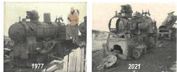
Foto av lokomotivet fra 1977 og fra 2021 viser tydelig hvor fort nedbrytingen skjer

Kings Bay AS anbefaler at det gjennomføres en mer detaljert dokumentasjon og beskrivelse av kulturmiljøet i Tunheim med driftsapparat for kullutvinning, transportårer/infrastruktur, utskipningsanlegg, bygninger mv. Dette først og fremst fordi nedbryting er i ferd med å radere bort forståelsen av sammenheng og helhet i gruvebyen samtidig som enkeltobjekt mister sin lesbarhet.