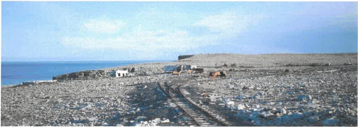
Tunheim september 2021.