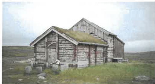
Hammerfesthuset, sept. 2021.

Bjørnøya er svært rik på kulturminner og har historie knyttet til jakt, fangst, mineralutvinning og kommunikasjon. Bjørnøya var åsted for den første store hvalrossfangsten, og har vært brukt til både norsk og russisk overvintringsfangst. De eldste kulturminnene på øya er skjelettrestre på slakteplasser for hvalross. Den eldste bevarte fangsthytten på Svalbard, Hammerfesthuset, står i Herwighamna og ble oppført i 1822. Året etter overvintret ni mann, dette er den første kjent norske fangstovervintringen på Svalbard.