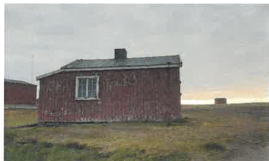
«Gamle Reserven», sept. 2021.

Kings Bay AS anbefaler at det gjennomføres tilstandsvurdering med dokumentasjon av verneverdi og restaureringsbehov for «Gamle Reserven» som ligger i tilknytning til Bjørnøya meteorologiske stasjon. Bygget er sannsynligvis fredet, men ikke registrert i Askeladden. Synlige og åpenbare behov for istandsetting og vedlikehold (lekkasje og forfall).