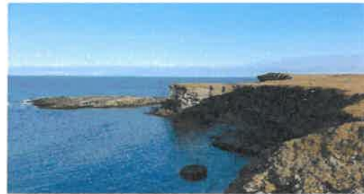
Klippekyst Bjørnøya, sept. 2021.

Forvaltningsplan for Bjørnøya (2005) skal legges til grunn for Sysseimesterens forvaltning, oppsynsansvar og gjennomføring av tiltak i naturresevatet.