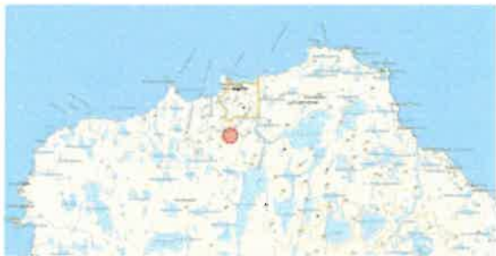
Kartutsnitt nordre del av Bjørnøya med avmerket område hvor farlig hull etter prøveboring er lokalisert

Like sør for den meteorologiske stasjonen er det et dypt hull fra prøveboring etter kull. Hullet er 4,8 m i diameter og 6,5 m dypt, og representerer stor fare for personulykke spesielt i mørketid/vinter.