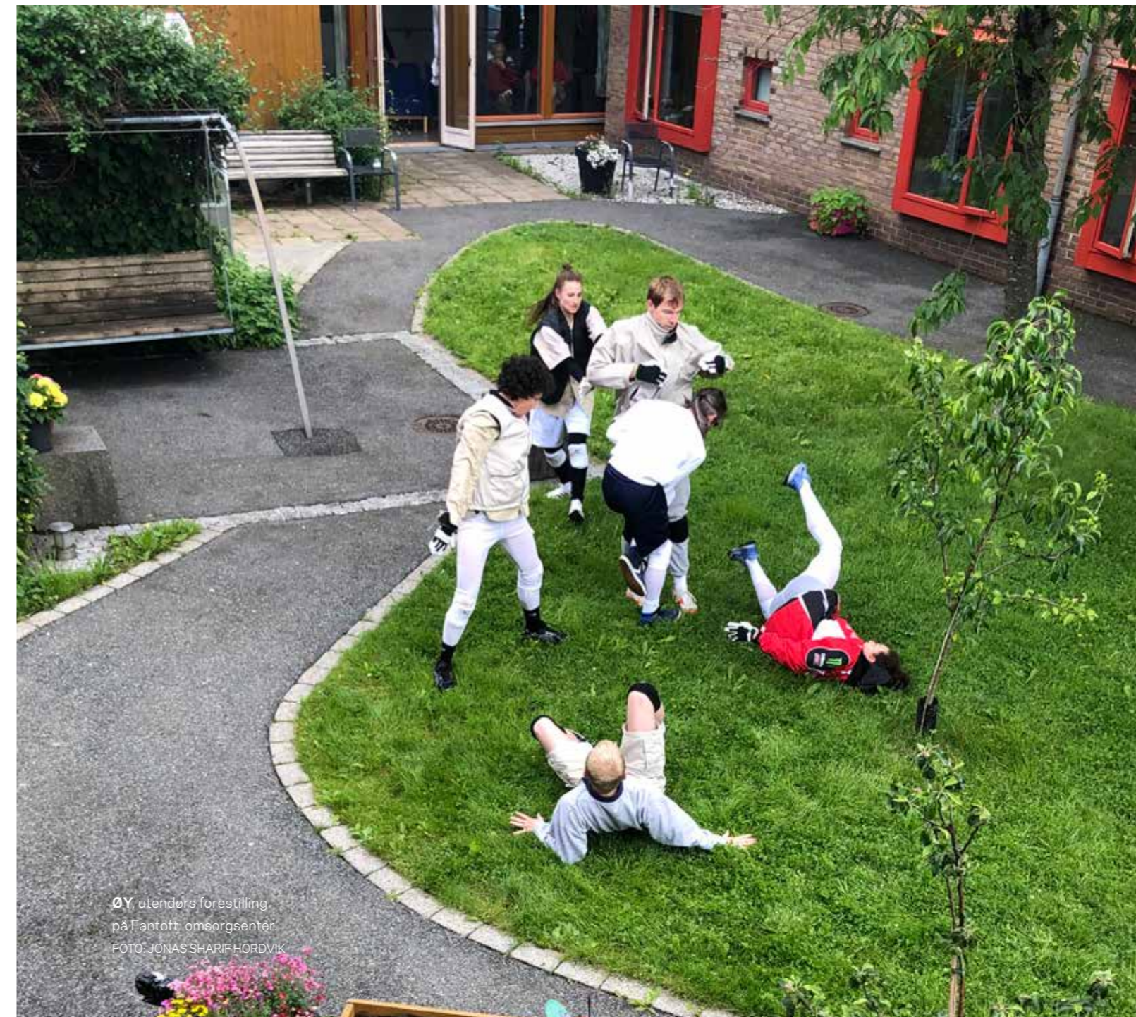
ØY utendørs forestilling på Fantoft omsorgsenter