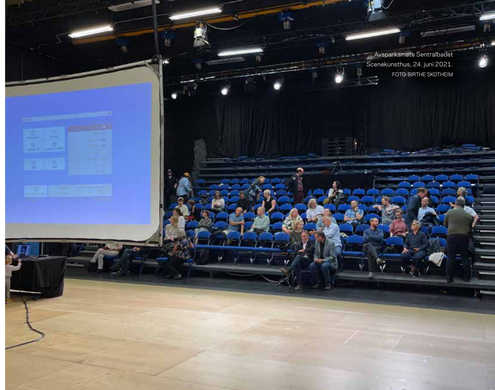
Avsparksmøte Sentralbadet Scenekunsthush, 24. juni 2021.