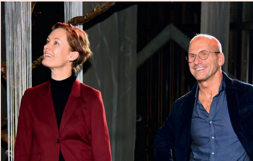
Kulturminister Anette Trettebergstuen på besøk 16. november 2021.