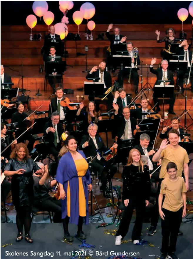
Skolenes Sangdag 11. mai 2021