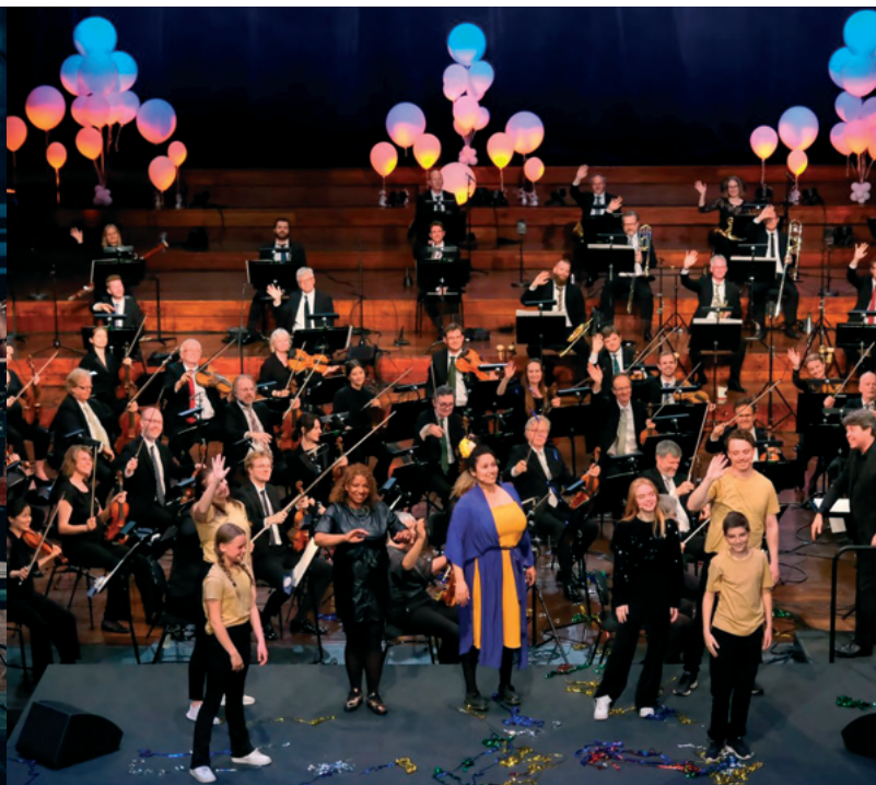
Skolenes Sangdag 11. mai 2021