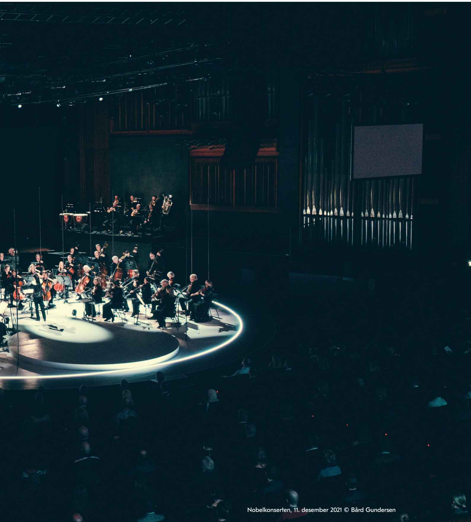
Nobelkonserten, 11. desember 2021