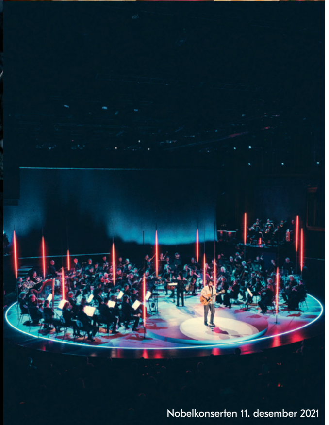
Nobelkonserten 11. desember 2021