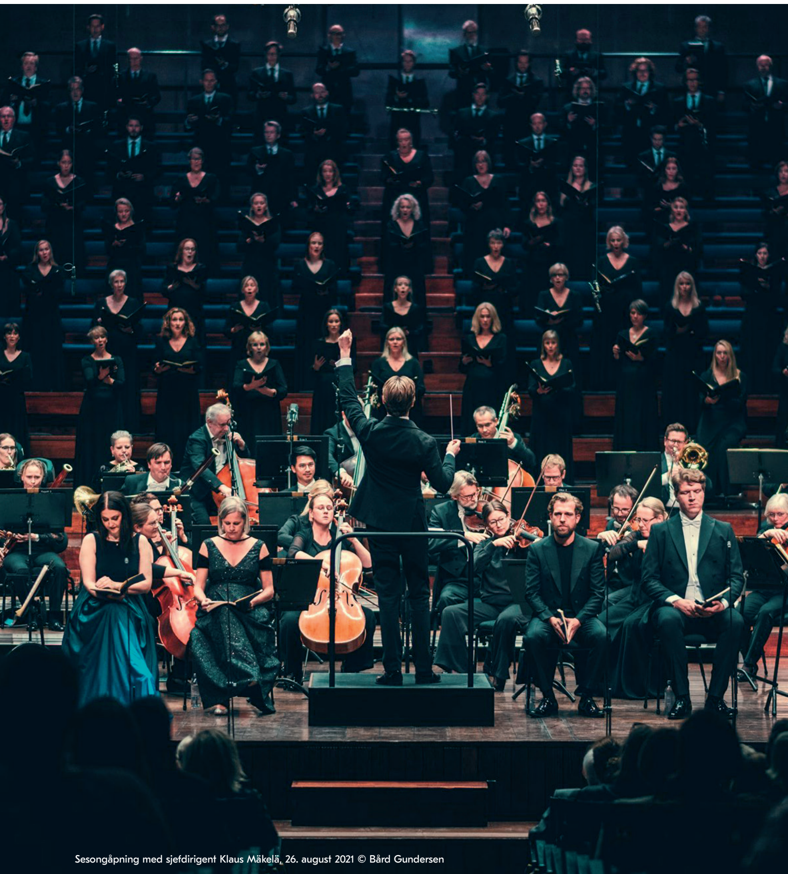
Sesongåpning med sjefdirigent Klaus Mäkelä, 26. august 2021