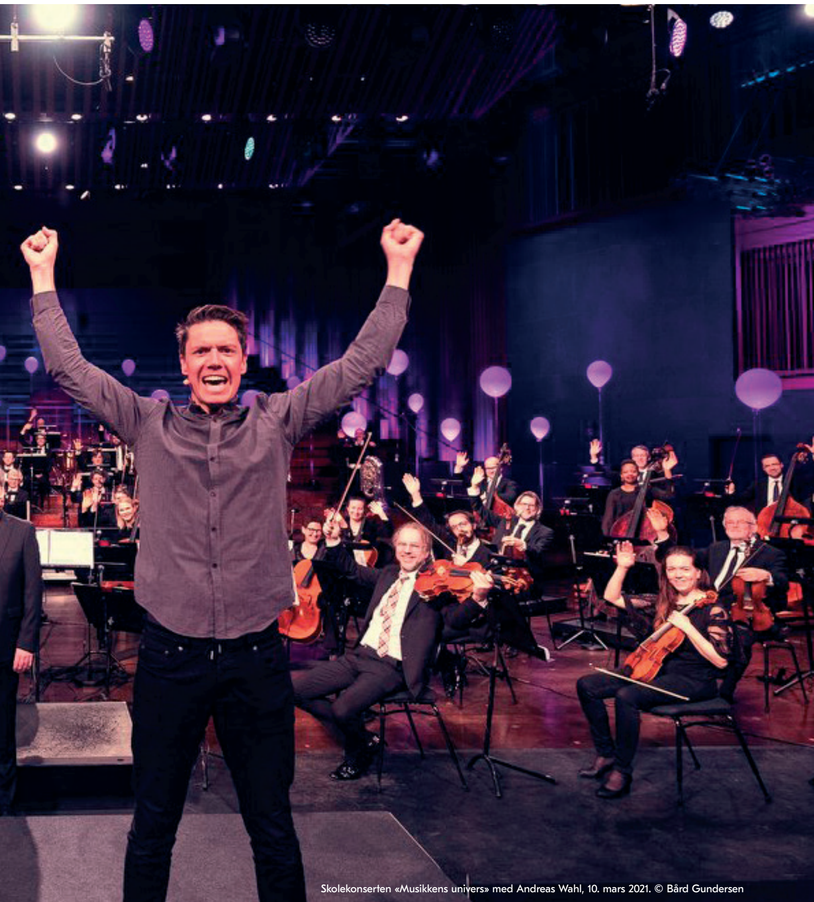
Skolekonserten «Musikkens univers» med Andreas Wahl, 10. mars 2021.