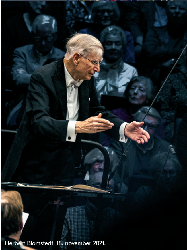
Herbert Blomstedt, 18. november 2021.